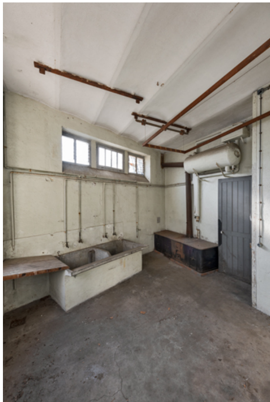
Vue intérieure de la buanderie.