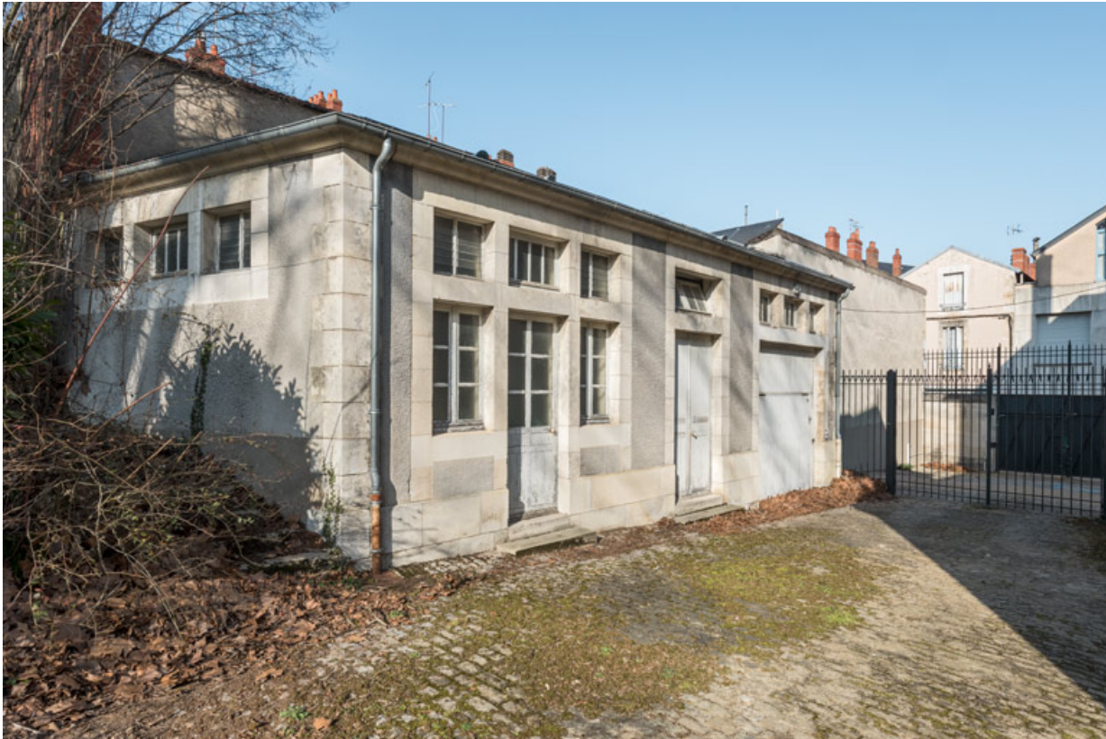
Façade sur la cour.