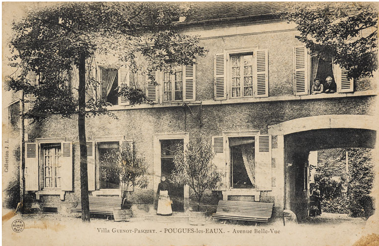
Façade de l'Hôtel dans les années 1900. 58, Pougues-les-Eaux, 62 avenue de Paris