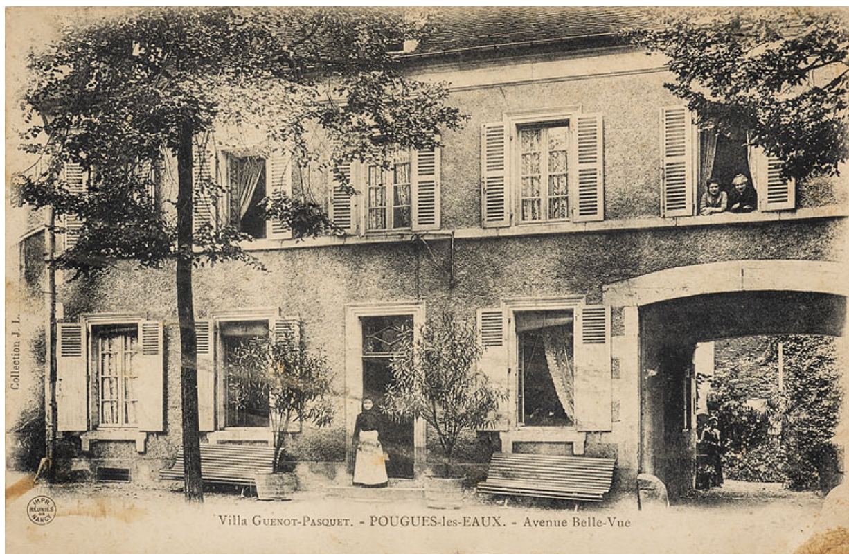
Façade de l'Hôtel dans les années 1900. 58, Pougues-les-Eaux, 62 avenue de Paris