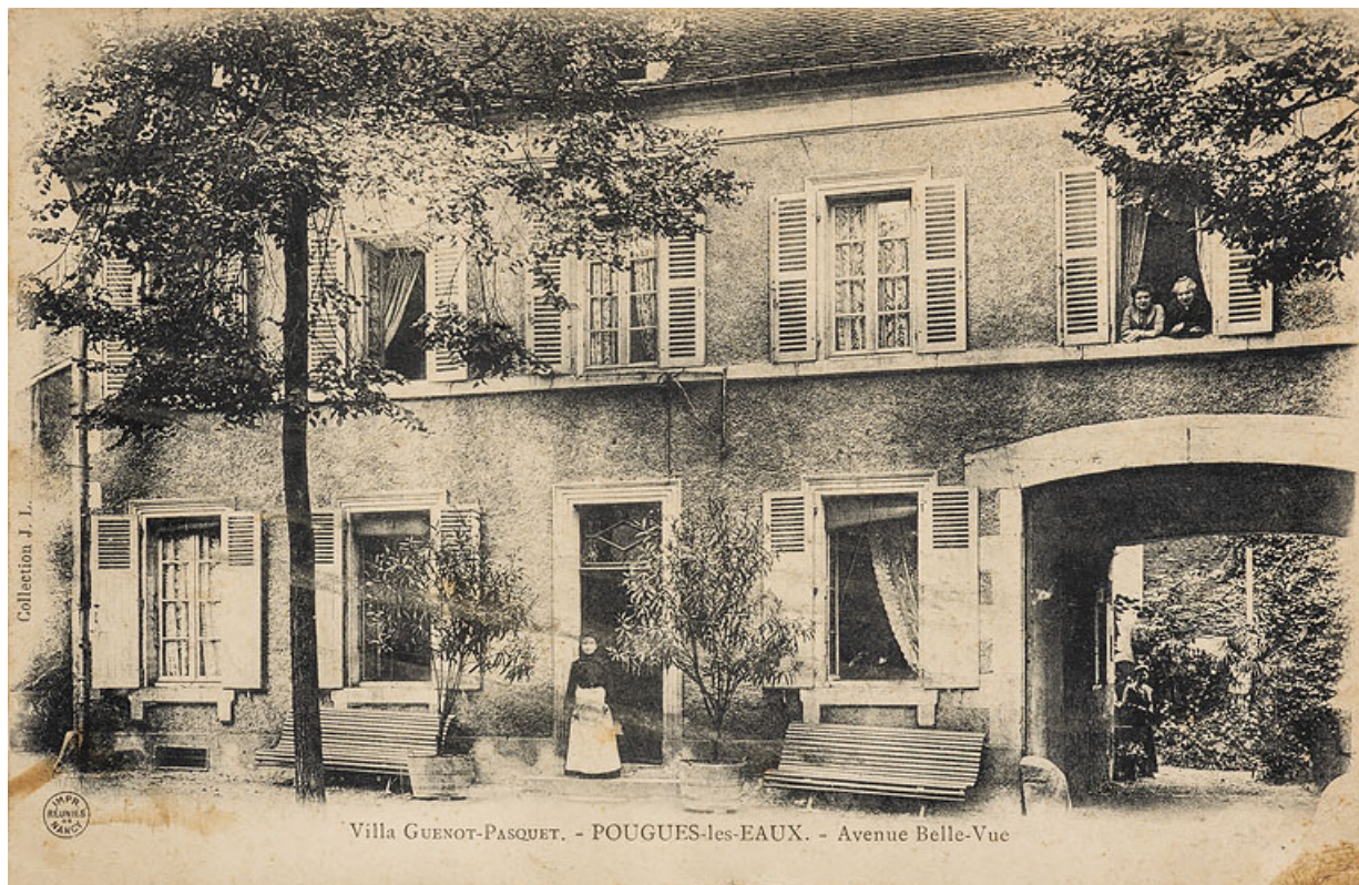
Façade de l'Hôtel dans les années 1900. 58, Pougues-les-Eaux, 62 avenue de Paris