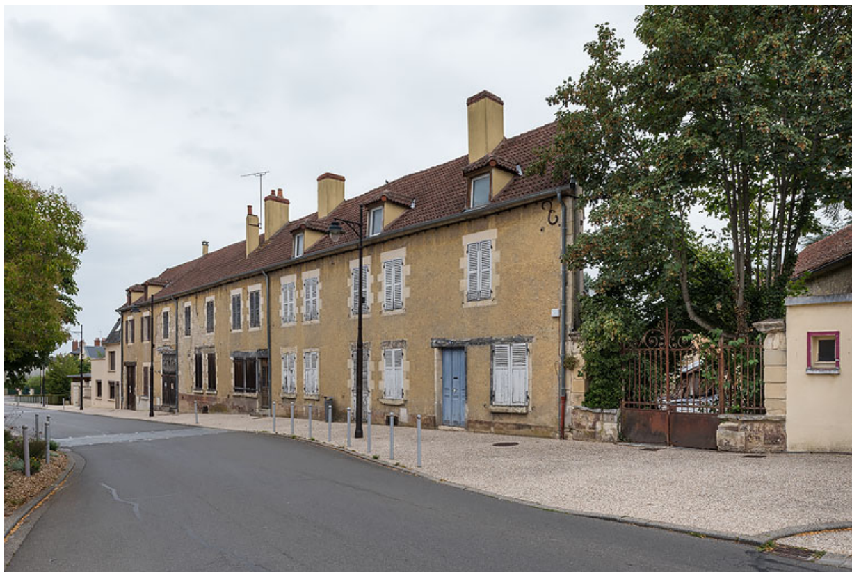
Façade sur l'avenue de Paris, vue depuis le sud-est.

58, Pougues-les-Eaux, 51-51A avenue de Paris