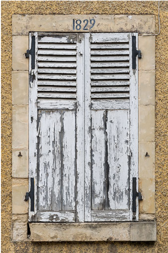
Fenêtre à encadrement de pierre portant la date (1829).

58, Pougues-les-Eaux, 51-51A avenue de Paris