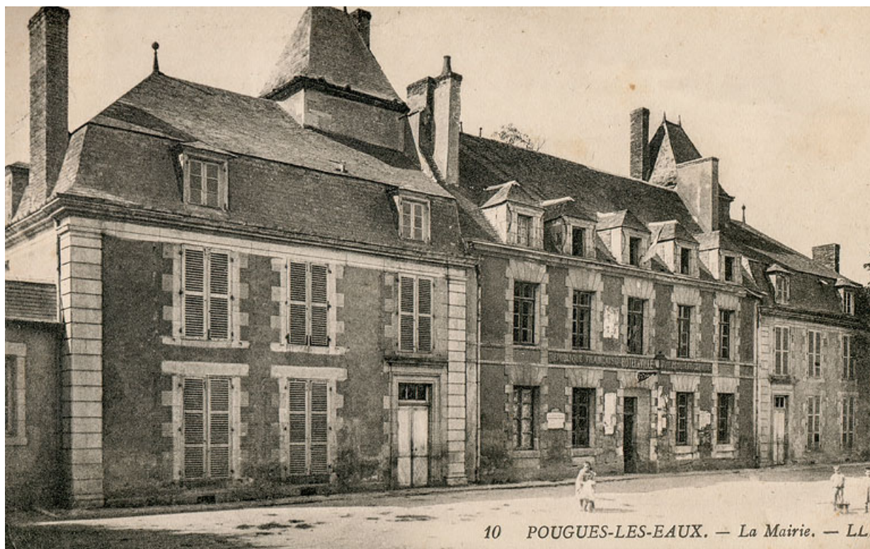
Façade à la fin du 19e siècle ou au début du 20e siècle.

58, Pougues-les-Eaux rue du Docteur Faucher