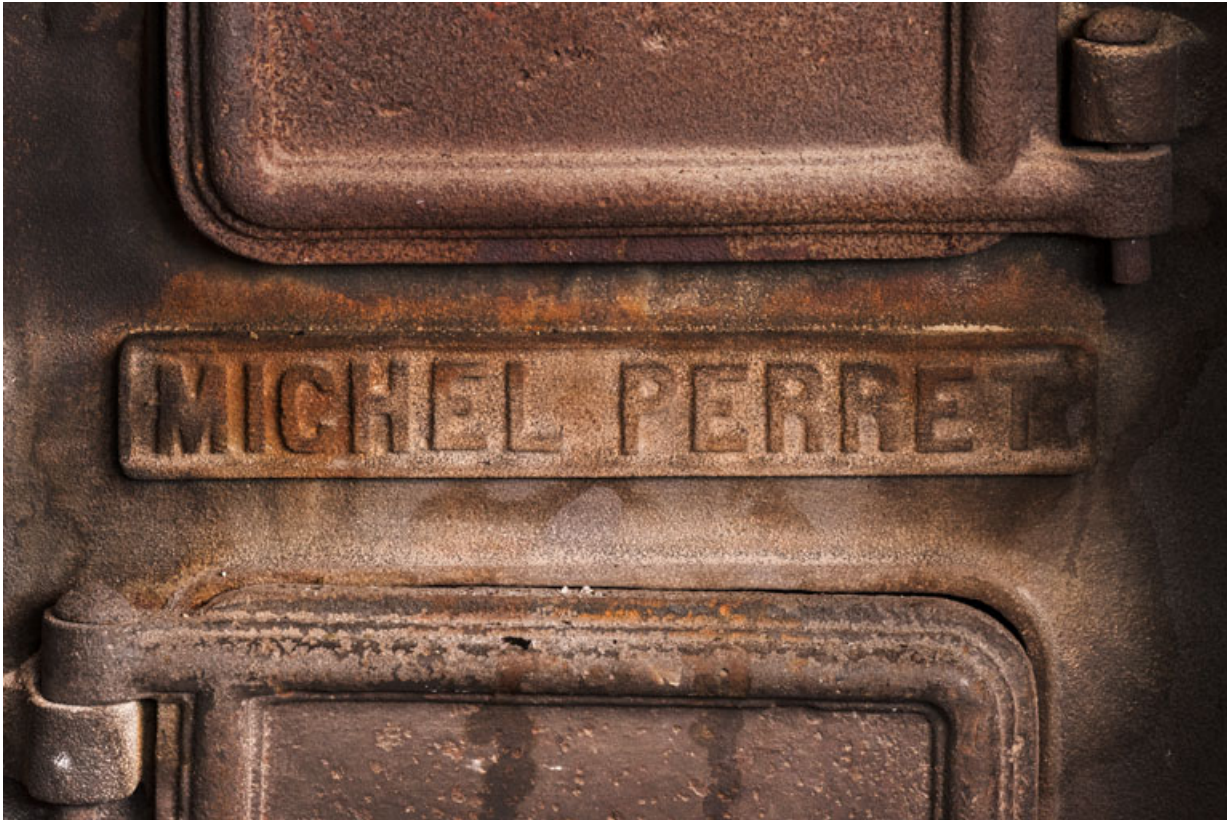
Calorifère au sous-sol, détail : plaque de firme ("Michel Perret"). 58, Pougues-les-Eaux, 130 avenue de Paris, lieudit : La Montjaie