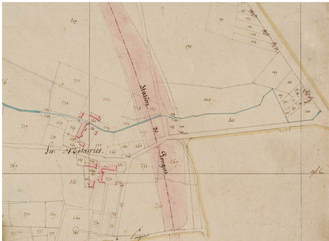
Écart des Métairies dans le plan du cadastre ancien dit napoléonien (1812) avec le tracé de la voie ferrée (vers 1861). 58, Pougues-les-Eaux rue des Sources, lieudit : Le Ponteau