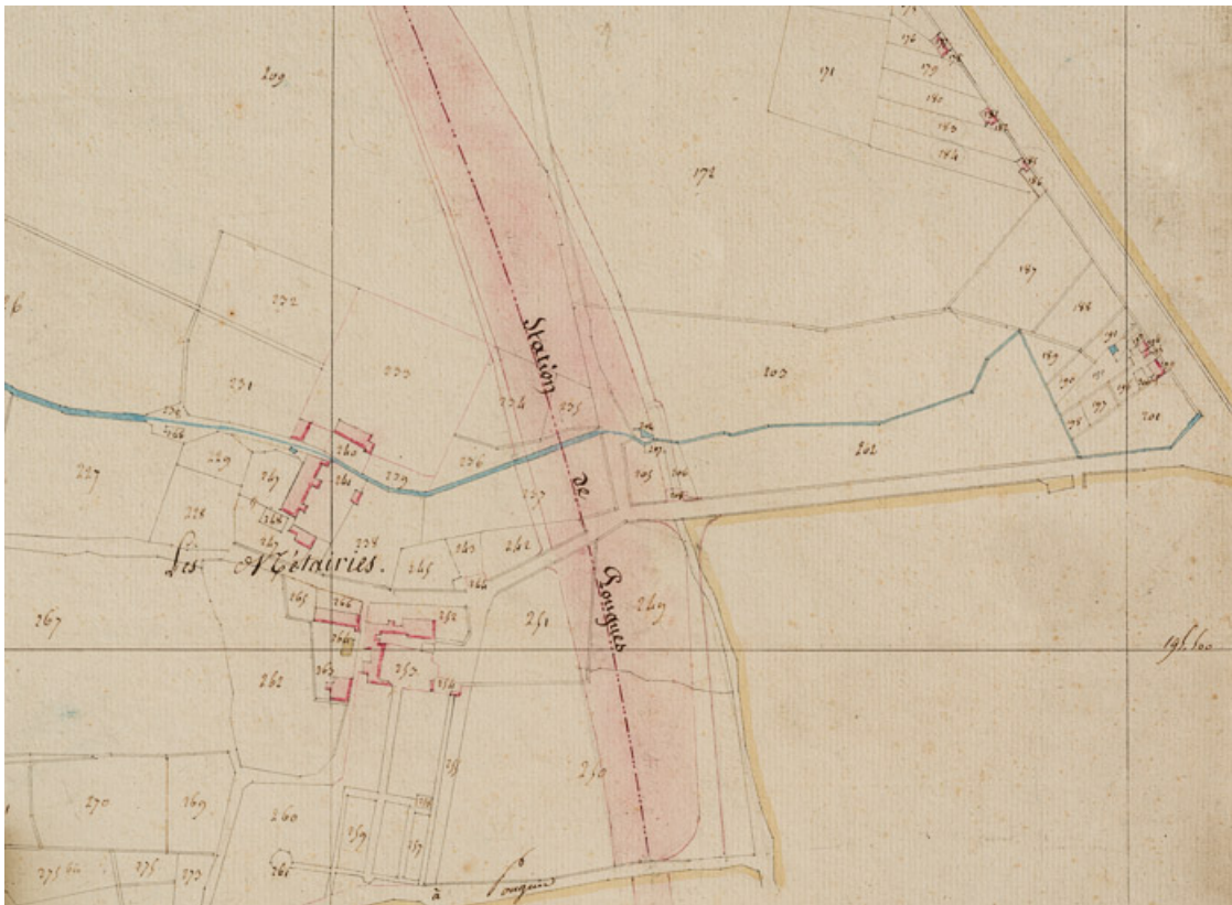
Écart des Métairies dans le plan du cadastre ancien dit napoléonien (1812) avec le tracé de la voie ferrée (vers 1861). 58, Pougues-les-Eaux rue des Sources, lieudit : Le Ponteau