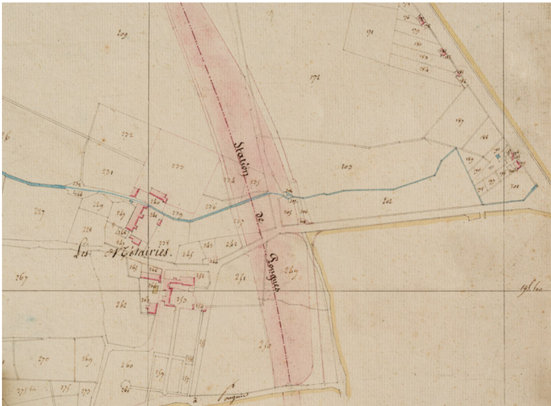
Écart des Métairies dans le plan du cadastre ancien dit napoléonien (1812) avec le tracé de la voie ferrée (vers 1861). 58, Pougues-les-Eaux rue des Sources, lieudit : Le Ponteau