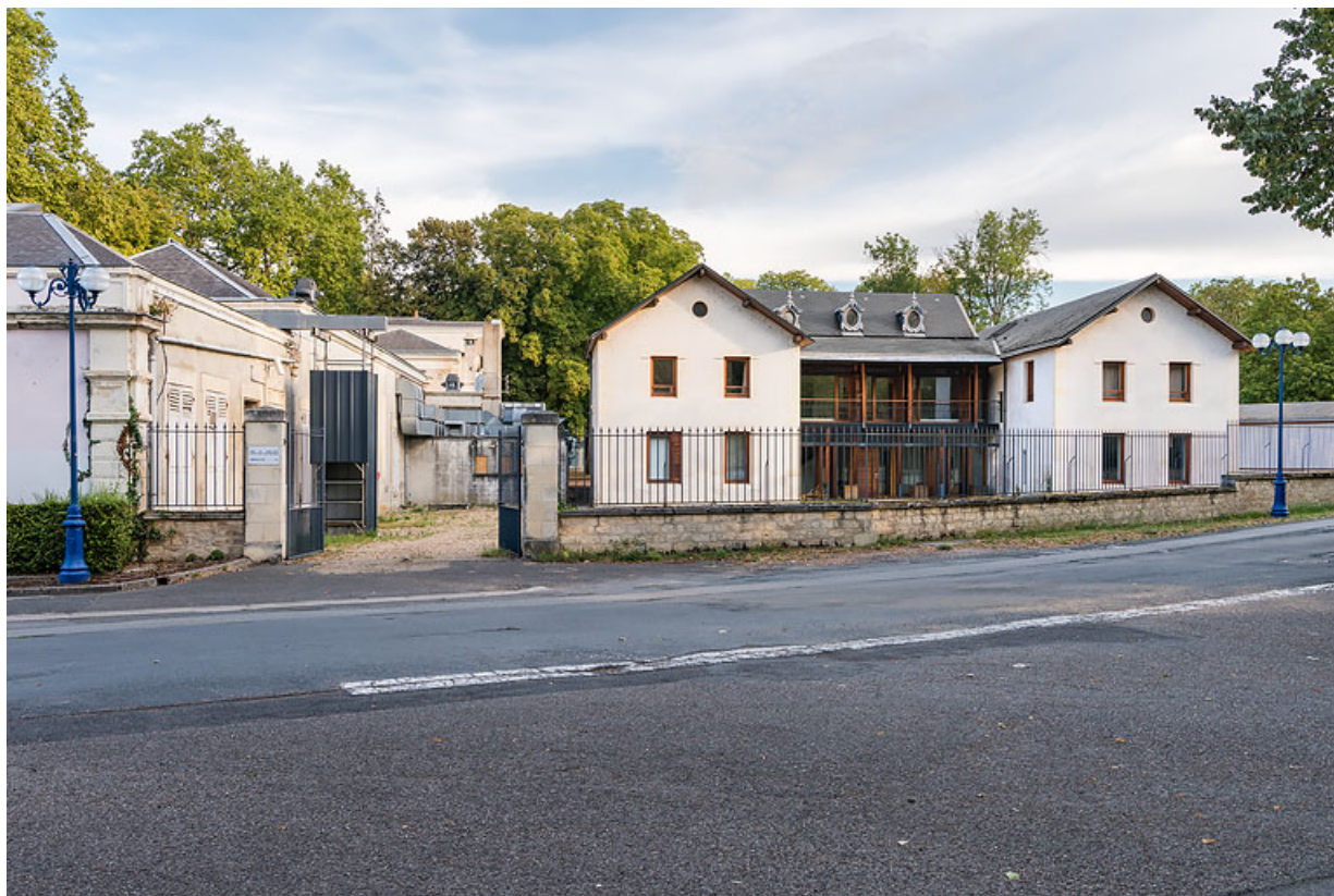
Façade principale après la transformation de l'édifice en centre d'art contemporain (Parc Saint-Léger).

58, Pougues-les-Eaux, 23-25 avenue de Conti