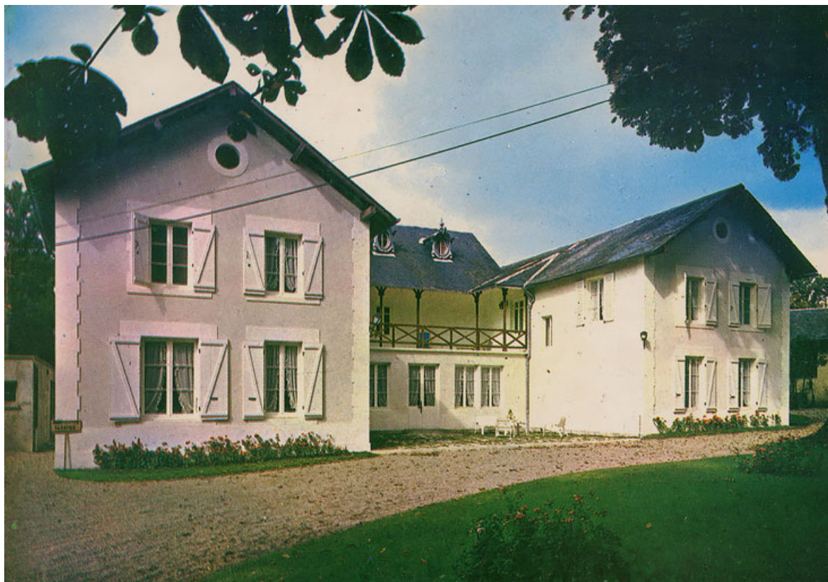
Façade principale après la transformation de l'édifice en hôtel de voyageurs (Hôtel Thermal).

58, Pougues-les-Eaux, 23-25 avenue de Conti