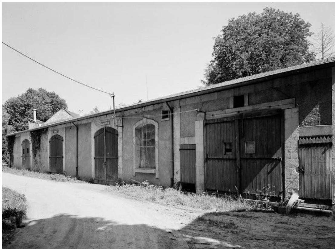
Ateliers d'entretien et pompes, face au magasin d'embouteillage.

58, Pougues-les-Eaux, 23-25 avenue de Conti