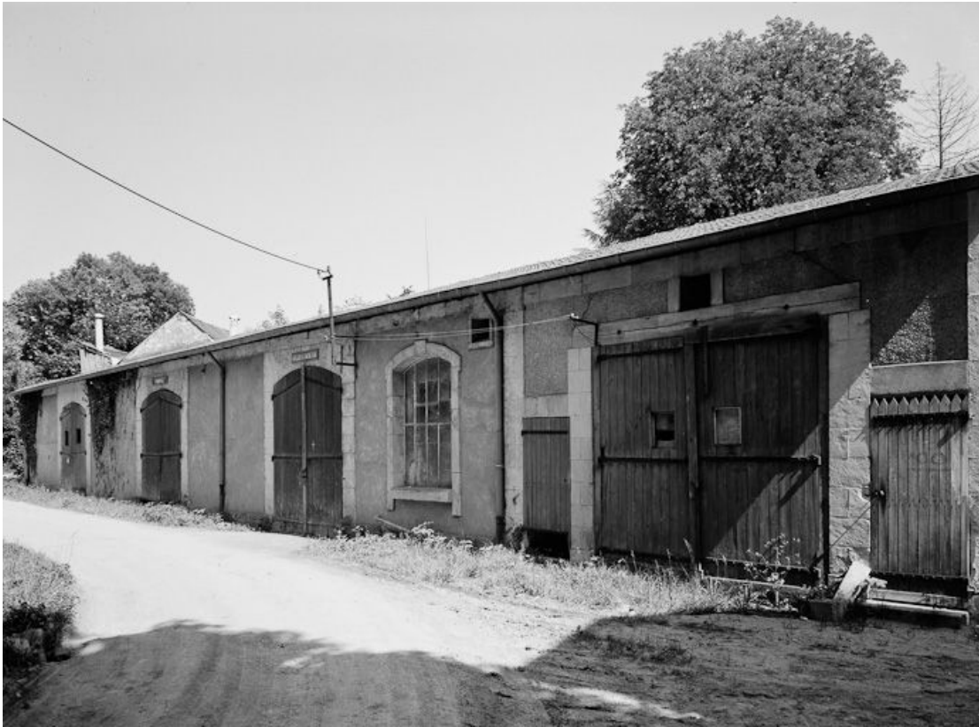
Ateliers d'entretien et pompes, face au magasin d'embouteillage.

58, Pougues-les-Eaux, 23-25 avenue de Conti