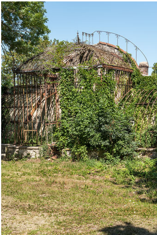
Pavillon central, vue de trois-quarts.

58, Pougues-les-Eaux, 1 rue de Bramepain