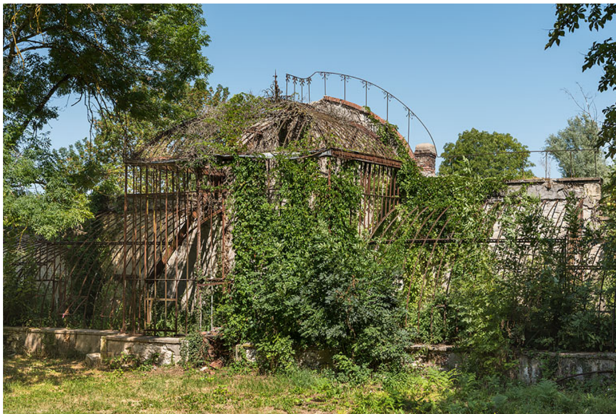
Pavillon central, vue de trois-quarts.

58, Pougues-les-Eaux, 1 rue de Bramepain