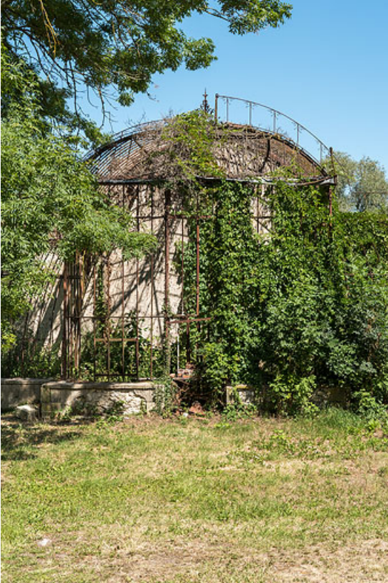
Pavillon central, vue de face.

58, Pougues-les-Eaux, 1 rue de Bramepain