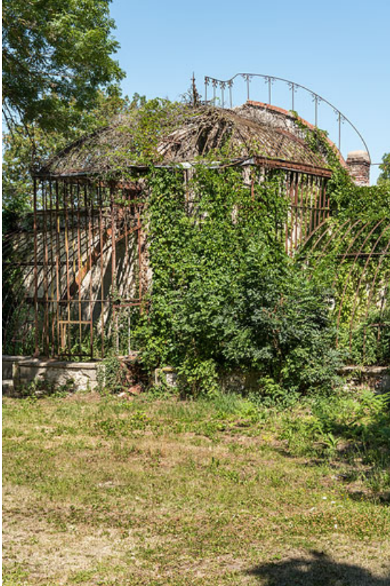
Pavillon central, vue de trois-quarts.

58, Pougues-les-Eaux, 1 rue de Bramepain