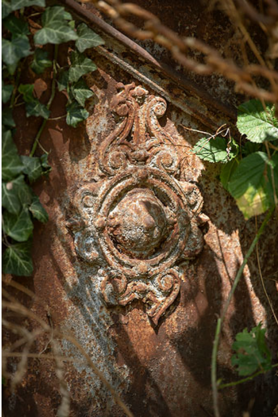
Détail du décor en fonte de la porte.

58, Pougues-les-Eaux, 1 rue de Bramepain