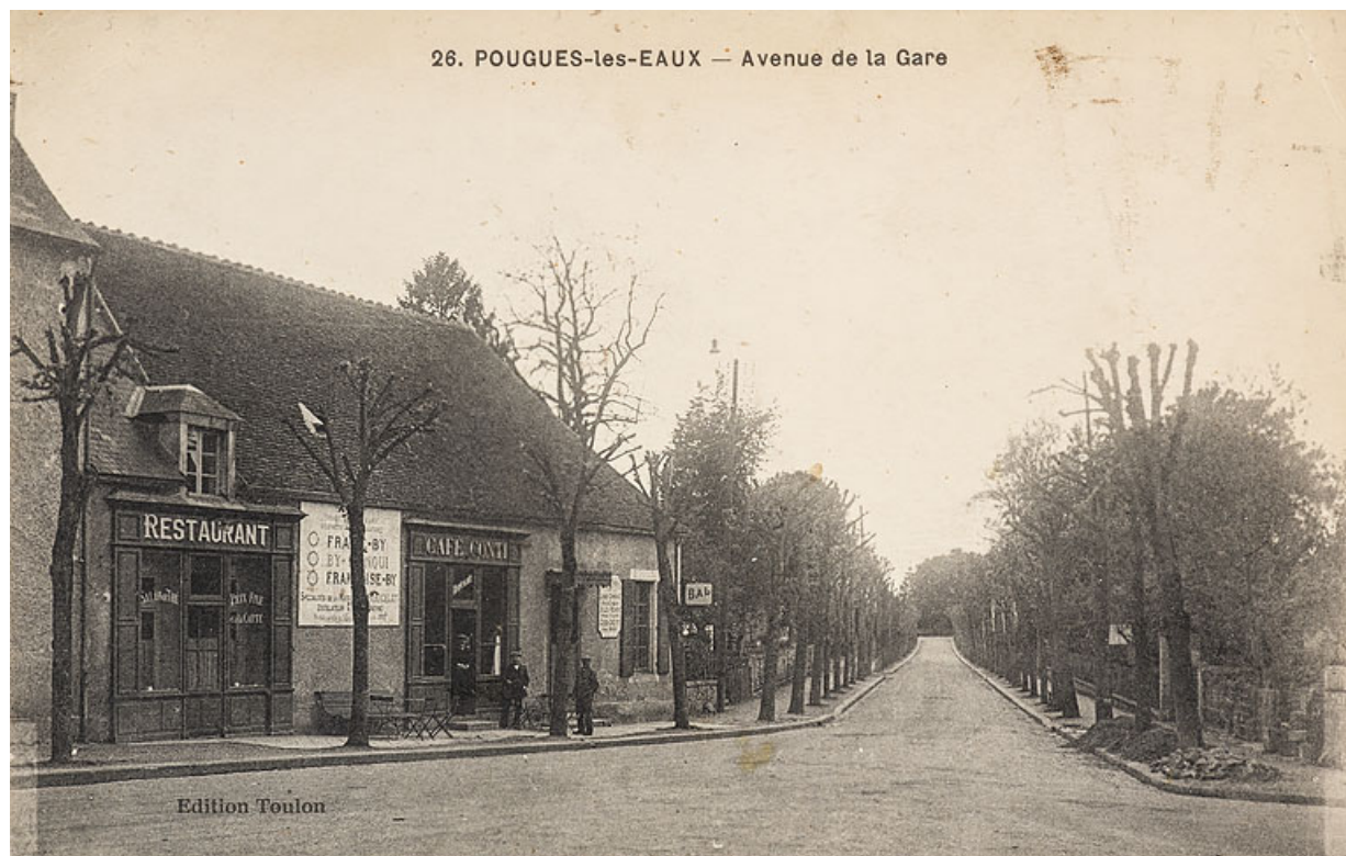
Vue de l'édifice (à gauche) au croisement de l'avenue de la Gare et de l'avenue de Paris. 58, Pougues-les-Eaux