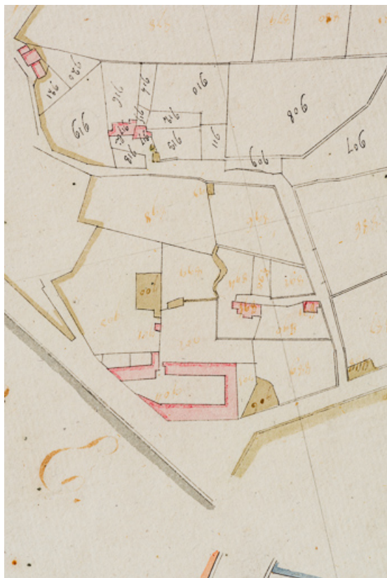
Situation de l'auberge dans le plan du cadastre ancien dit napoléonien (1812). 58, Pougues-les-Eaux, 40 avenue de Paris