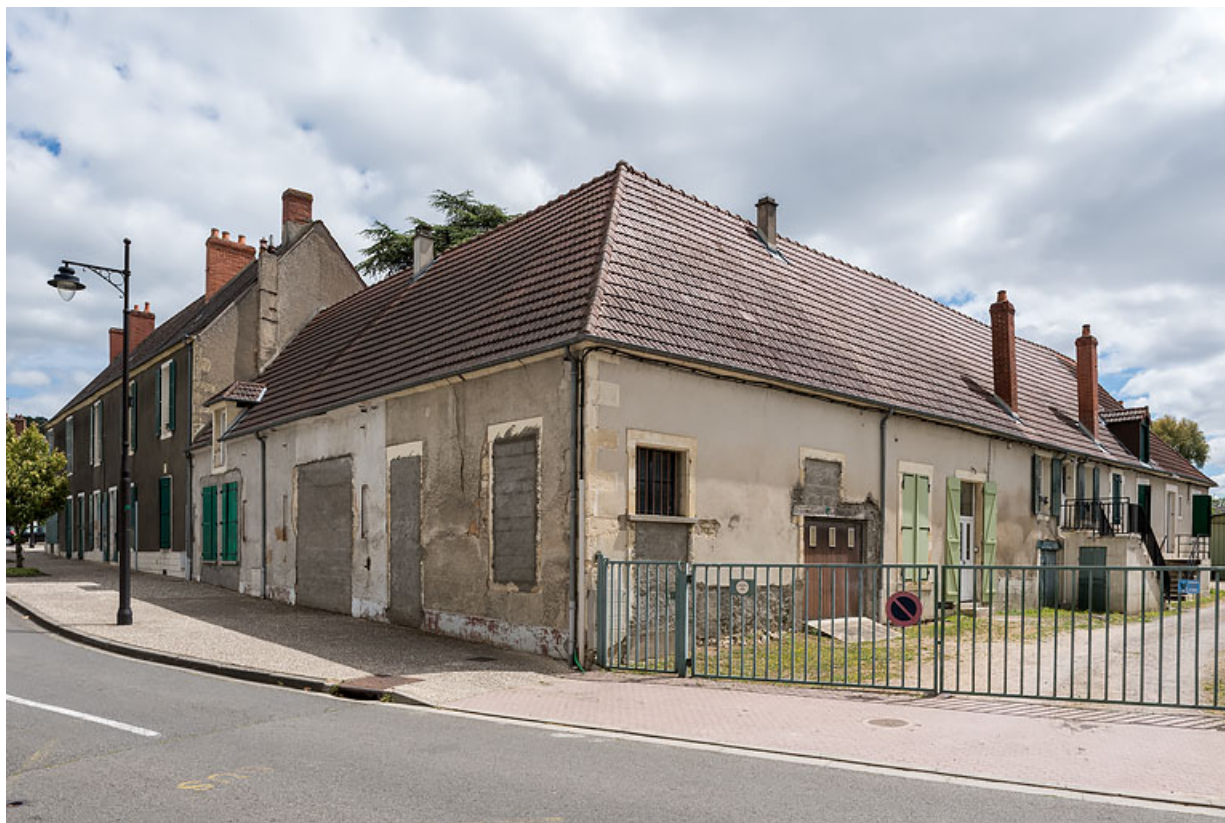
Vue depuis l'avenue de la Gare.

58, Pougues-les-Eaux, 40 avenue de Paris