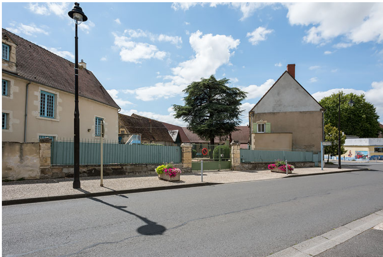
Vue depuis l'avenue de Paris.

58, Pougues-les-Eaux, 40 avenue de Paris