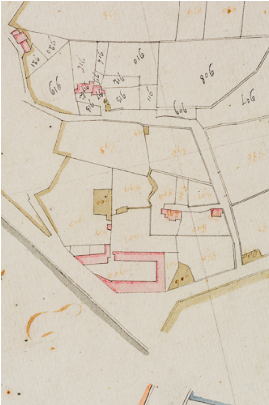
Situation de l'auberge dans le plan du cadastre ancien dit napoléonien (1812). 58, Pougues-les-Eaux, 40 avenue de Paris