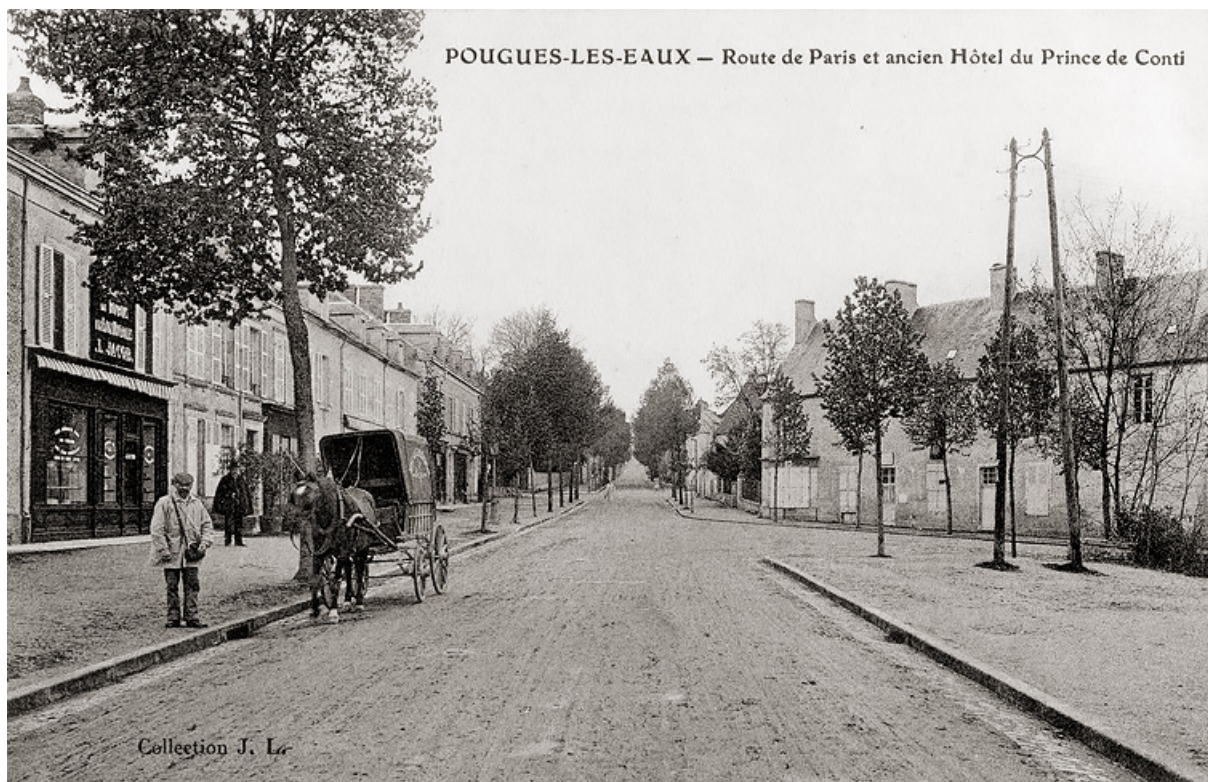
Vue de l'édifice (à droite) au croisement de l'avenue de Paris et de l'avenue de la Gare. 58, Pougues-les-Eaux, 40 avenue de Paris