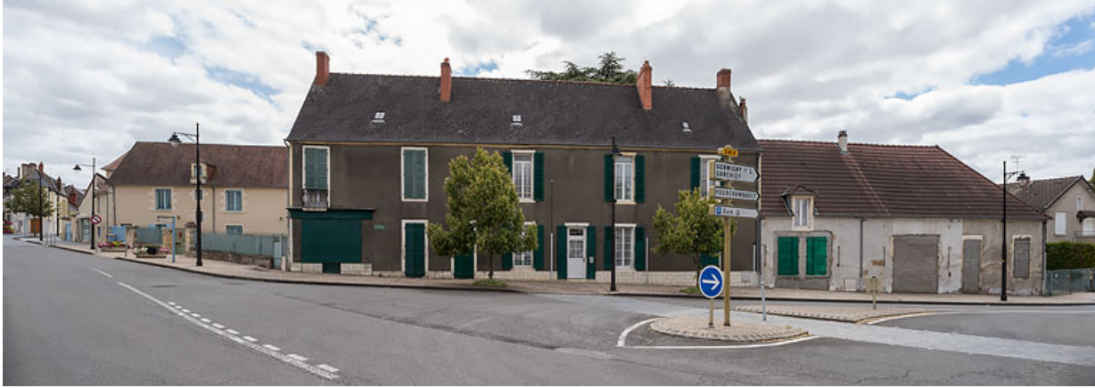
Vue d'ensemble, depuis le croisement de l'avenue de Paris et de l'avenue de la Gare. 58, Pougues-les-Eaux, 40 avenue de Paris

N° de l'illustration : 20205800481NUC4AQ