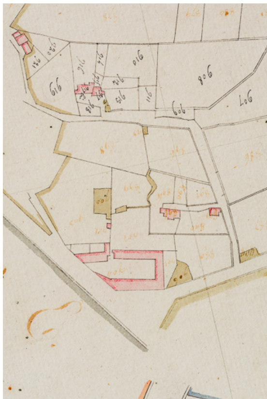
Situation de l'auberge dans le plan du cadastre ancien dit napoléonien (1812).

58, Pougues-les-Eaux, 40 avenue de Paris