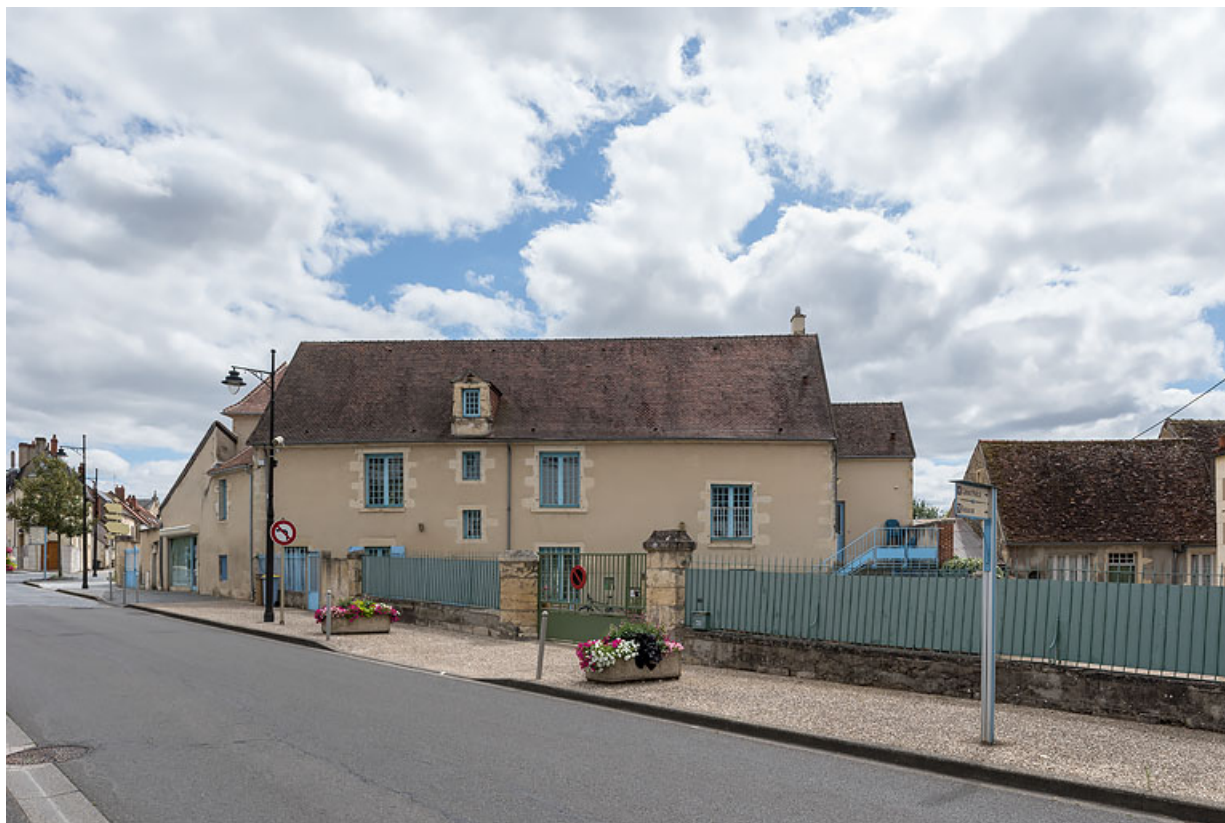
Vue depuis l'avenue de Paris.

58, Pougues-les-Eaux, 40 avenue de Paris