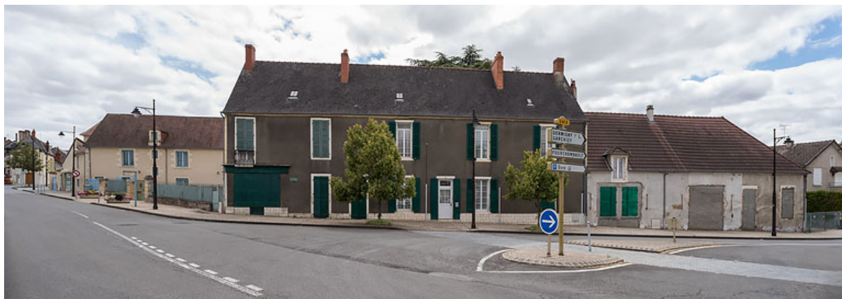
Vue d'ensemble, depuis le croisement de l'avenue de Paris et de l'avenue de la Gare. 58, Pougues-les-Eaux, 40 avenue de Paris

N° de l'illustration : 20205800481NUC4AQ