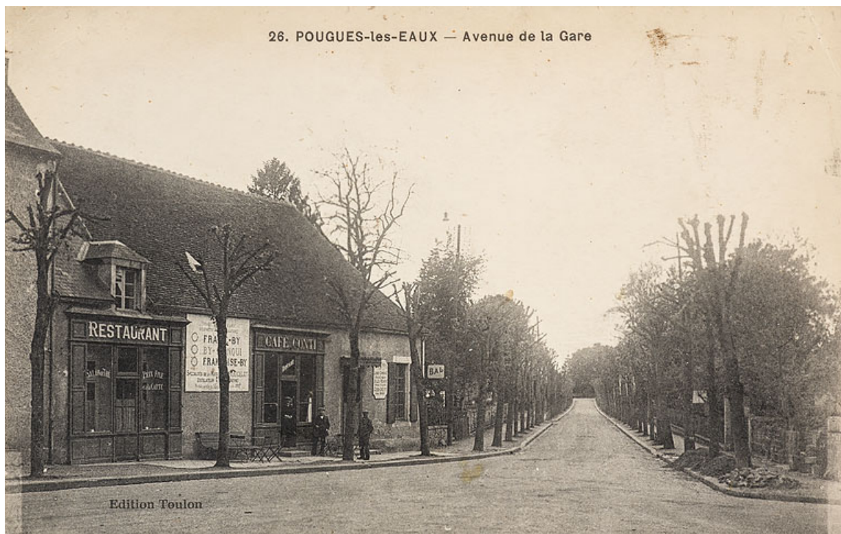
Vue de l'édifice (à gauche) au croisement de l'avenue de la Gare et de l'avenue de Paris. 58, Pougues-les-Eaux