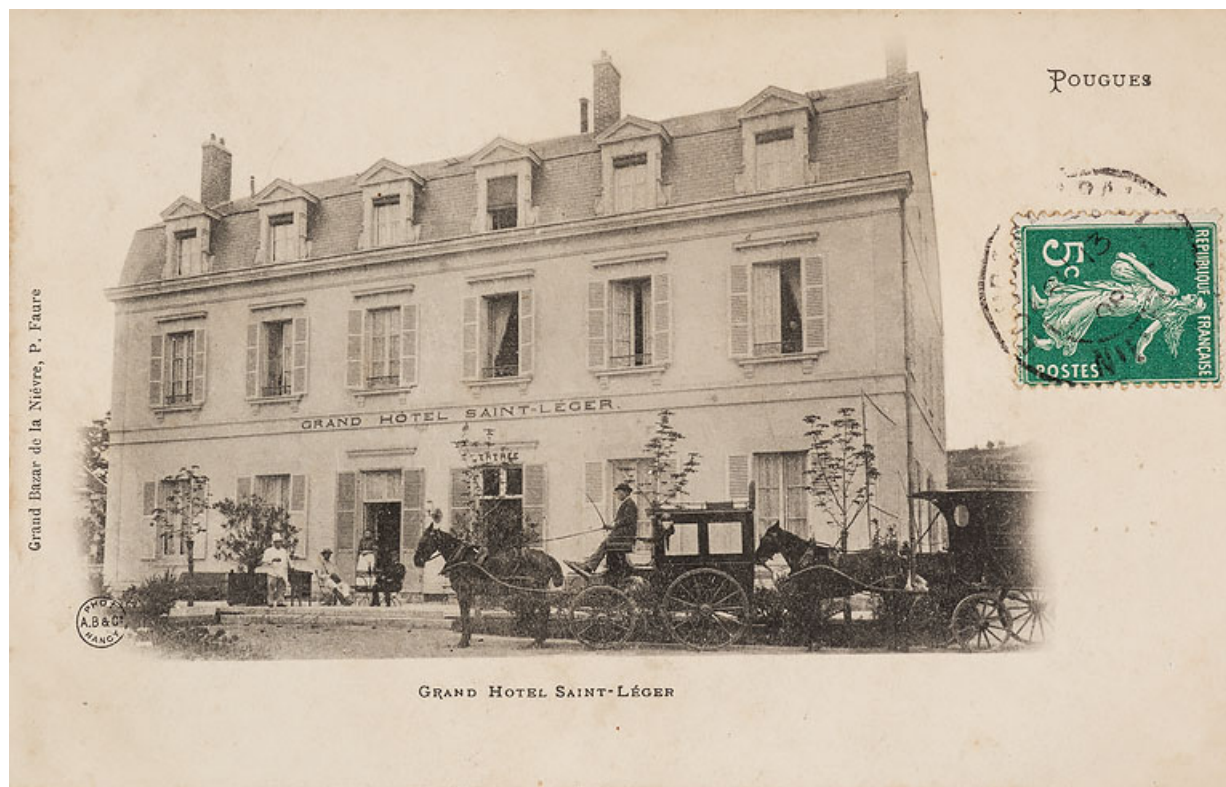
Façade avant l'ajout d'un second étage carré.

58, Pougues-les-Eaux, 5 rue de la Mignarderie