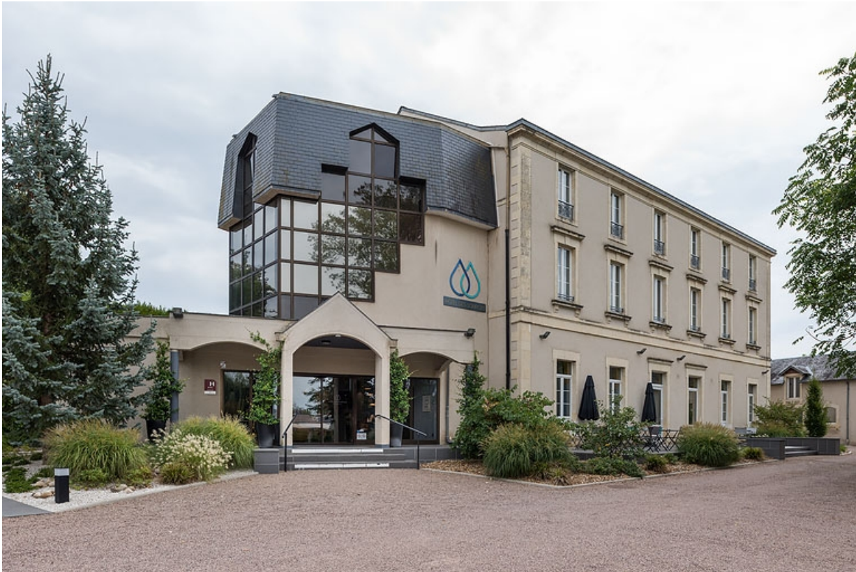
Façade après les travaux de modernisation de 2017.

58, Pougues-les-Eaux, 5 rue de la Mignarderie