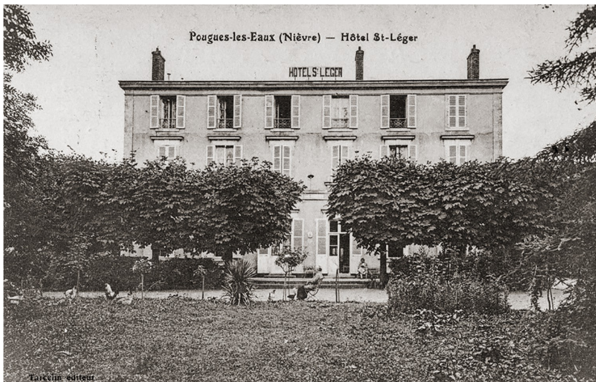
Façade après l'ajout d'un second étage carré.

58, Pougues-les-Eaux, 5 rue de la Mignarderie