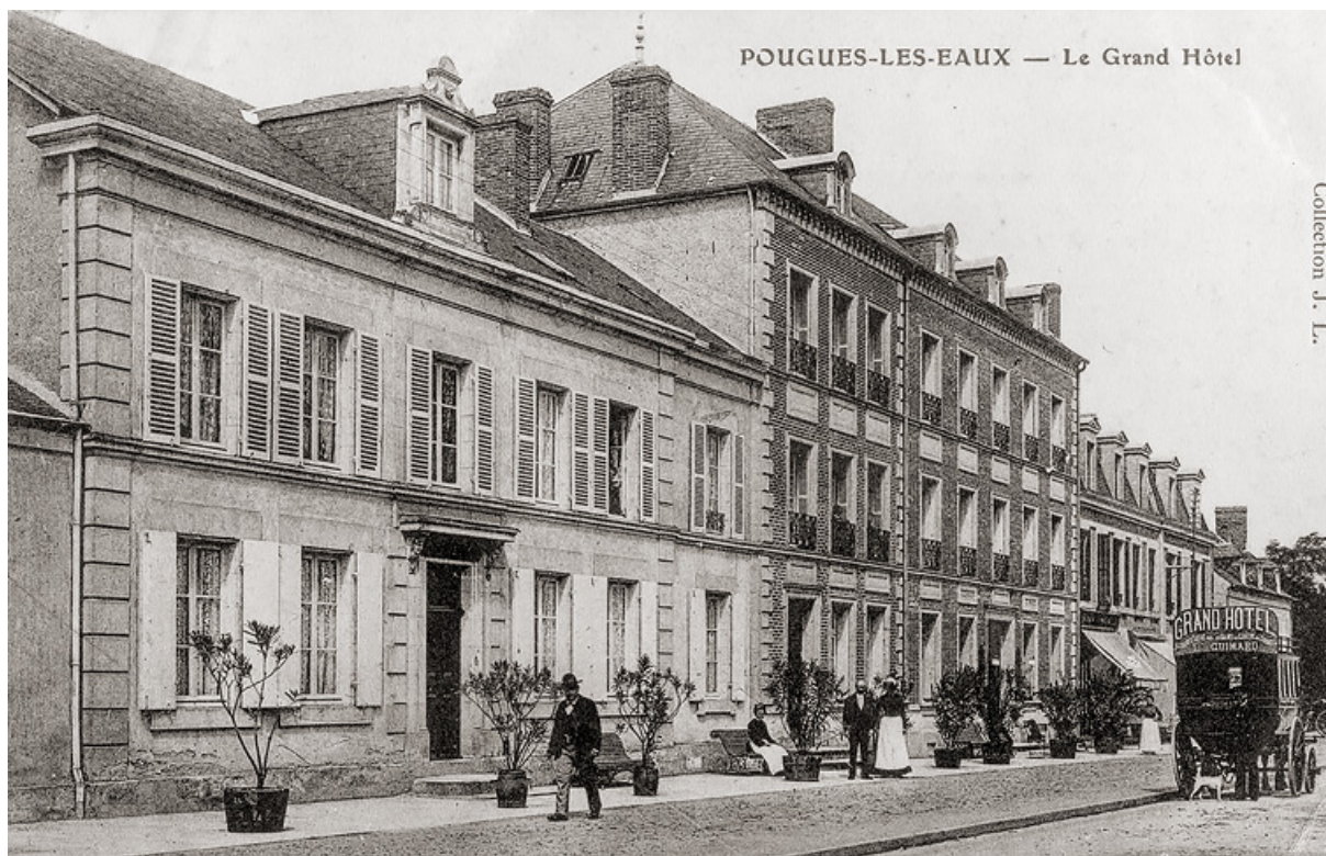
Vue ancienne d'ensemble, en direction de Paris.

58, Pougues-les-Eaux, 34 avenue de Paris