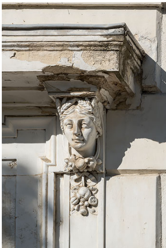
Façade de la maison de Marien dit Georges Bigouret, porte d'entrée, tête allégorique de l'été. 58, Pougues-les-Eaux, 34 avenue de Paris