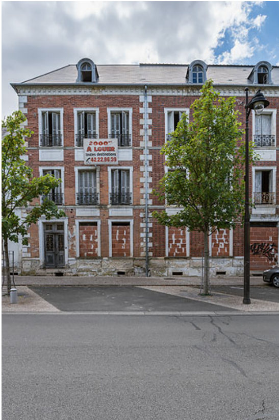
Façade de l'extension de Jules Guimard.

58, Pougues-les-Eaux, 34 avenue de Paris