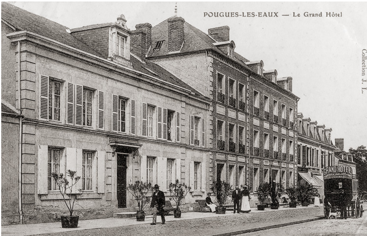
Vue ancienne d'ensemble, en direction de Paris.

58, Pougues-les-Eaux, 34 avenue de Paris