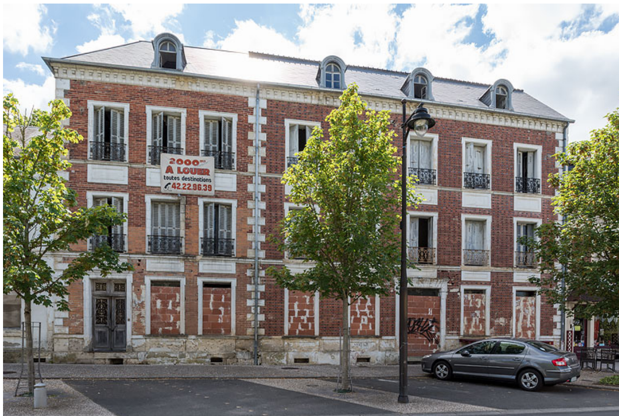
Façade de l'extension de Jules Guimard.

58, Pougues-les-Eaux, 34 avenue de Paris