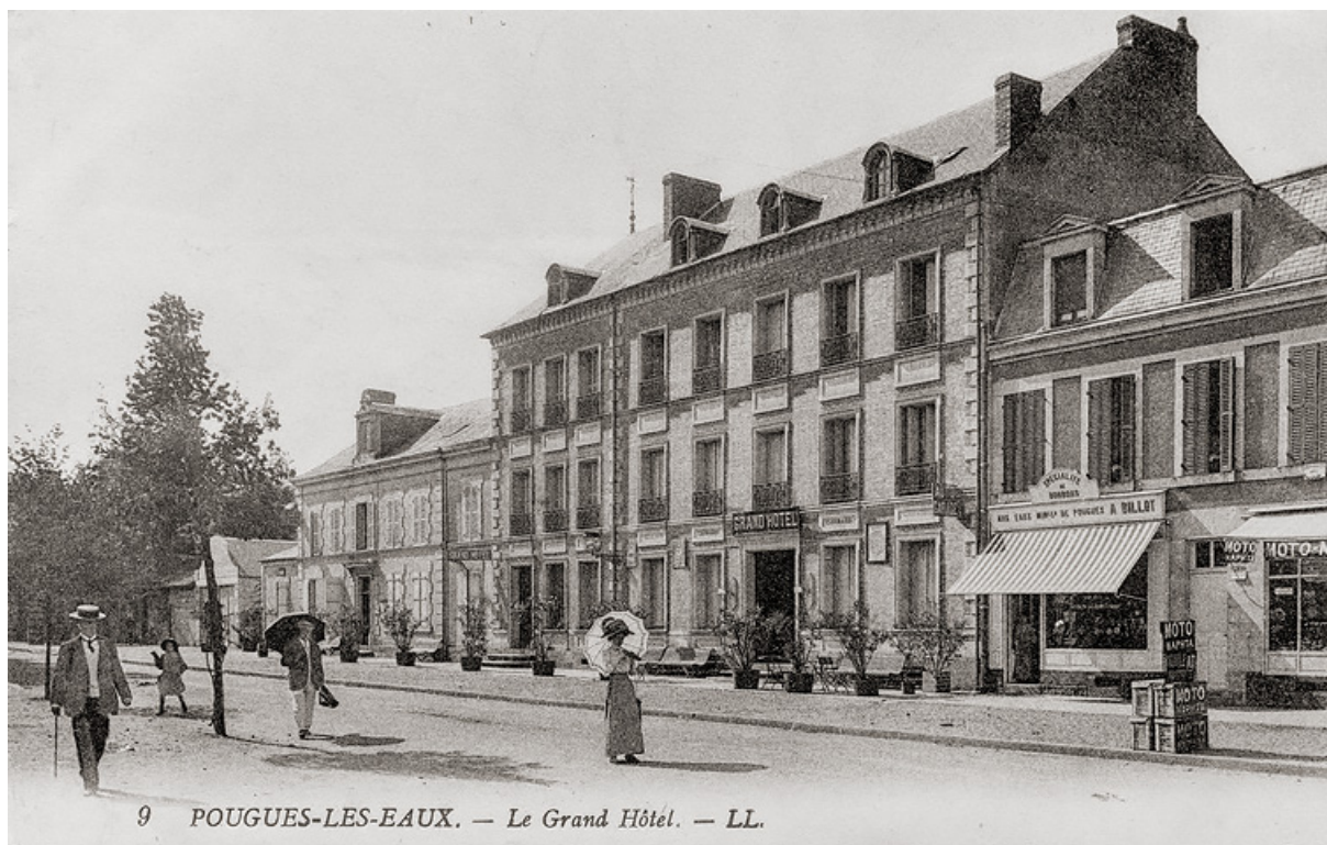
Vue ancienne d'ensemble, en direction de Nevers.

58, Pougues-les-Eaux, 34 avenue de Paris