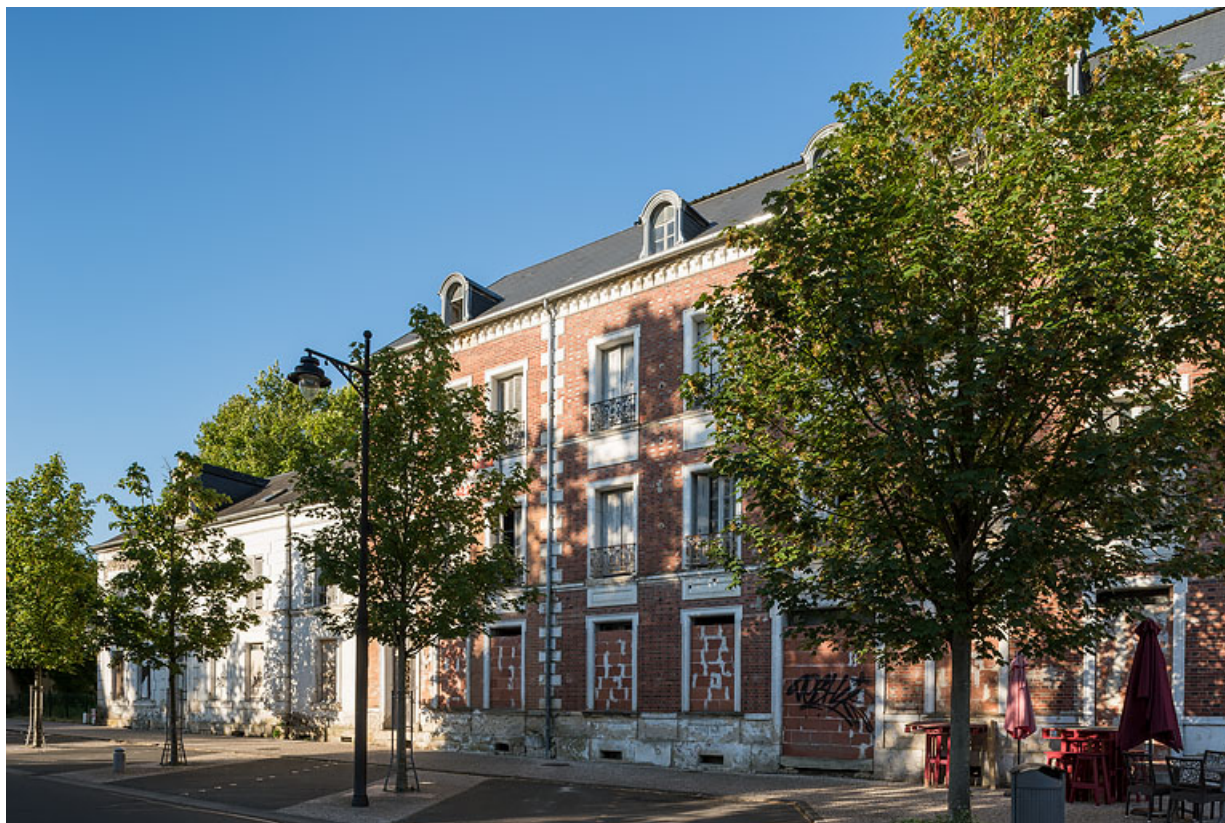
Vue actuelle d'ensemble, en direction de Nevers.

58, Pougues-les-Eaux, 34 avenue de Paris