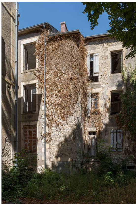
Façade sur la cour.

58, Pougues-les-Eaux, 34 avenue de Paris