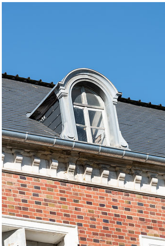
Façade de l'extension de Jules Guimard, lucarne.

58, Pougues-les-Eaux, 34 avenue de Paris