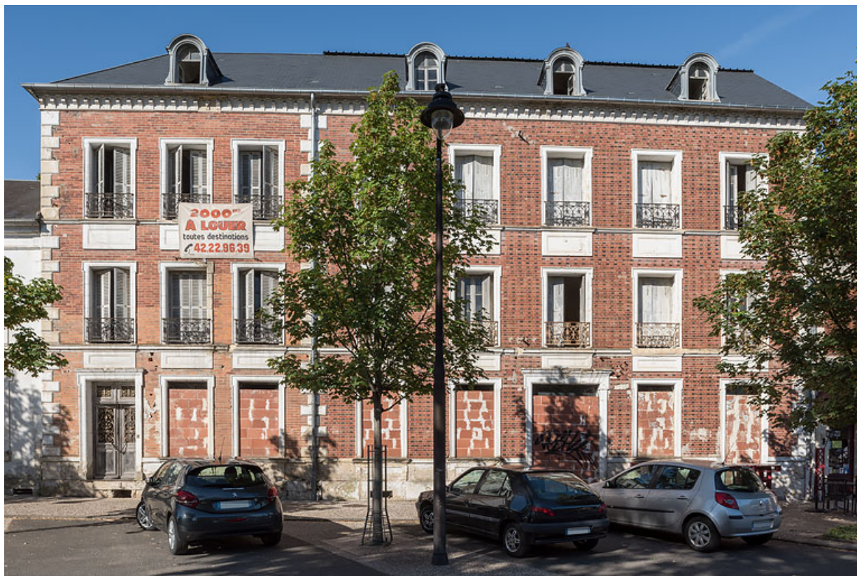
Façade de l'extension de Jules Guimard.

58, Pougues-les-Eaux, 34 avenue de Paris