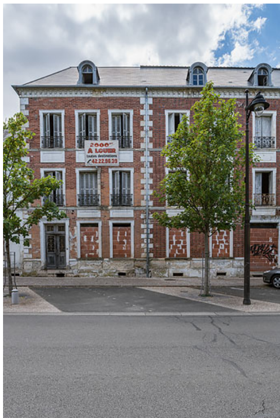
Façade de l'extension de Jules Guimard.

58, Pougues-les-Eaux, 34 avenue de Paris