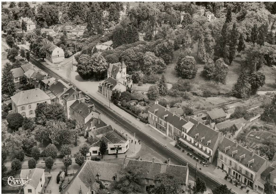
Vue aérienne du carrefour de l'avenue de Paris et de l'avenue de la Gare.

58, Pougues-les-Eaux, 27 avenue de Paris