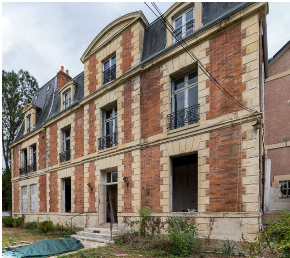
Façade sur l'avenue de Paris, vue de trois-quarts depuis le nord.

58, Pougues-les-Eaux, 6A avenue de Paris