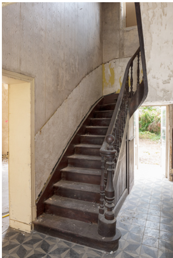
Escalier du corps principal, rez-de-chaussée.

58, Pougues-les-Eaux, 6A avenue de Paris