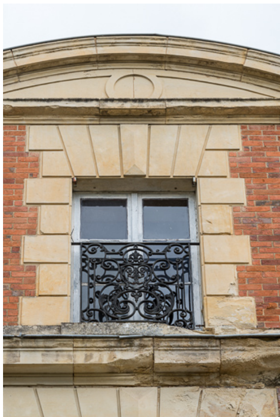
Façade sur l'avenue de Paris, détail, baie de la lucarne-pignon.

58, Pougues-les-Eaux, 6A avenue de Paris