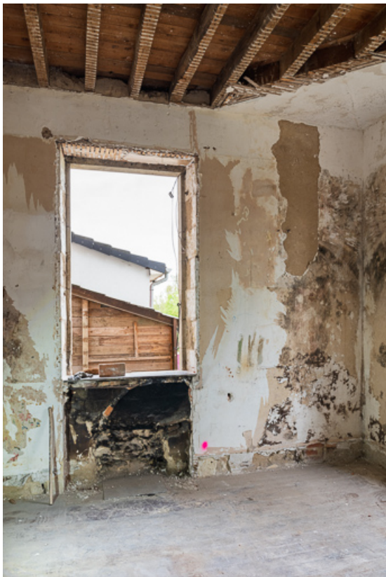
Salon au rez-de-chaussée avec vestige d'une cheminée sous baie.

58, Pougues-les-Eaux, 6A avenue de Paris