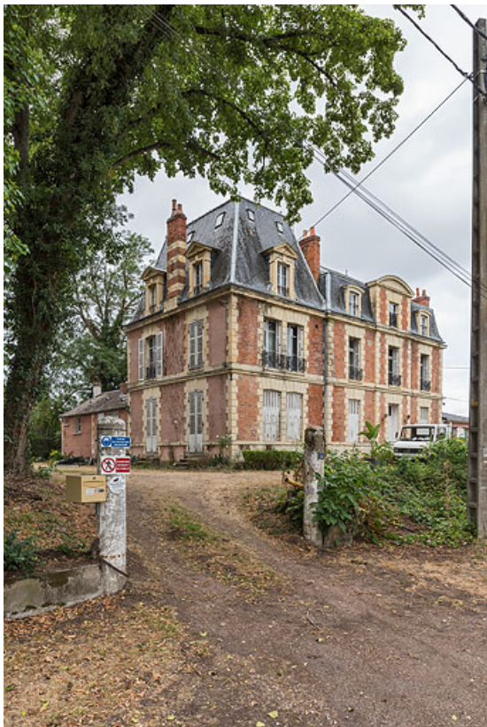
Vue d'ensemble depuis l'accès sur l'avenue de Paris.

58, Pougues-les-Eaux, 6A avenue de Paris