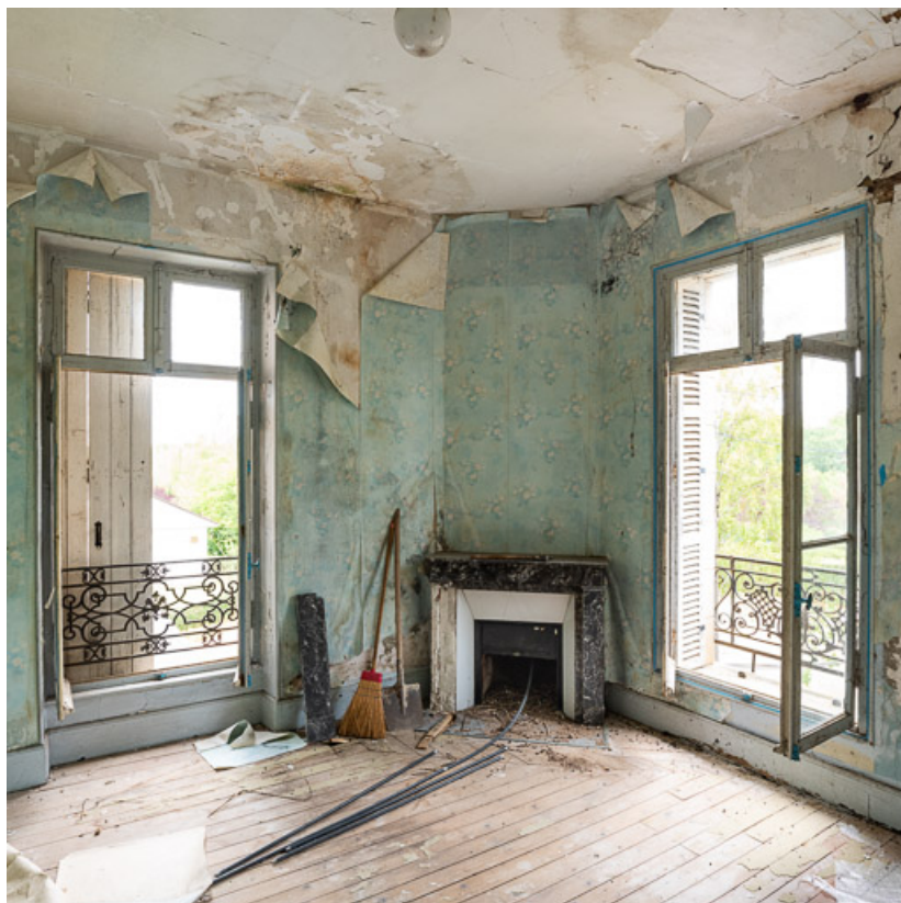
Chambre au premier étage avec deux fenêtres et une cheminée dans l'angle. 58, Pougues-les-Eaux, 6A avenue de Paris

N° de l'illustration : 20205800437NUC4AQ