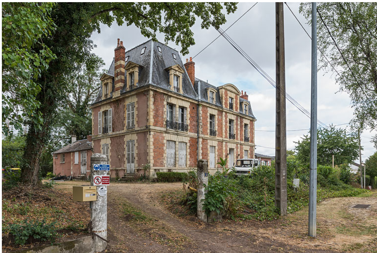
Vue d'ensemble depuis l'accès sur l'avenue de Paris.

58, Pougues-les-Eaux, 6A avenue de Paris