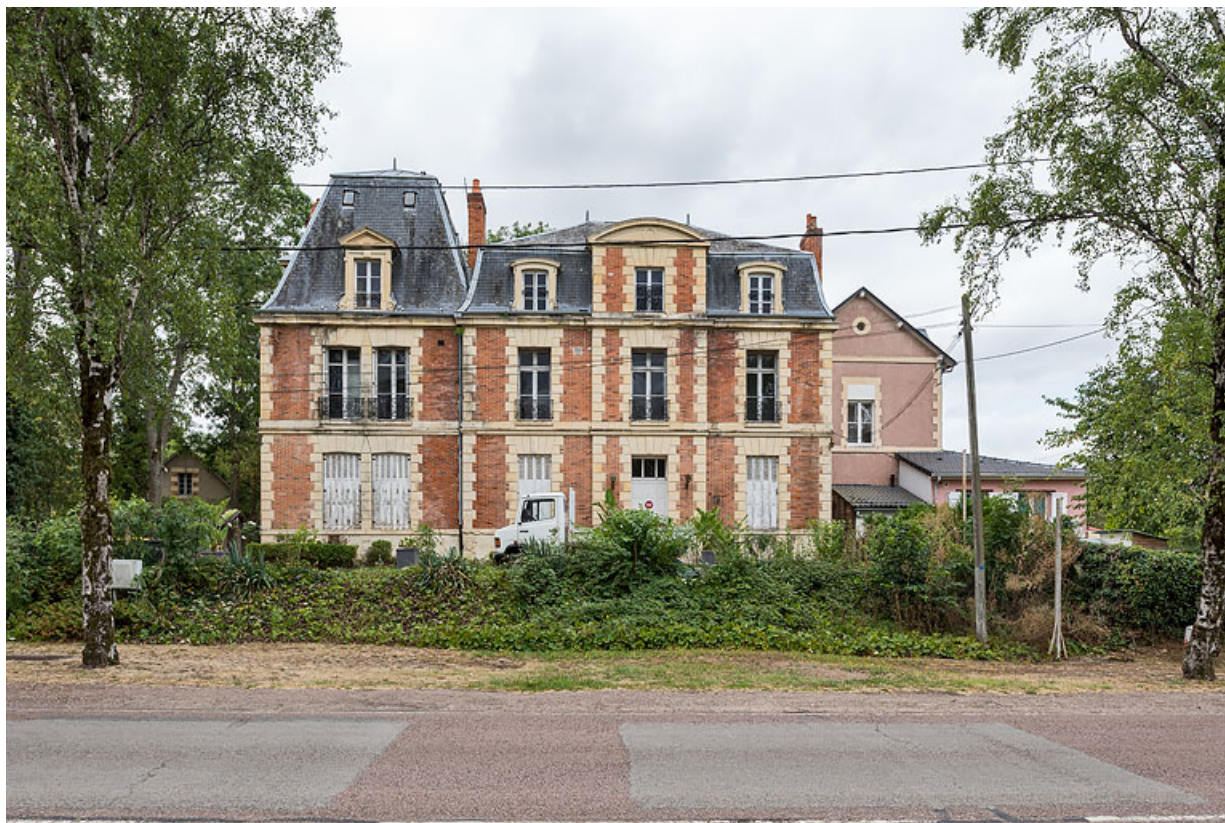
Façade sur l'avenue de Paris, vue de face.

58, Pougues-les-Eaux, 6A avenue de Paris