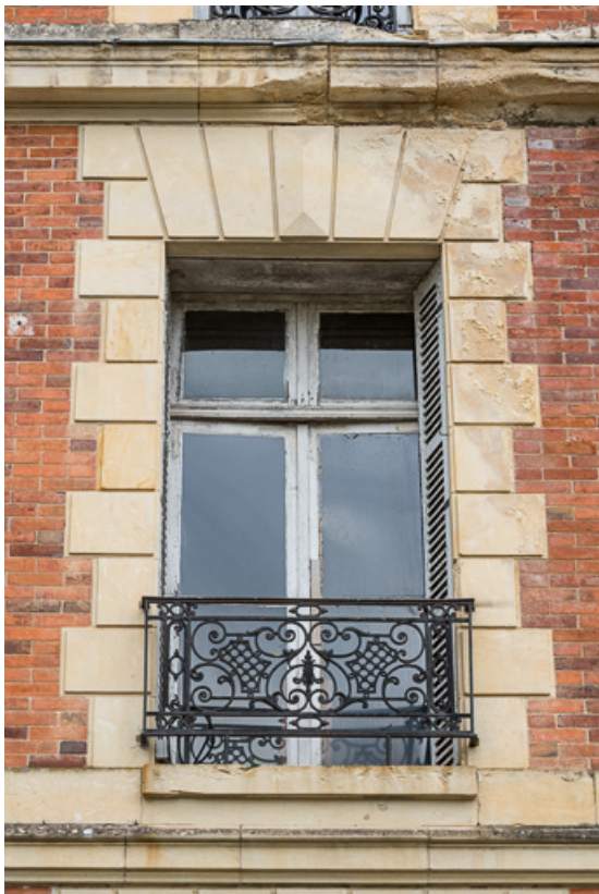
Façade sur l'avenue de Paris, détail, baie du premier étage.

58, Pougues-les-Eaux, 6A avenue de Paris