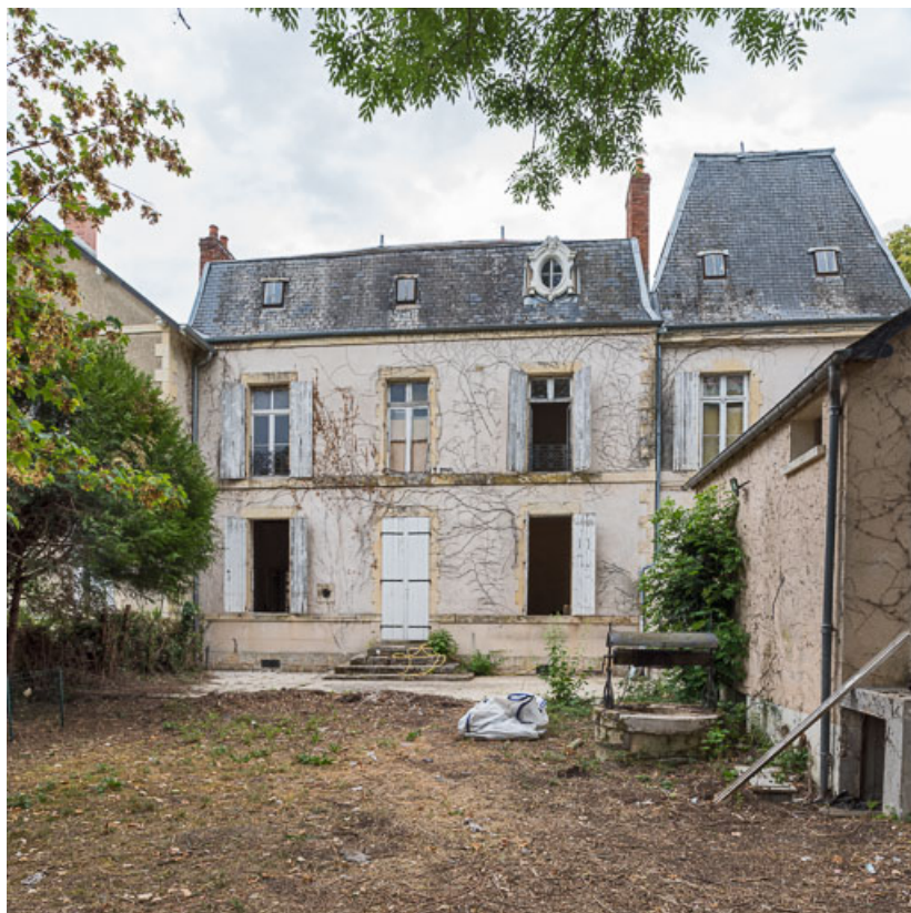
Façade sur le jardin, vue de face.

58, Pougues-les-Eaux, 6A avenue de Paris