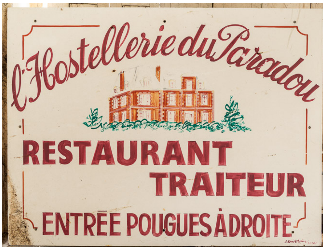
Enseigne de l'Hostellerie du Paradou, restaurant-traiteur, signée par Christian Souverain (de Nevers). 58, Pougues-les-Eaux, 6A avenue de Paris