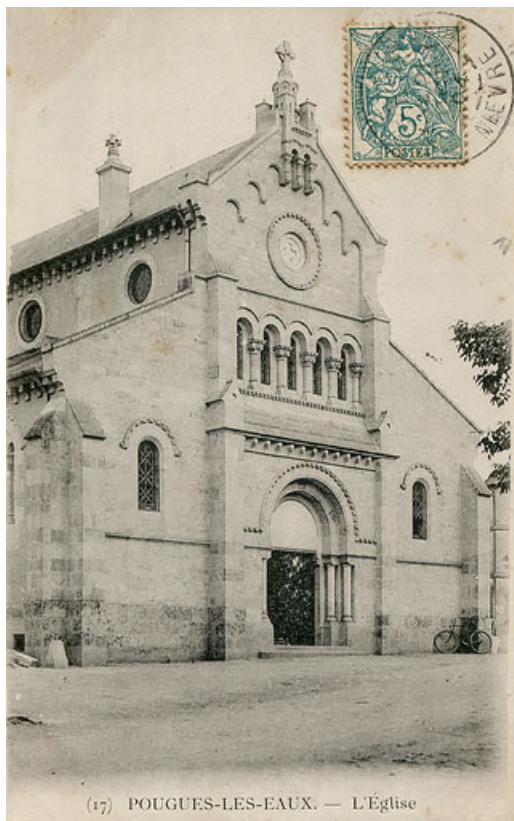
Façade de l'église au début du 20e siècle.