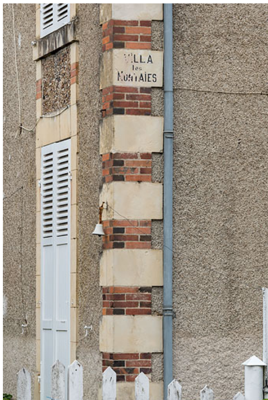
Chaîne d'angle portant le nom ("Villa Les Nontaies"). 58, Pougues-les-Eaux, 14 avenue de Paris