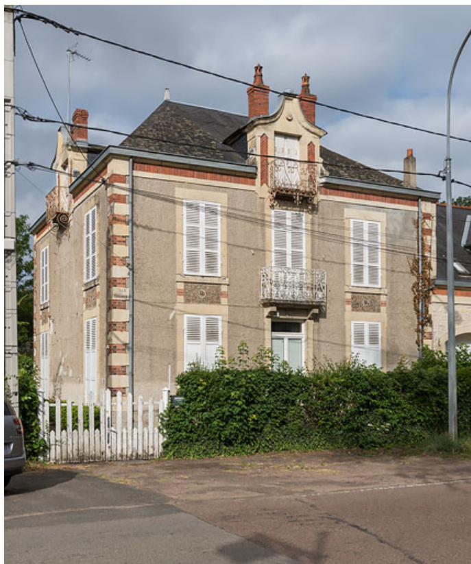
Façade de la demeure 16 avenue de Paris.

58, Pougues-les-Eaux, 14 avenue de Paris