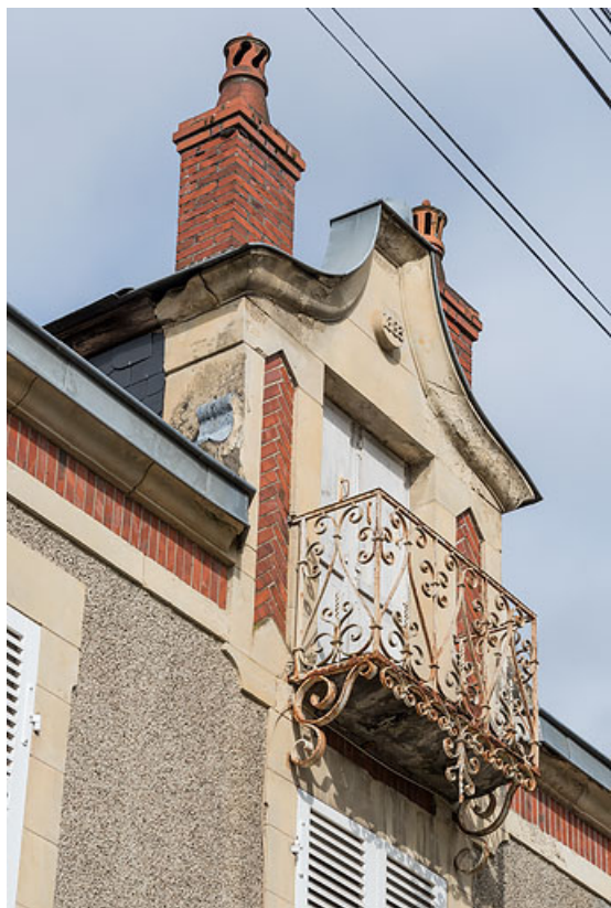
Lucarne portant la date ("1883").

58, Pougues-les-Eaux, 14 avenue de Paris