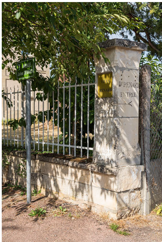
Pilier de clôture avec l'inscription "Dr RENARD" à l'angle de l'avenue Jules Renard et de la rue de la Mignarderie. 58, Pougues-les-Eaux, 1 rue des Capucins