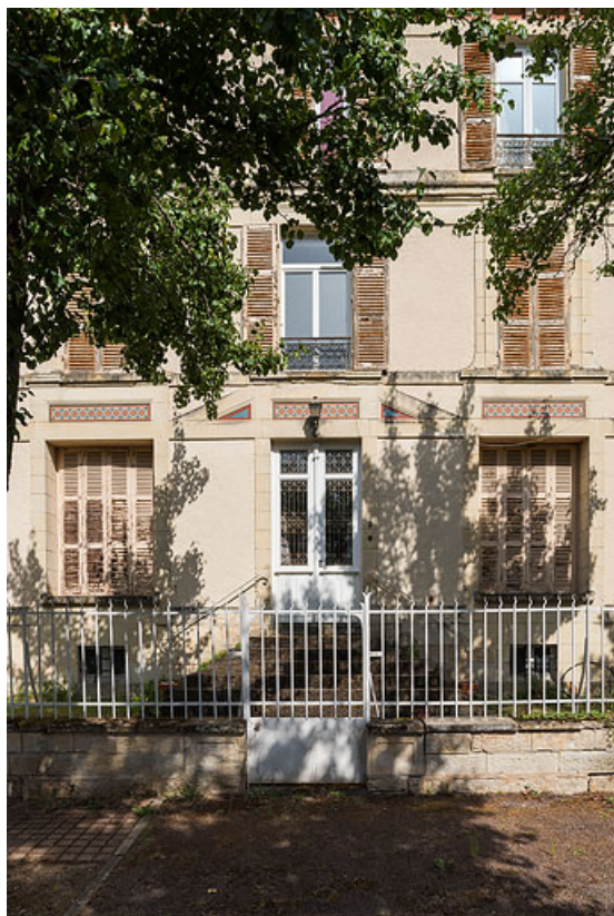
Façade ouest, détail avec la porte d'entrée.

58, Pougues-les-Eaux, 1 rue des Capucins