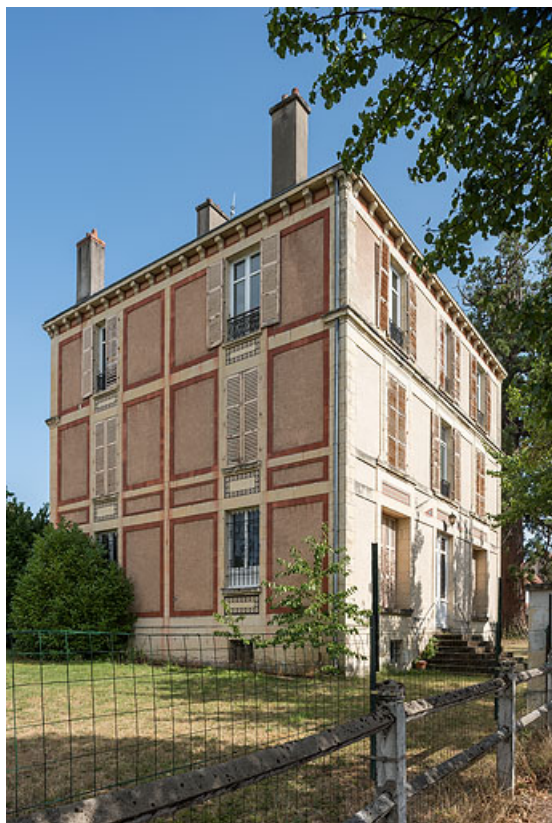
Façade nord (à gauche) et façade ouest (à droite). 58, Pougues-les-Eaux, 1 rue des Capucins