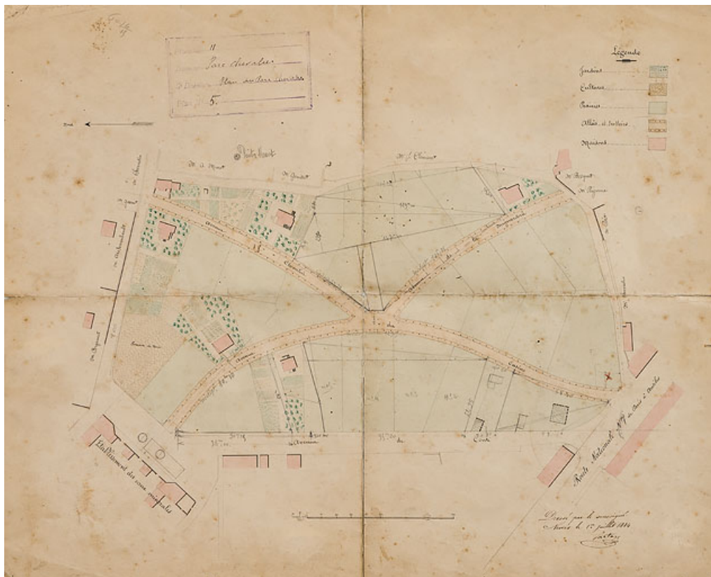
Plan de situation de la demeure dans le Parc Chevalier (1884). 58, Pougues-les-Eaux