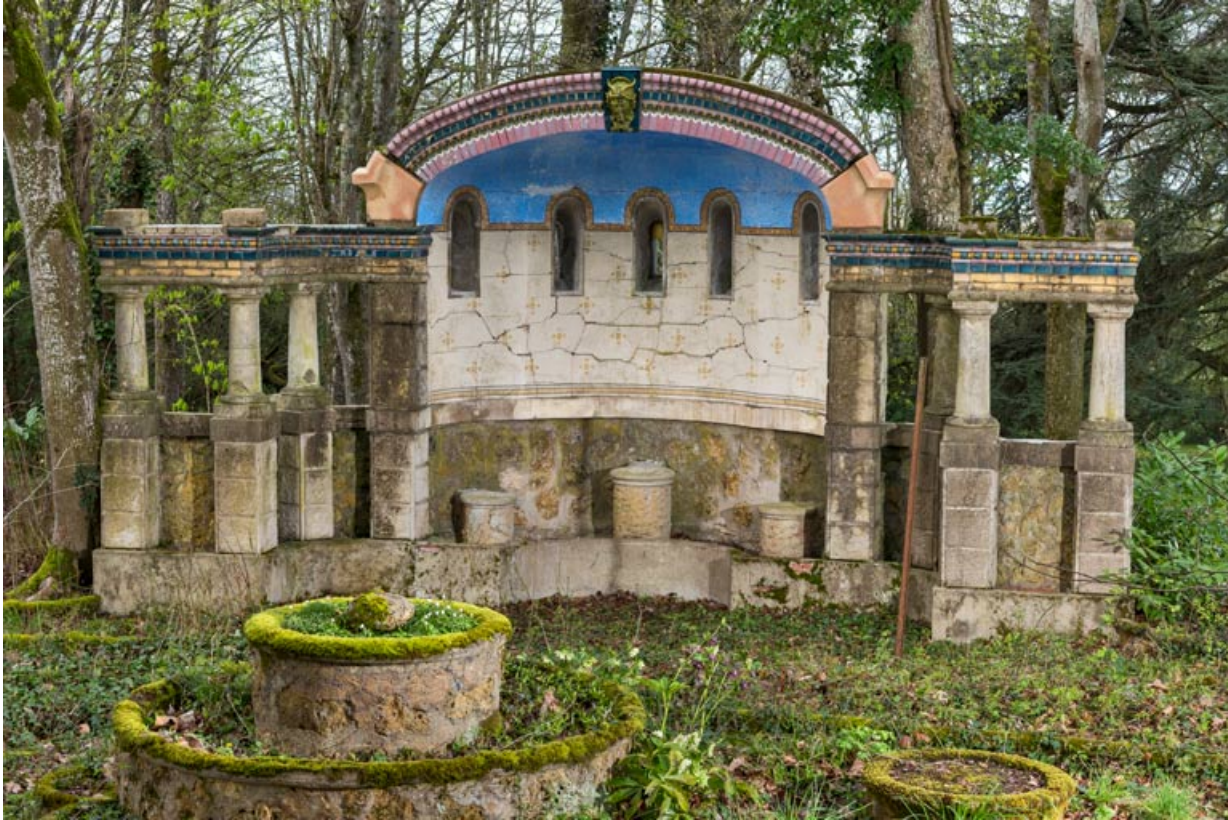
Face principale (vue de face).

58, Pougues-les-Eaux, 130 avenue de Paris, lieudit : La Montjaie