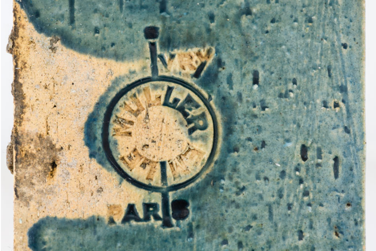
Décor de céramique de l'entablement, détail : marque d'Émile Müller à Ivry-Paris.

58, Pougues-les-Eaux, 130 avenue de Paris, lieudit : La Montjaie