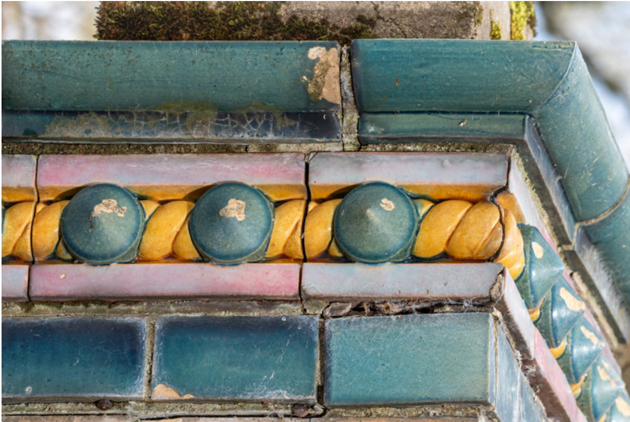
Décor de céramique de l'entablement, détail : frise (corde et cabochons).

58, Pougues-les-Eaux, 130 avenue de Paris, lieudit : La Montjaie