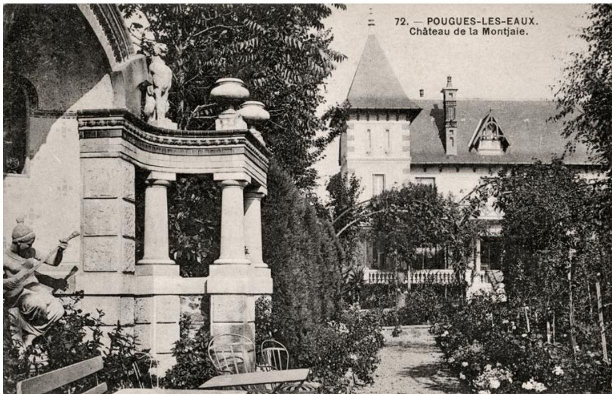
Situation générale (état avant la disparition des statues).

58, Pougues-les-Eaux, 130 avenue de Paris, lieudit : La Montjaie