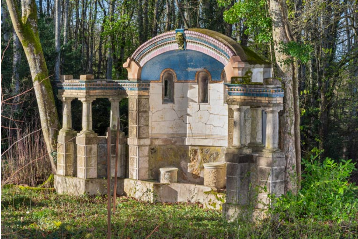
Face principale (vue de trois quarts).

58, Pougues-les-Eaux, 130 avenue de Paris, lieudit : La Montjaie