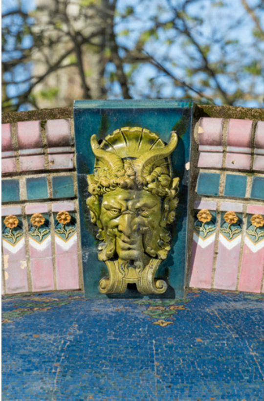
Décor de céramique de l'arc, détail : tête de faune et fleurettes.

58, Pougues-les-Eaux, 130 avenue de Paris, lieudit : La Montjaie