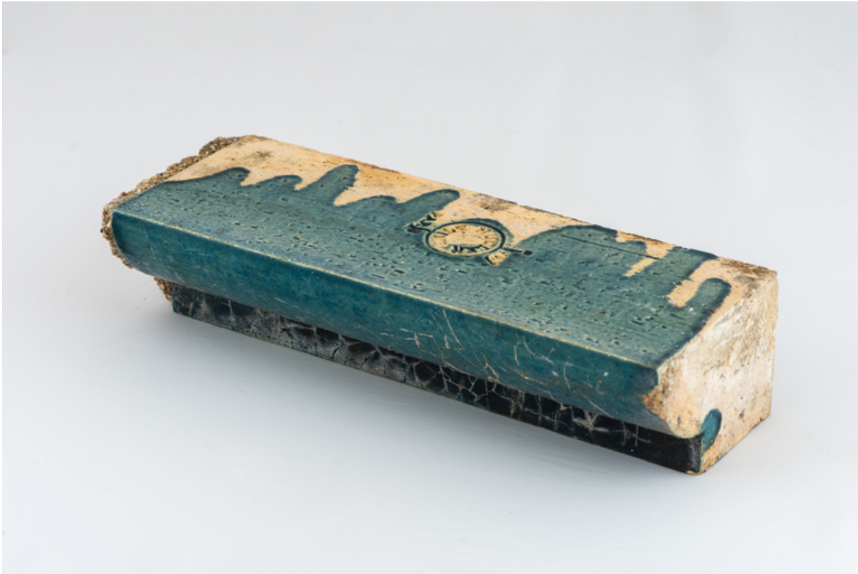
Décor de céramique de l'entablement, détail : moulure.

58, Pougues-les-Eaux, 130 avenue de Paris, lieudit : La Montjaie