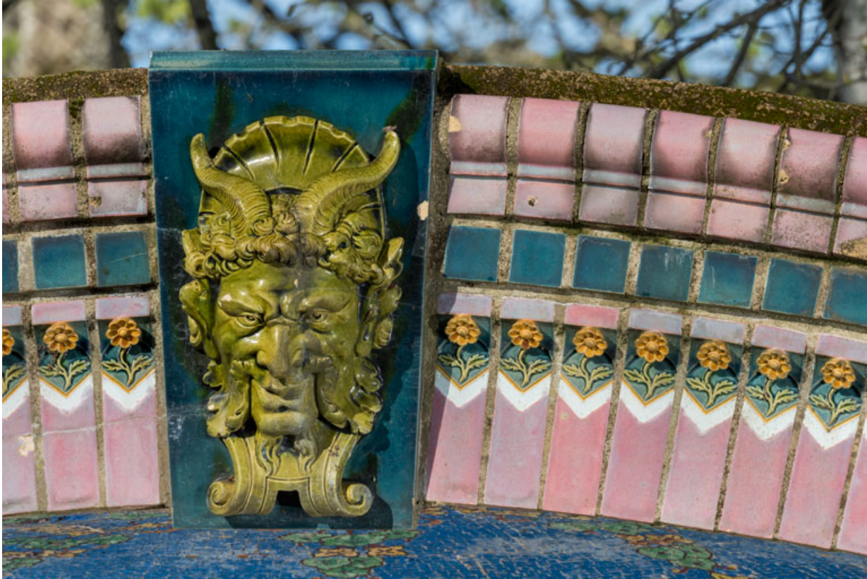
Décor de céramique de l'arc, détail : tête de faune et fleurettes.

58, Pougues-les-Eaux, 130 avenue de Paris, lieudit : La Montjaie