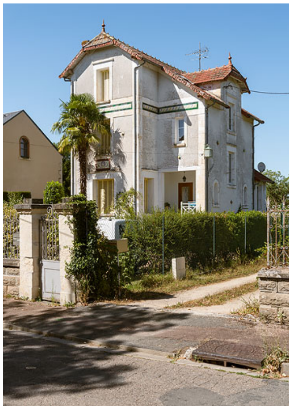
Façade sur rue au début du 21e siècle.

58, Pougues-les-Eaux, 6 rue de Bourgneuf