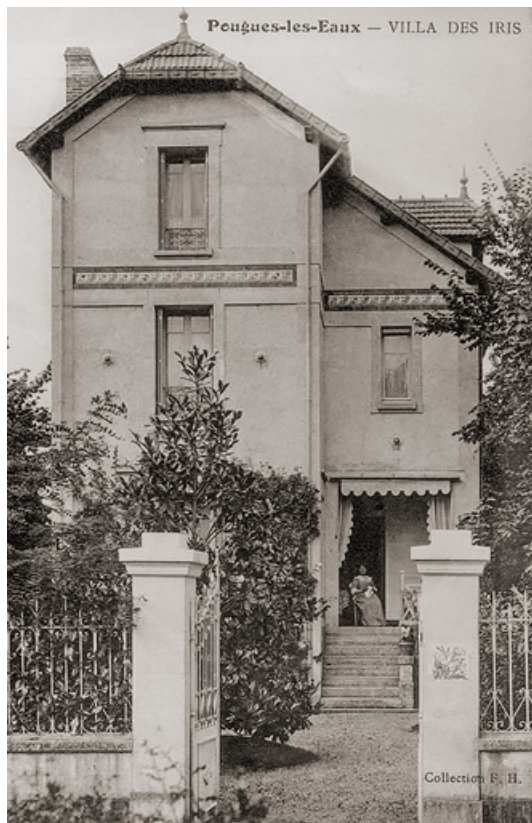
Façade sur rue au début du 20e siècle. 58, Pougues-les-Eaux, 6 rue de Bourgneuf