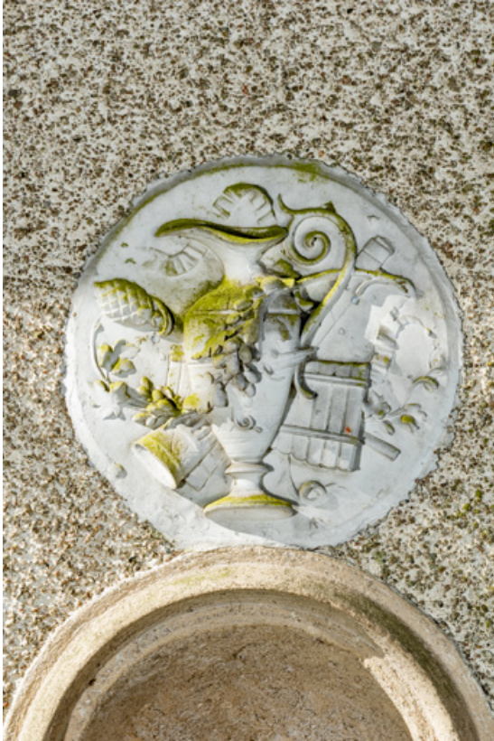
Façade nord-est, médaillon sculpté : instruments de musique et aiguière.

58, Pougues-les-Eaux, 130 avenue de Paris, lieudit : La Montjaie