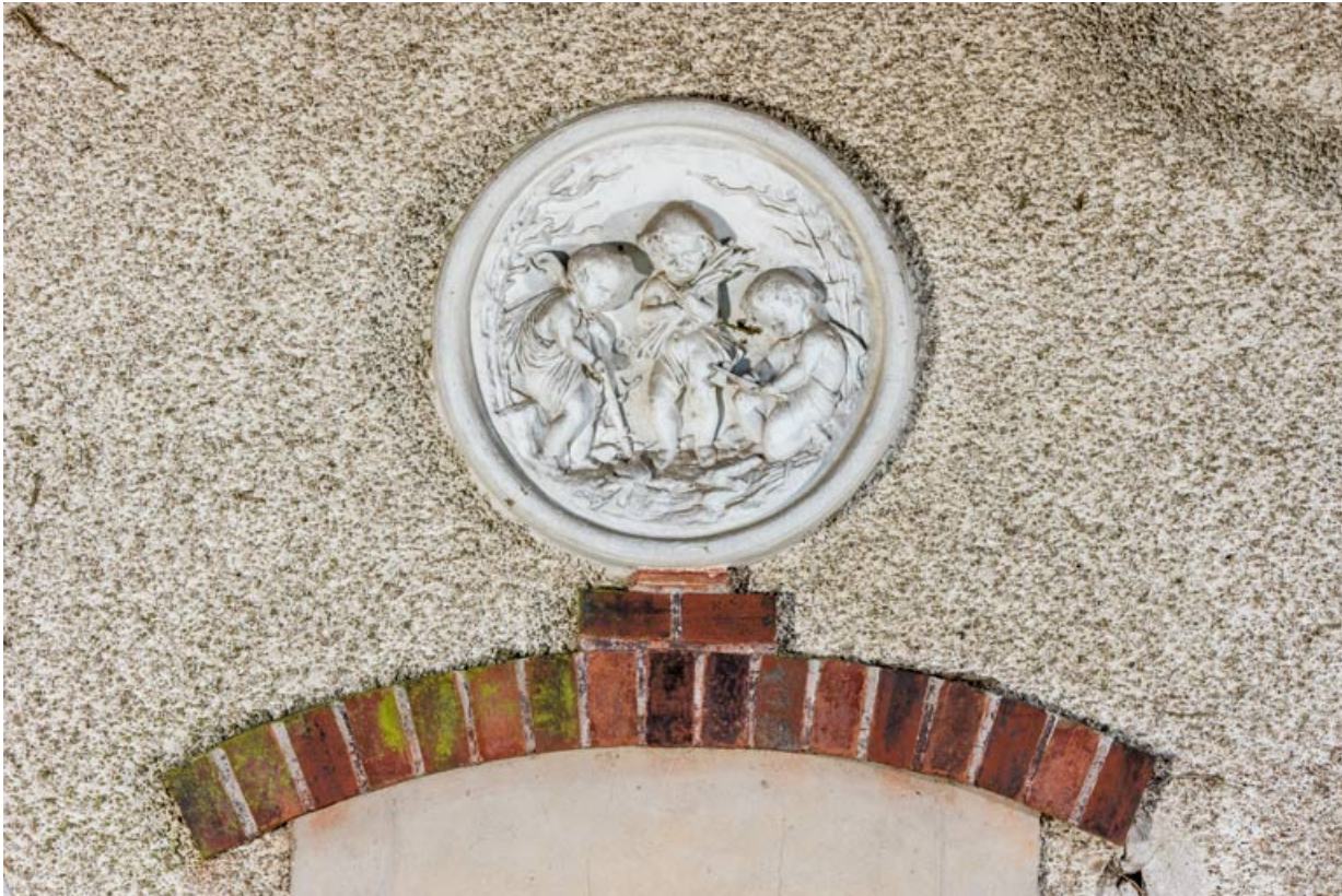
Façade nord-est, médaillon sculpté : l'Hiver (?)

58, Pougues-les-Eaux, 130 avenue de Paris, lieudit : La Montjaie