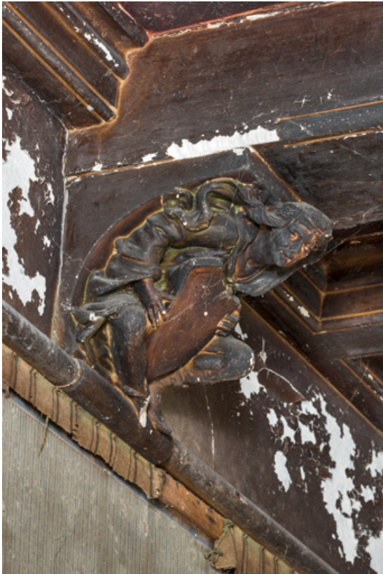
Pièce principale, corbeau : personnage portant un écu.

58, Pougues-les-Eaux, 130 avenue de Paris, lieudit : La Montjaie