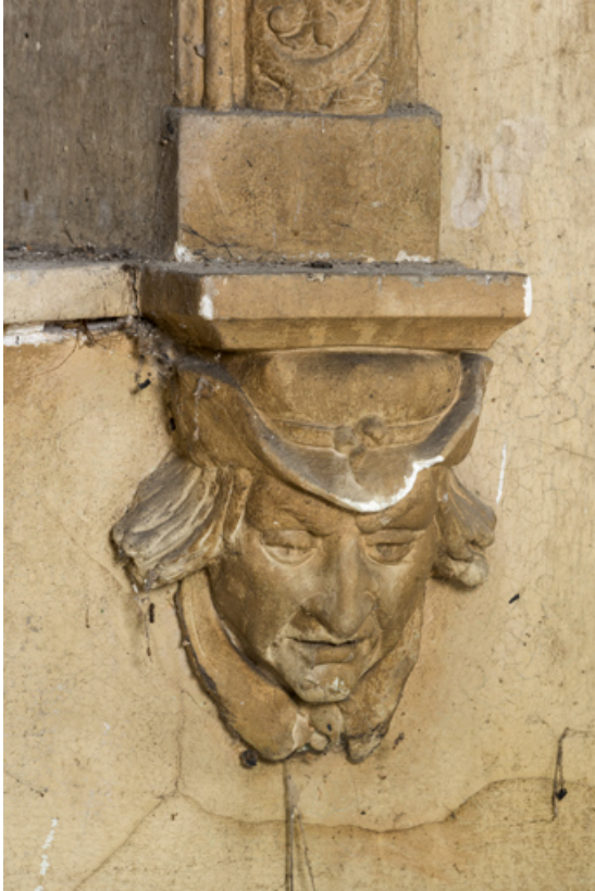
Pièce principale, culot : tête d'homme coiffé d'un chapeau.

58, Pougues-les-Eaux, 130 avenue de Paris, lieudit : La Montjaie