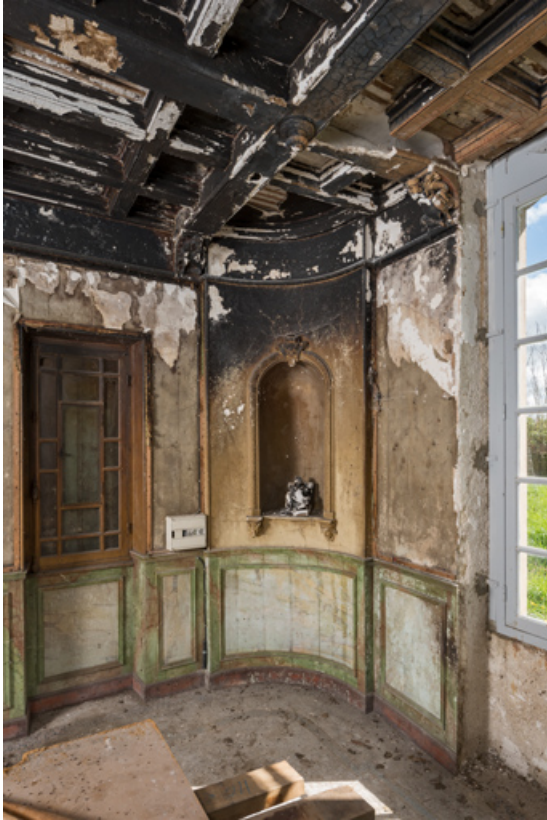
Pièce principale, niche dans l'angle.

58, Pougues-les-Eaux, 130 avenue de Paris, lieudit : La Montjaie