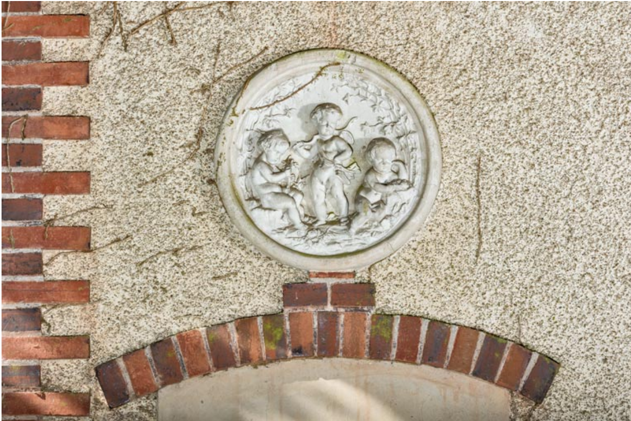
Façade nord-est, médaillon sculpté : l'Eté (?)

58, Pougues-les-Eaux, 130 avenue de Paris, lieudit : La Montjaie