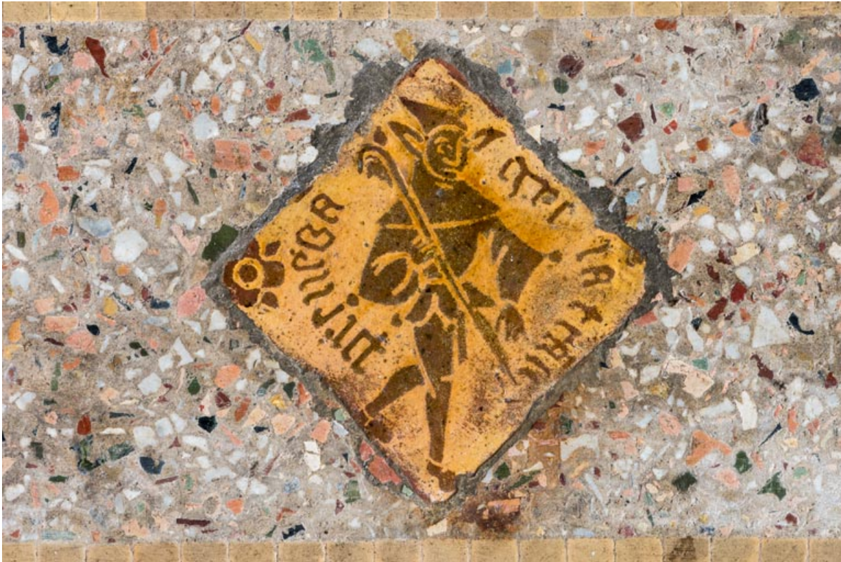
Pièce principale, carreau de céramique devant le seuil de la cheminée : fou.

58, Pougues-les-Eaux, 130 avenue de Paris, lieudit : La Montjaie