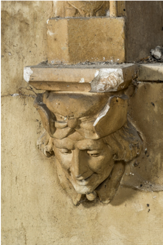
Pièce principale, culot : tête d'homme coiffé d'un chapeau.

58, Pougues-les-Eaux, 130 avenue de Paris, lieudit : La Montjaie