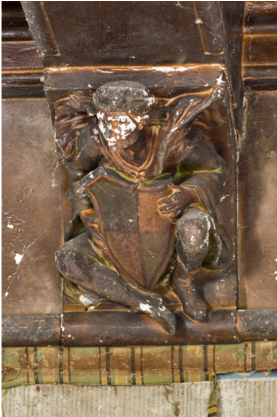
Pièce principale, corbeau : personnage portant un écu.

58, Pougues-les-Eaux, 130 avenue de Paris, lieudit : La Montjaie