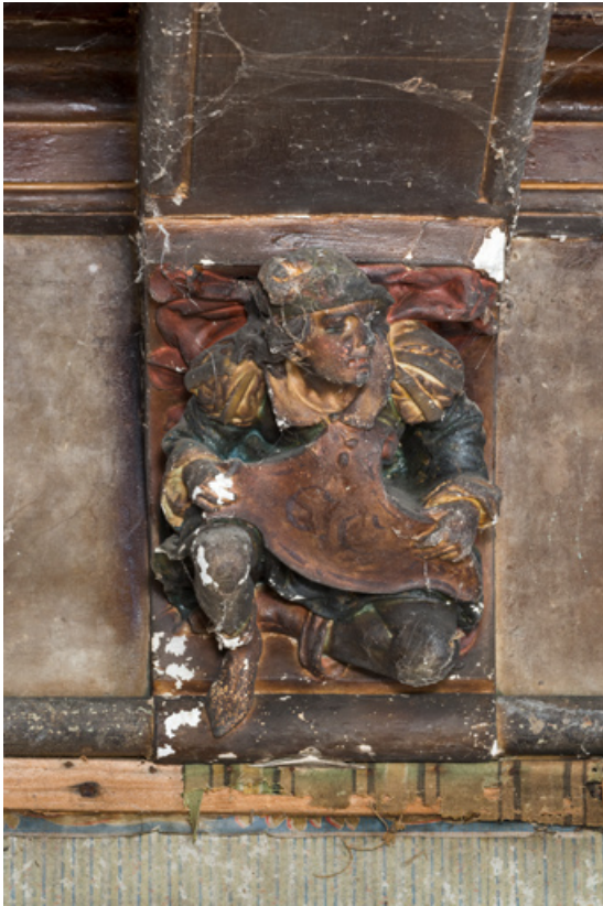
Pièce principale, corbeau : personnage portant un écu.

58, Pougues-les-Eaux, 130 avenue de Paris, lieudit : La Montjaie