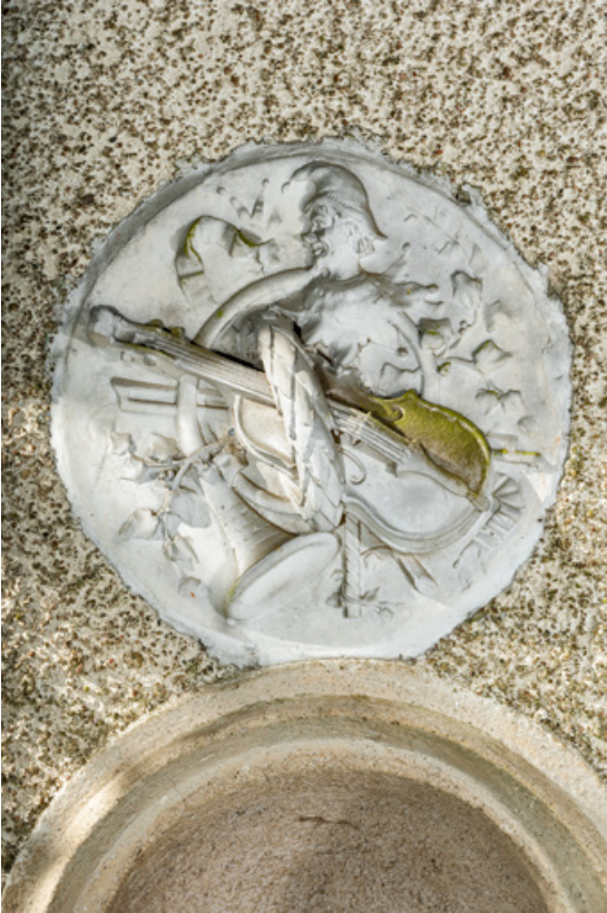
Façade nord-est, médaillon sculpté : instruments de musique et couronne végétale.

58, Pougues-les-Eaux, 130 avenue de Paris, lieudit : La Montjaie