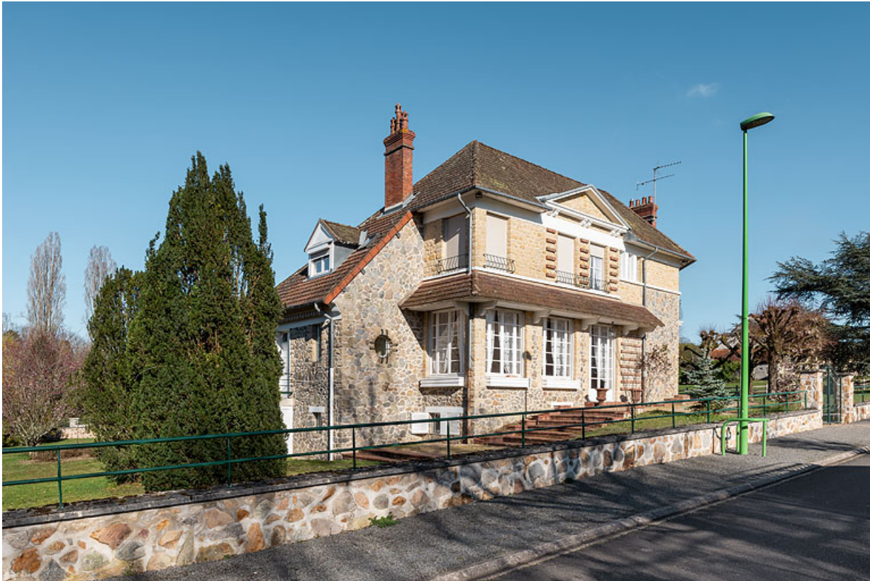
Façade sud-ouest de la villa.

58, Saint-Honoré-les-Bains, 21 avenue Eugène Collin