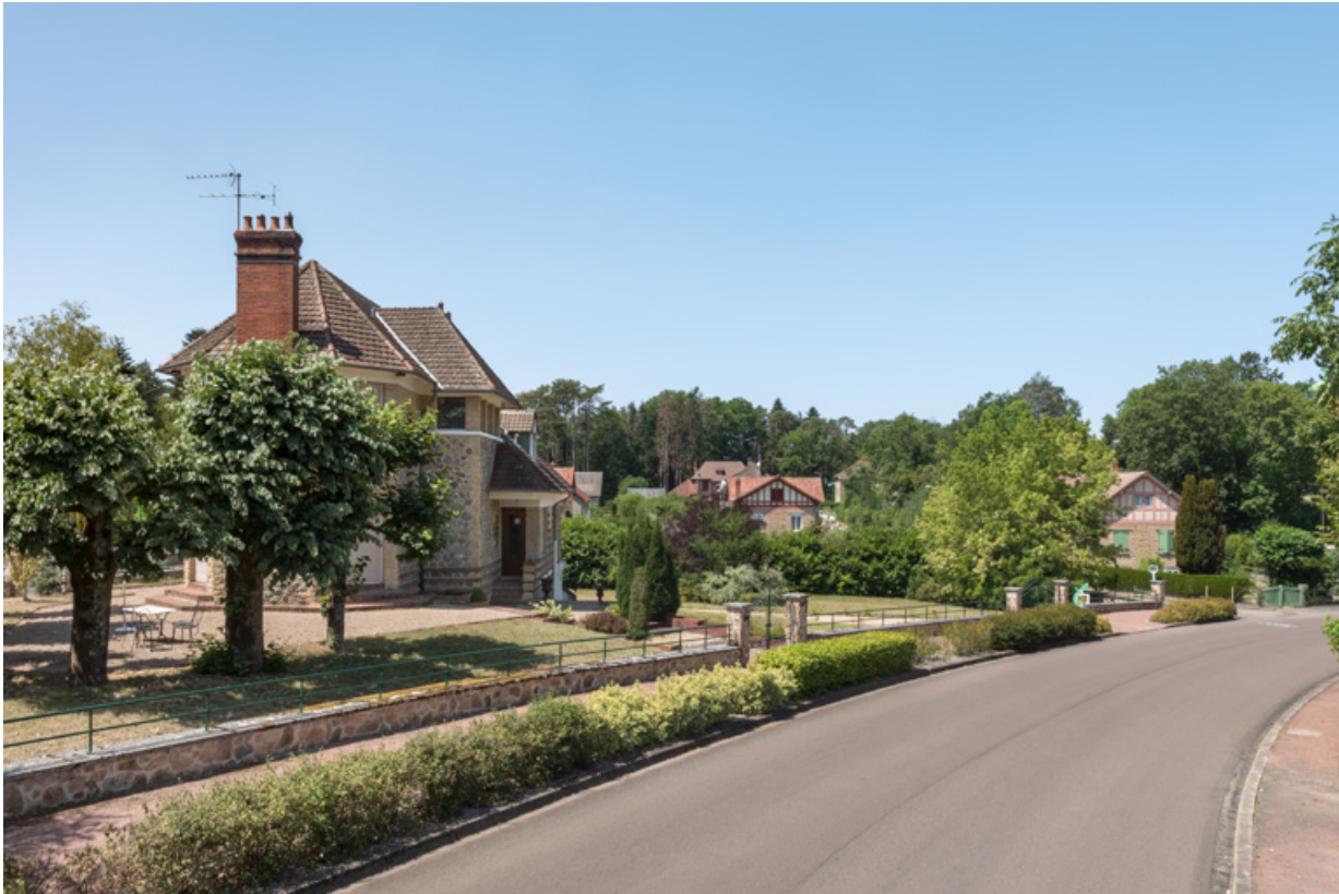
Situation de la villa dans le secteur des Garennes.