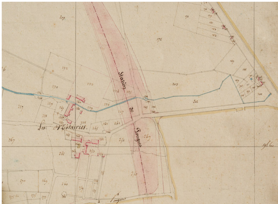
Écart des Métairies dans le plan du cadastre ancien dit napoléonien (1812) avec le tracé de la voie ferrée (vers 1861). 58, Pougues-les-Eaux rue des Sources, lieudit : Le Ponteau