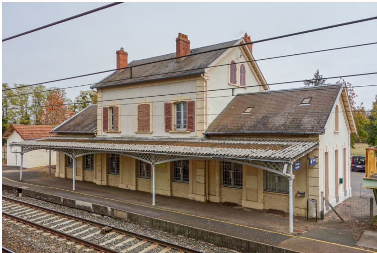
Façade, côté voie ferrée.