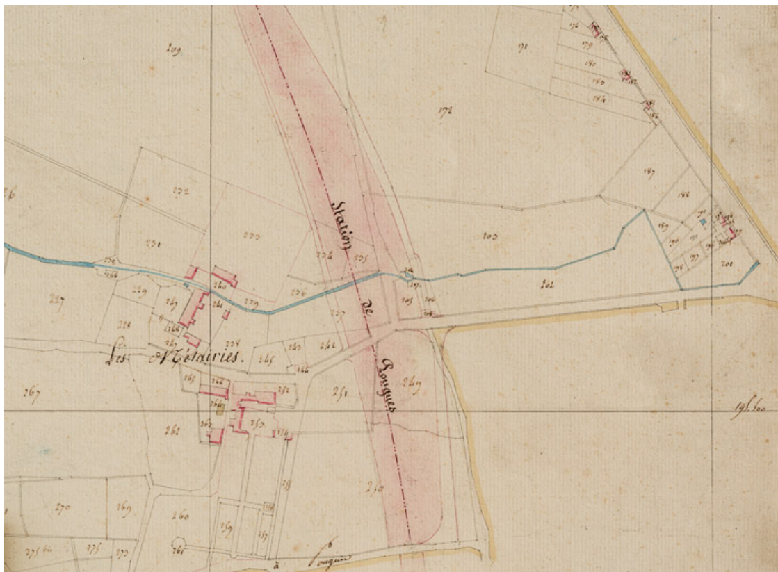
Écart des Métairies dans le plan du cadastre ancien dit napoléonien (1812) avec le tracé de la voie ferrée (vers 1861). 58, Pougues-les-Eaux rue des Sources, lieudit : Le Ponteau