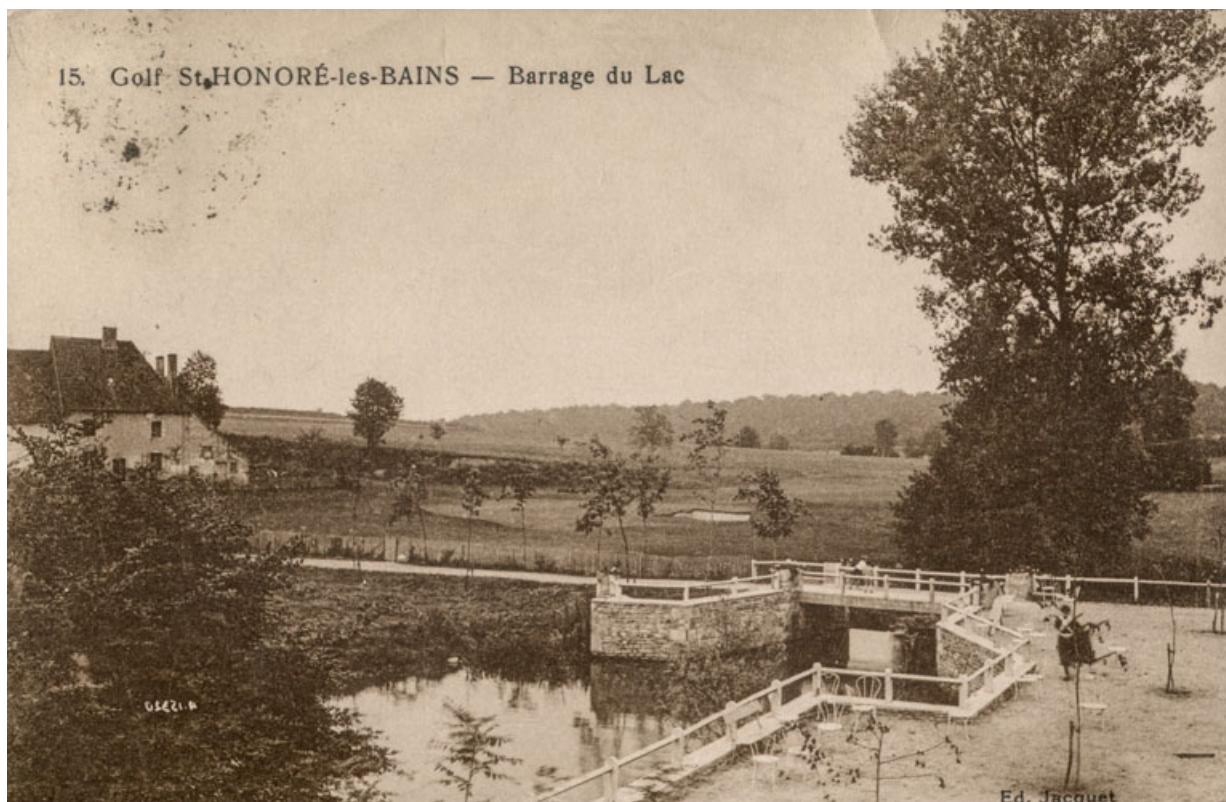
Vue des terrains avec le ruisseau du Donjon.

58, Vandesesse route départementale 3, lieudit : Chèvres