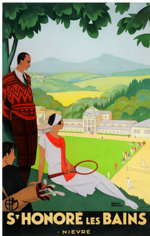
Affiche publicitaire de la Compagnie des chemins de fer de Paris à Lyon et à la Méditerranée (1928). 58, Vandenesse route départementale 3, lieudit : Chèvres