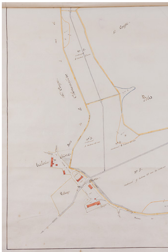
Situation des terrains et des bâtiments à l'ouest de l'étang de Chèvres.

58, Vandenesse route départementale 3, lieudit : Chèvres