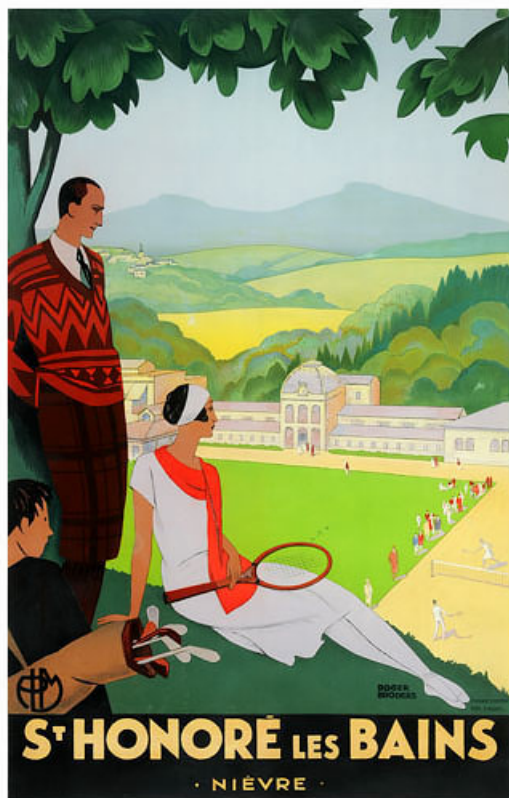
Affiche publicitaire de la Compagnie des chemins de fer de Paris à Lyon et à la Méditerranée (1928). 58, Vandesesse route départementale 3, lieudit : Chèvres