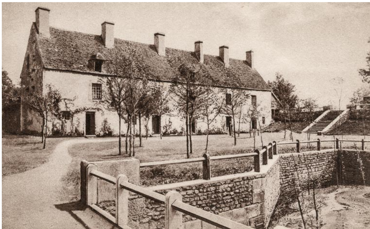
Vue du pavillon du golf avec le ruisseau du Donjon.

58, Vandenesse route départementale 3, lieudit : Chèvres