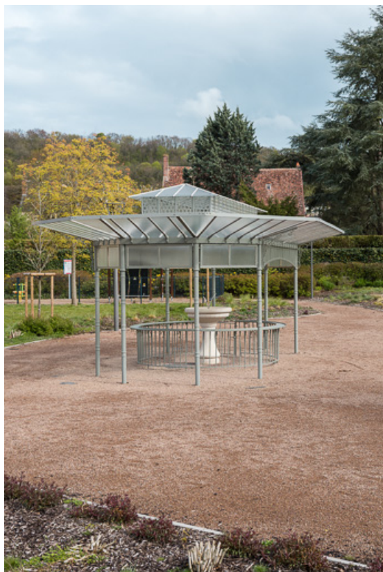
Buvette "reconstruite" à son emplacement actuel, vue extérieure.