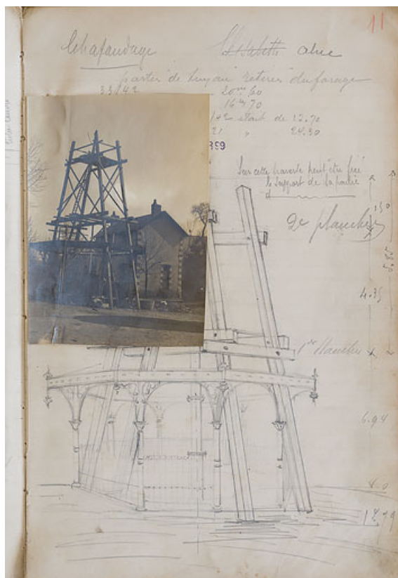
Premier kiosque au-dessus de la source Alice lors du forage de 1899.

58, Pougues-les-Eaux rue des Sources, lieudit : Le Ponteau