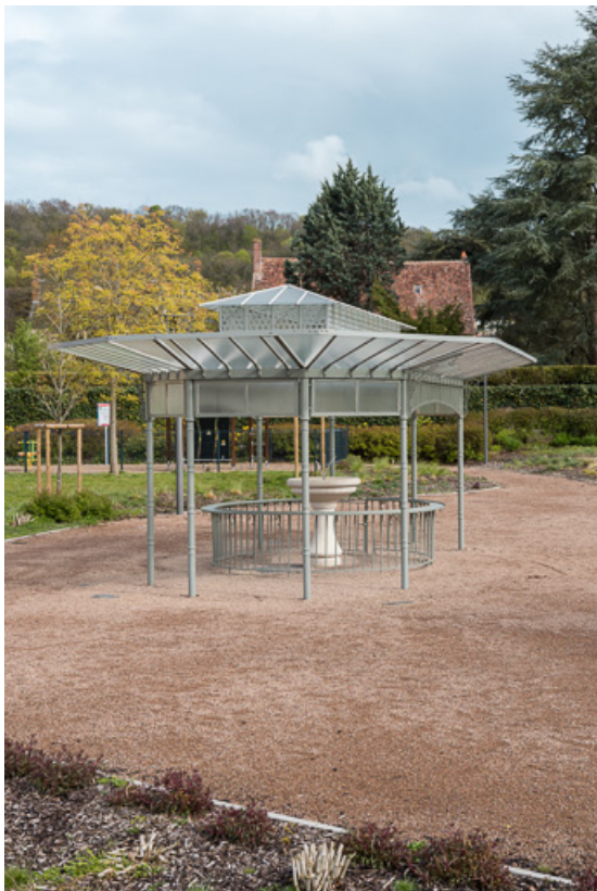
Buvette "reconstruite" à son emplacement actuel, vue extérieure.