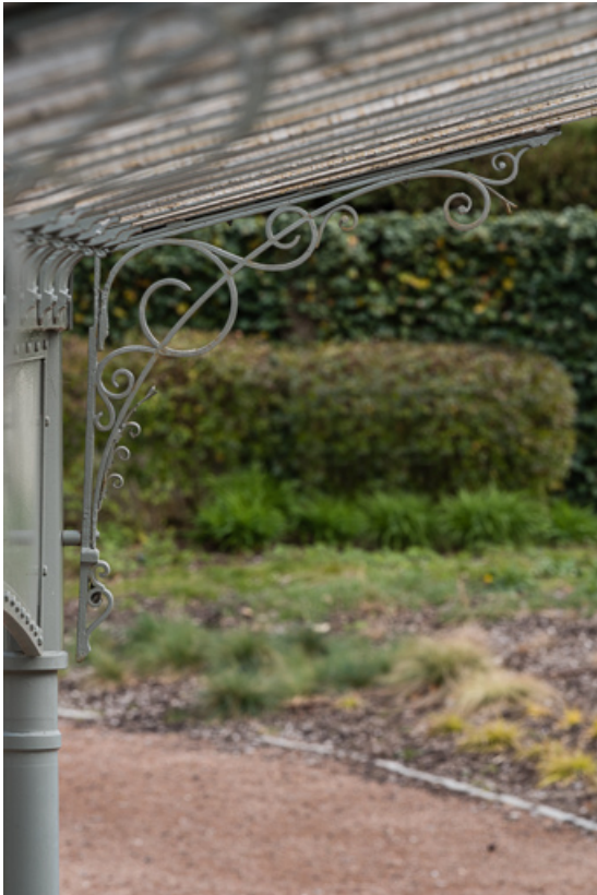
Buvette "reconstruite" à son emplacement actuel, détail de la structure d'origine. 58, Pougues-les-Eaux avenue de Paris