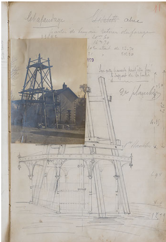
Premier kiosque au-dessus de la source Alice lors du forage de 1899.

58, Pougues-les-Eaux rue des Sources, lieudit : Le Ponteau