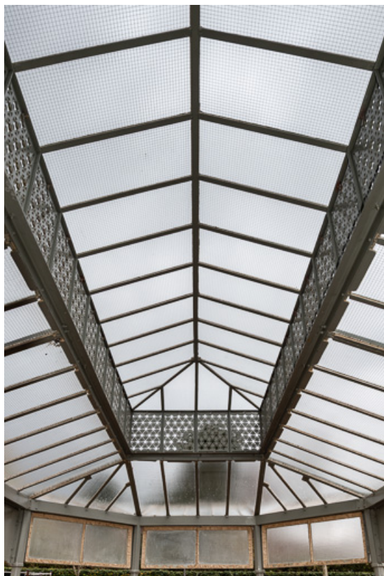
Buvette "reconstruite" à son emplacement actuel, vue intérieure.