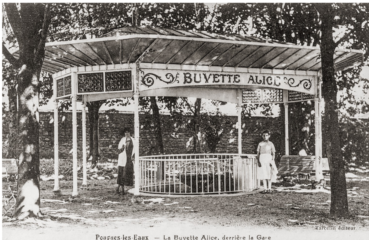
Buvette sur le site du Ponteau, vue depuis l'ouest.