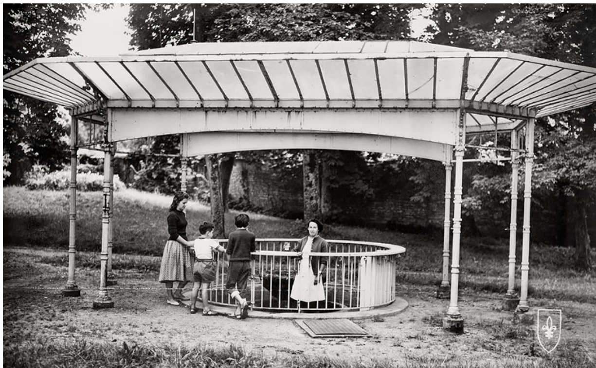
Buvette sur le site du Ponteau, premier état d'abandon (années 1970).