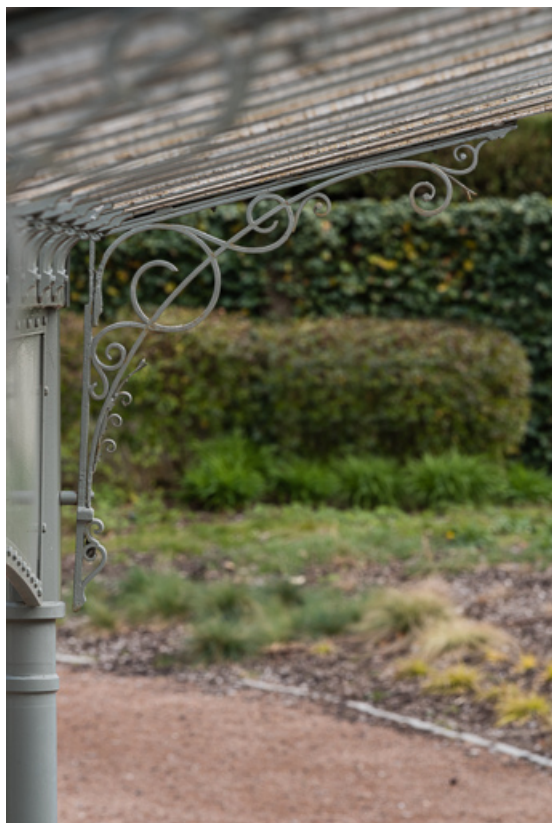
Buvette "reconstruite" à son emplacement actuel, détail de la structure d'origine. 58, Pougues-les-Eaux avenue de Paris