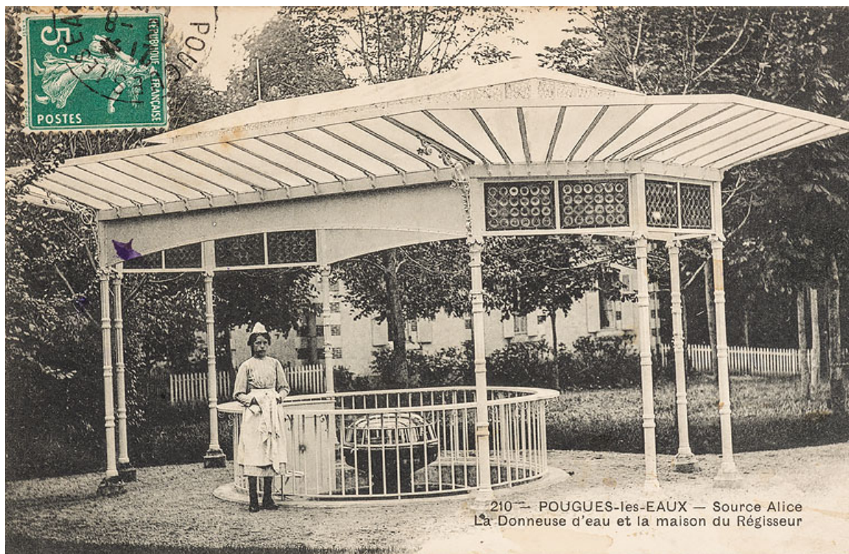
Buvette sur le site du Ponteau, vue depuis le nord.

58, Pougues-les-Eaux rue des Sources, lieudit : Le Ponteau