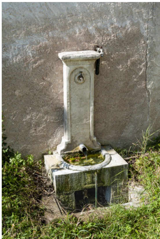
Fontaine de la source, état actuel.

58, Decize, 19 chemin de la Source, lieudit : Saint-Aré