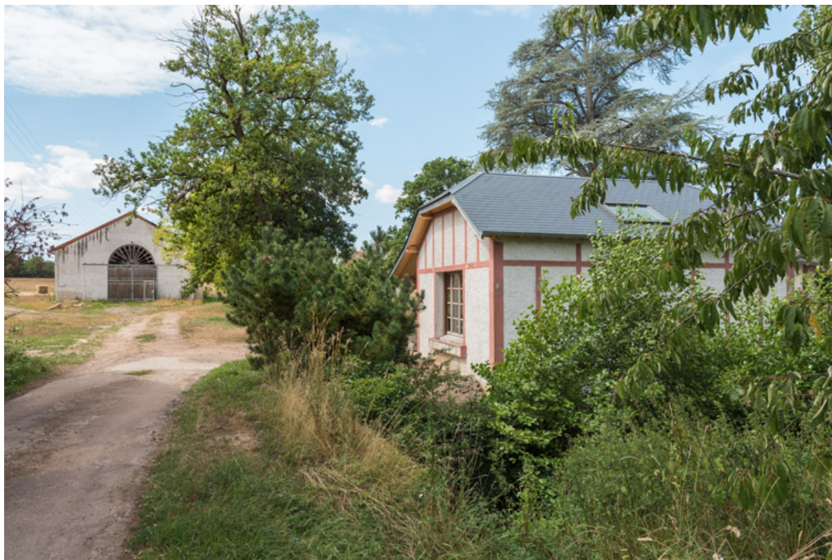
Vue du site avec le pavillon d'entrée (au premier plan) et de l'usine de mise en bouteilles (à l'arrière-plan).

58, Decize, 19 chemin de la Source, lieudit : Saint-Aré