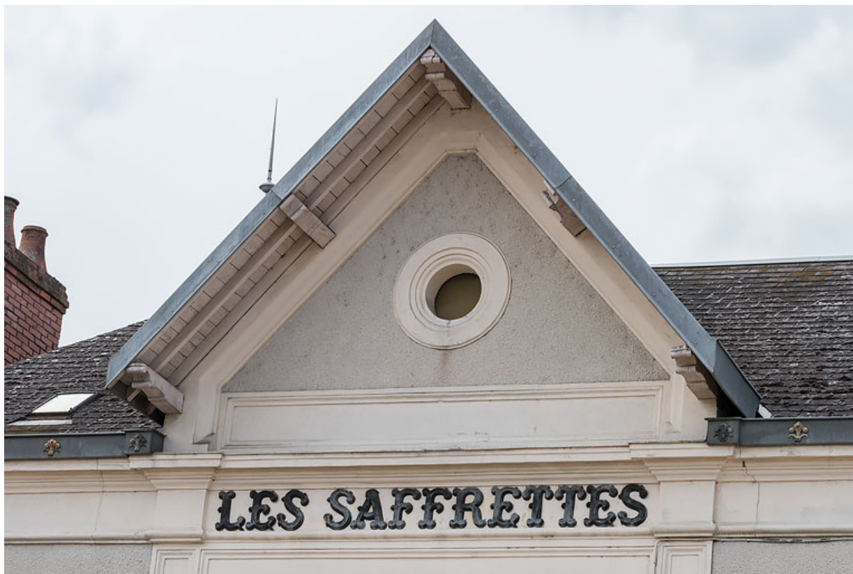
Lucarne-pignon et inscription en façade.

58, Fourchambault, 109 rue du Quatre Septembre