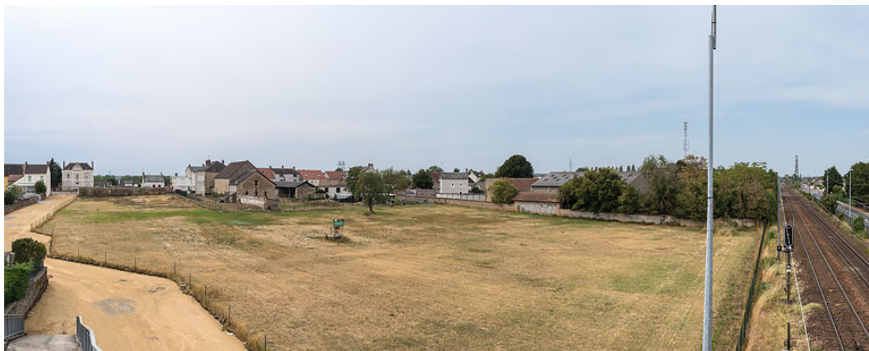
Vue des sites de la source des Saffrettes (à gauche), de la source Montupet (au centre) et de la source Garnier (à droite) prise depuis la passerelle de la voie ferrée.

58, Fourchambault, 6 rue Denfert-Rochereau