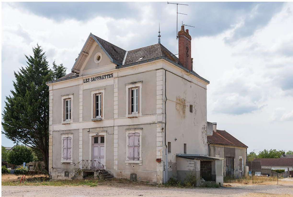
Vue de trois-quarts, avec la remise et le magasin à l'arrière.

58, Fourchambault, 109 rue du Quatre Septembre