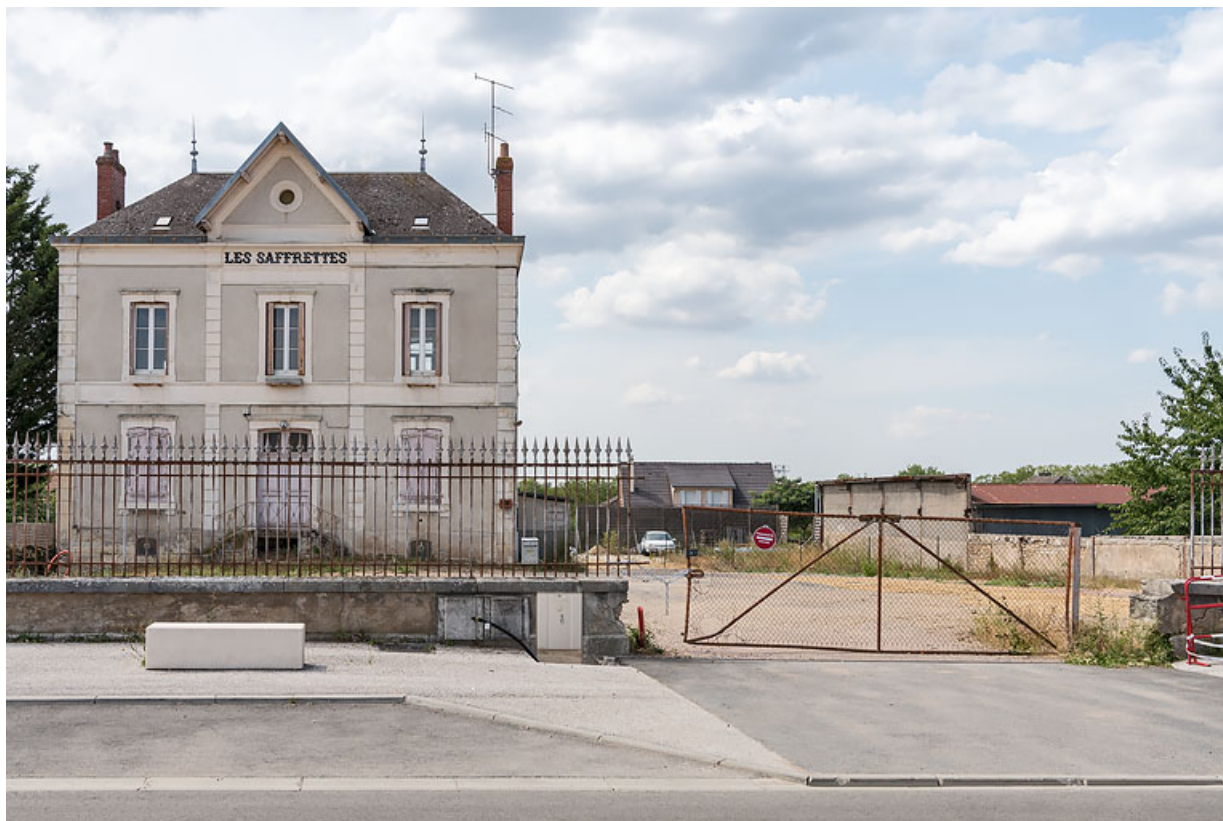
Vue d'ensemble depuis la rue du Quatre Septembre avec l'emplacement du portail (déposé).

58, Fourchambault, 109 rue du Quatre Septembre