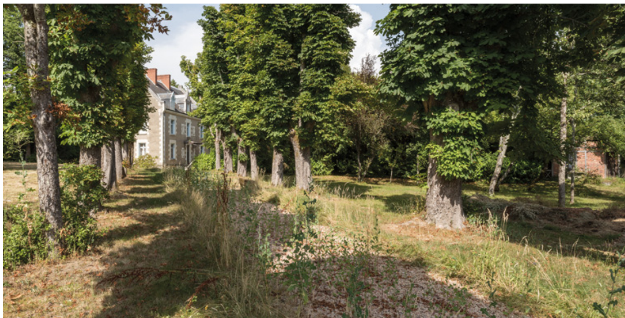
Allée conduisant à la demeure avec le pavillon sur la droite.

58, Saint-Honoré-les-Bains, 27 avenue Eugène Collin