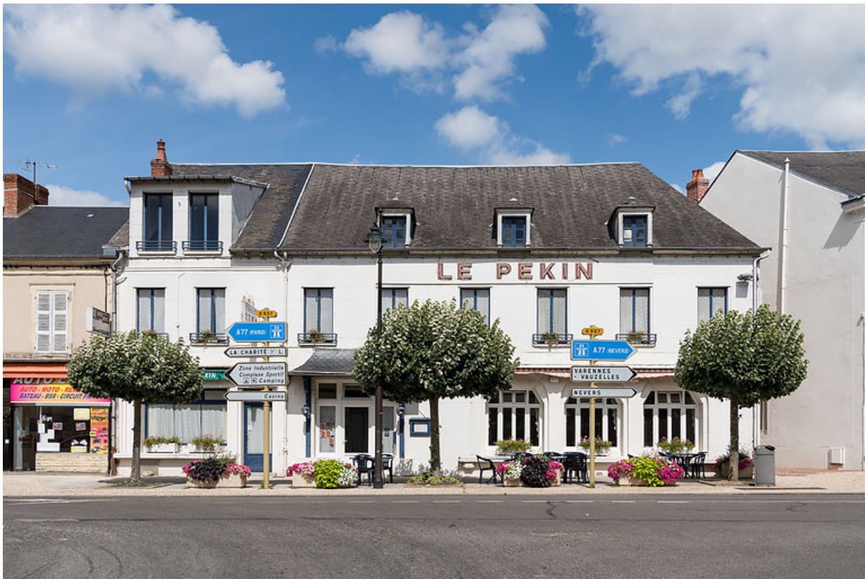
Vue ancienne, prise depuis l'avenue de Paris.

58, Pougues-les-Eaux, 39 avenue de Paris