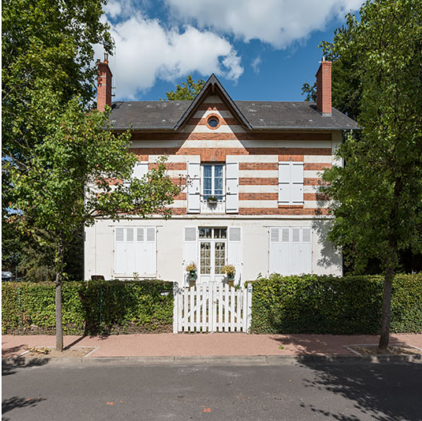
Vue de face.

58, Pougues-les-Eaux, 14 avenue du Casino