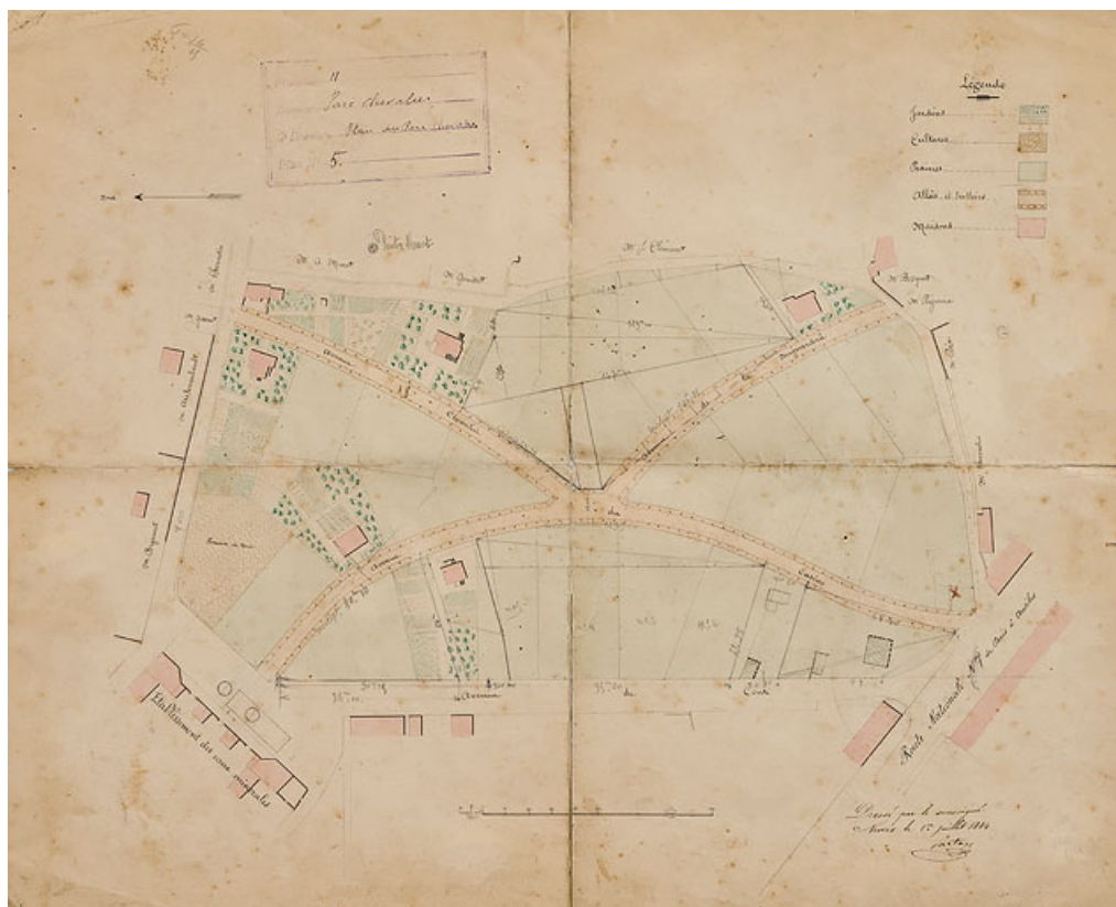
Plan de situation de la demeure dans le Parc Chevalier (1884).