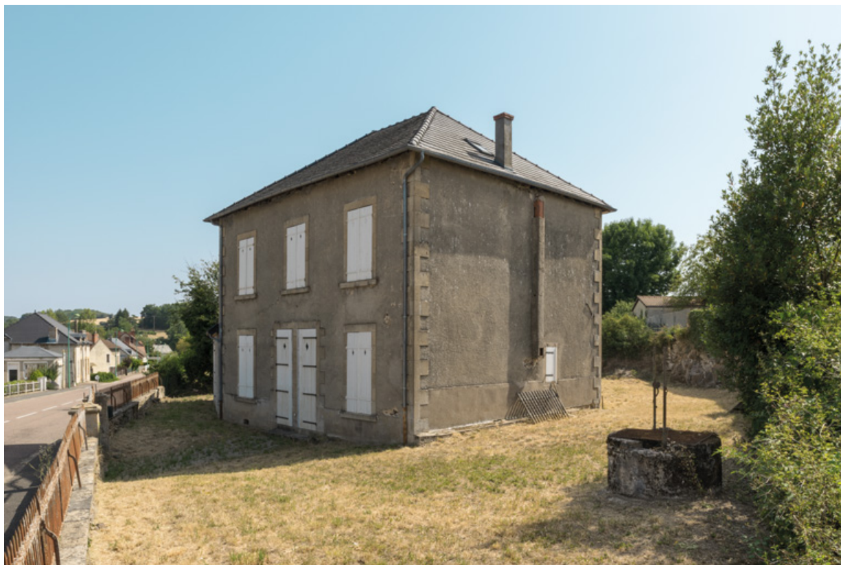
Façade principale, vue depuis le sud-ouest.

58, Saint-Honoré-les-Bains, 40 avenue du Général d'Espeuilles