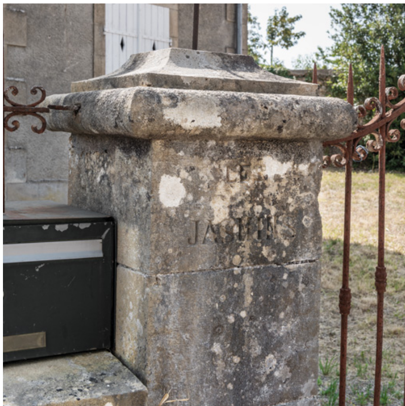
Pilier de portail portant l'inscription du nom de la villa.

58, Saint-Honoré-les-Bains, 40 avenue du Général d'Espeuilles