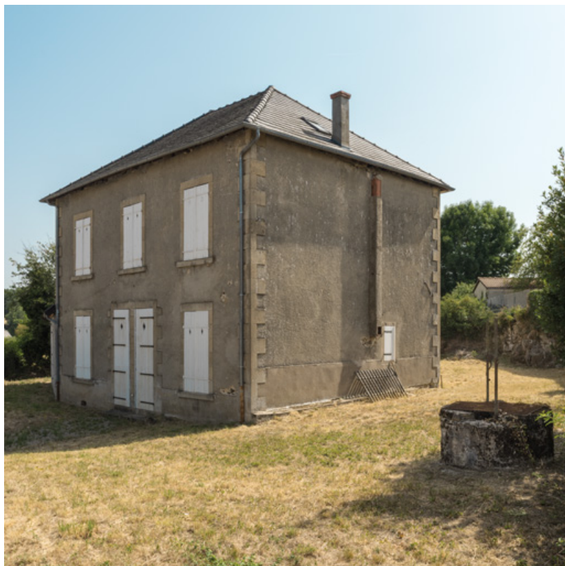
Façade principale, vue depuis le sud-ouest.

58, Saint-Honoré-les-Bains, 40 avenue du Général d'Espeuilles