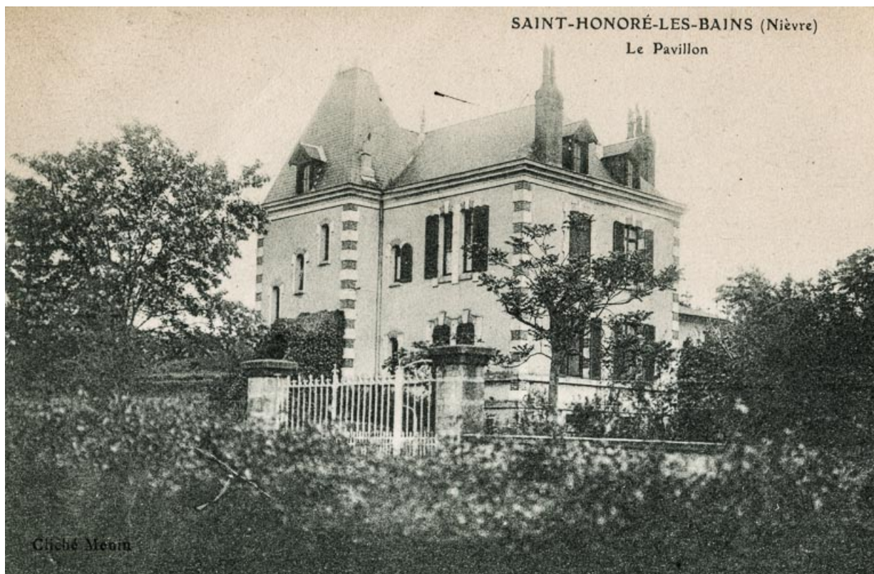
Élévation sur la rue, vue depuis depuis l'Hôtel Bellevue.

58, Saint-Honoré-les-Bains, 6 rue Félicie Musset