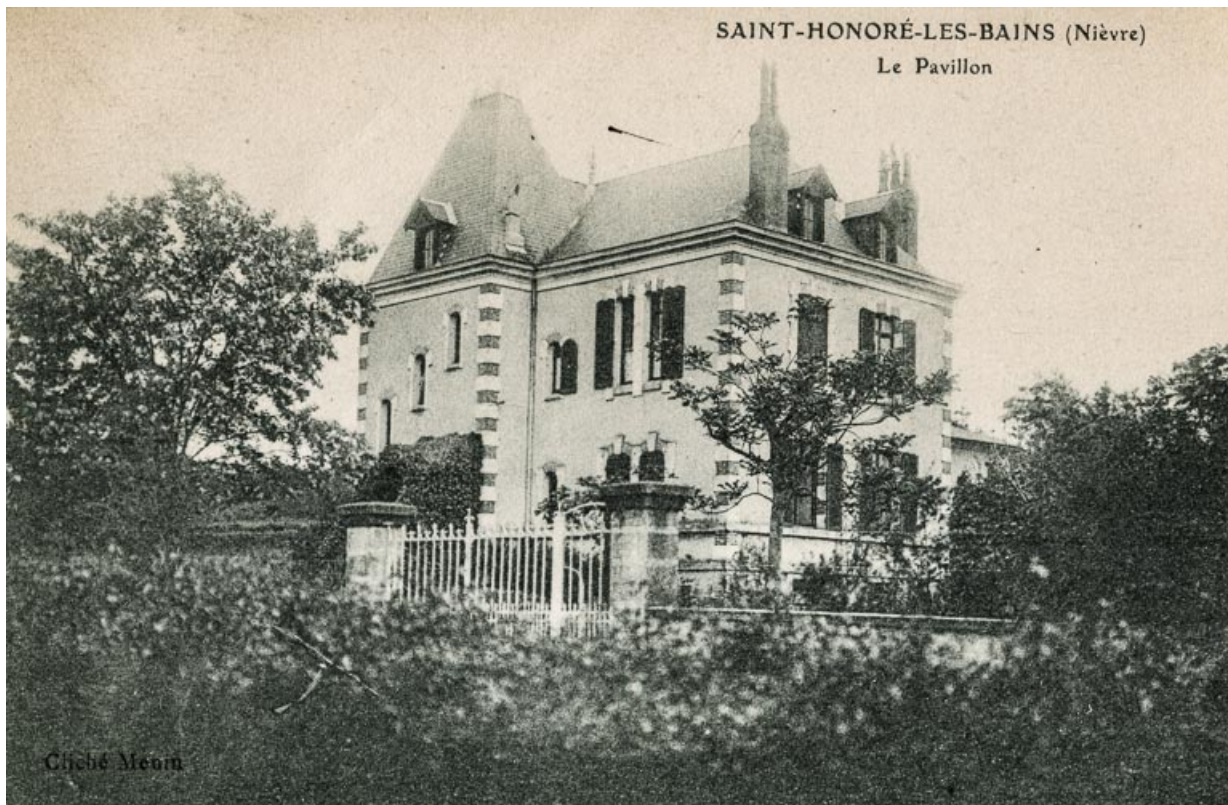
Élévation sur la rue, vue depuis l'Hôtel Bellevue.

58, Saint-Honoré-les-Bains, 6 rue Félicie Musset