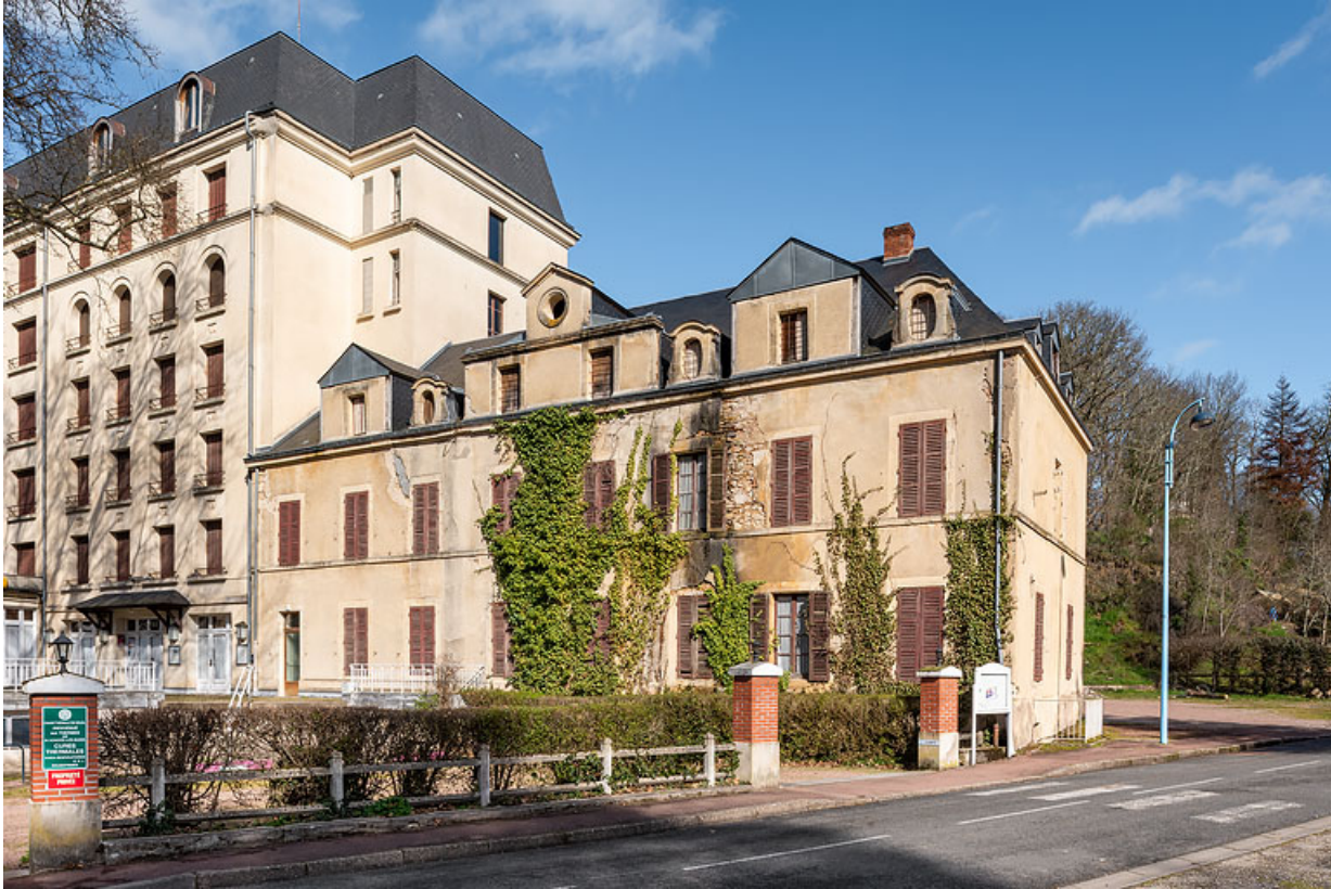
Façade principale, vue depuis le sud-ouest.

58, Saint-Honoré-les-Bains, 16 rue Joseph Duriaux