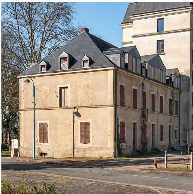
Façade secondaire, vue depuis le sud-est.

58, Saint-Honoré-les-Bains, 16 rue Joseph Duriaux