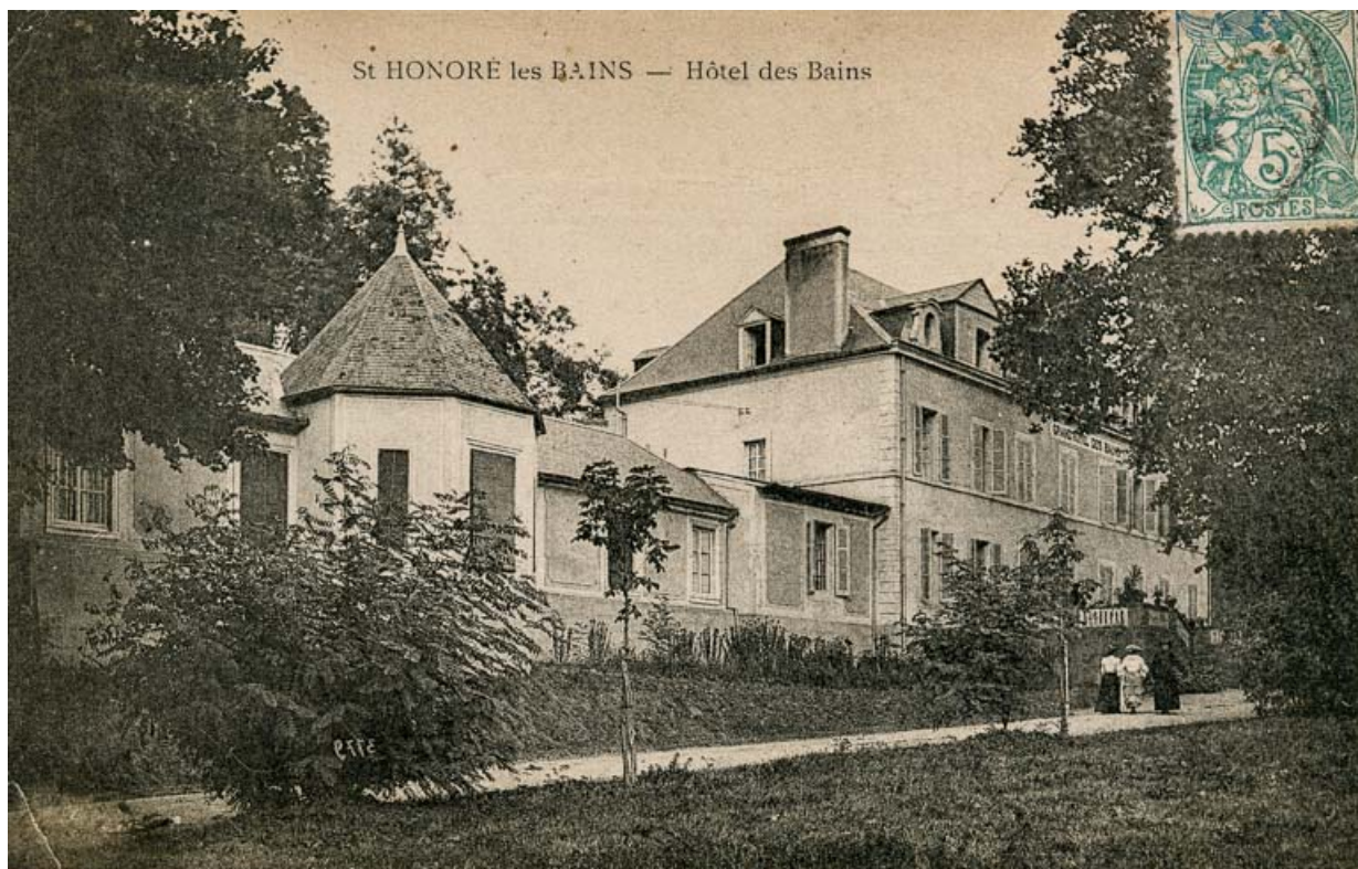
Façade principale, vue depuis le nord-ouest.

58, Saint-Honoré-les-Bains, 16 rue Joseph Duriaux