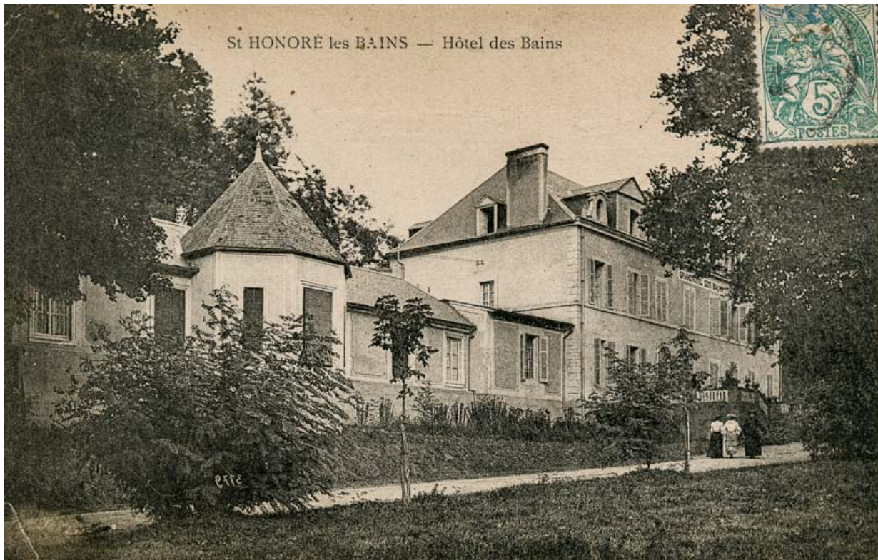
Façade principale, vue depuis le nord-ouest.

58, Saint-Honoré-les-Bains, 16 rue Joseph Duriaux