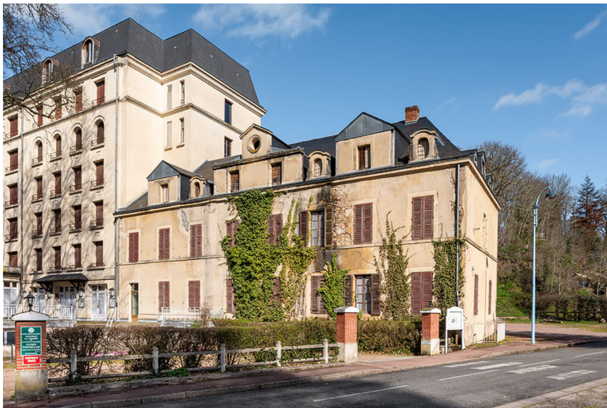
Façade principale, vue depuis le sud-ouest.

58, Saint-Honoré-les-Bains, 16 rue Joseph Duriaux