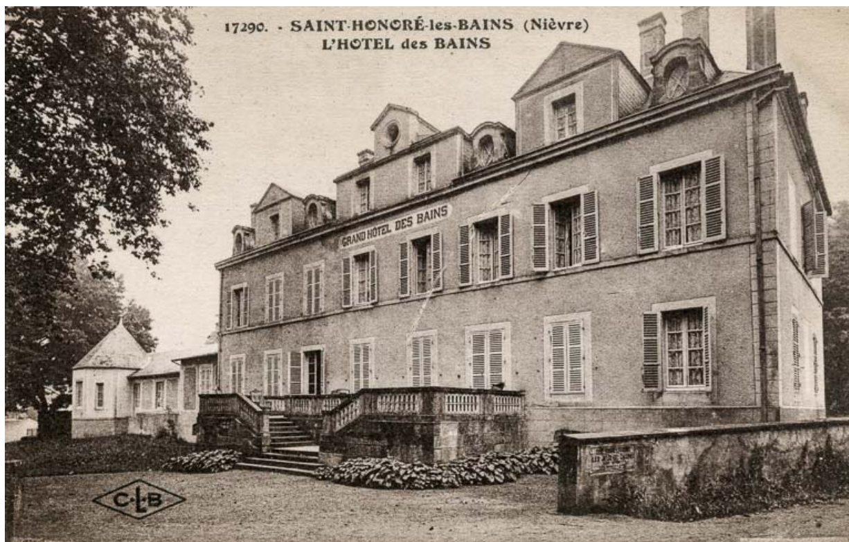
Façade principale, vue depuis le sud-ouest.

58, Saint-Honoré-les-Bains, 16 rue Joseph Duriaux