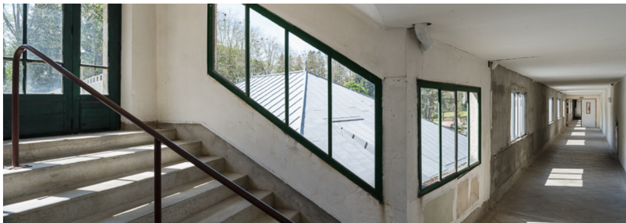
Vue intérieure en direction de la terrasse du casino.

58, Saint-Honoré-les-Bains avenue du Docteur Segard