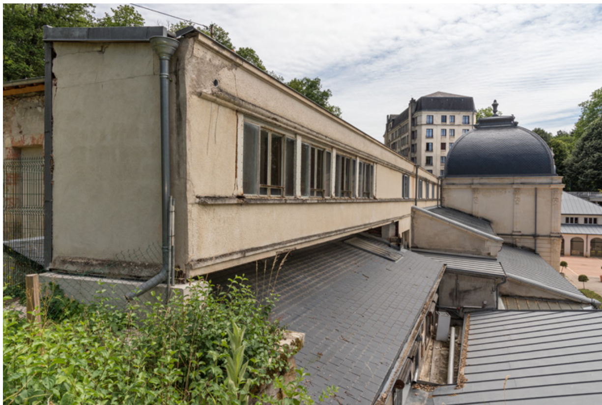
Vue extérieure depuis la terrasse du casino (détruit) en 2019.

58, Saint-Honoré-les-Bains avenue du Docteur Segard