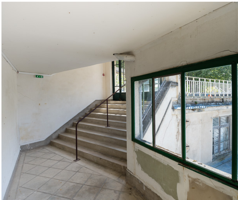
Vue intérieure en direction de la terrasse de l'hôtel. 58, Saint-Honoré-les-Bains avenue du Docteur Segard

N° de l'illustration : 20195800198NUC4AQ