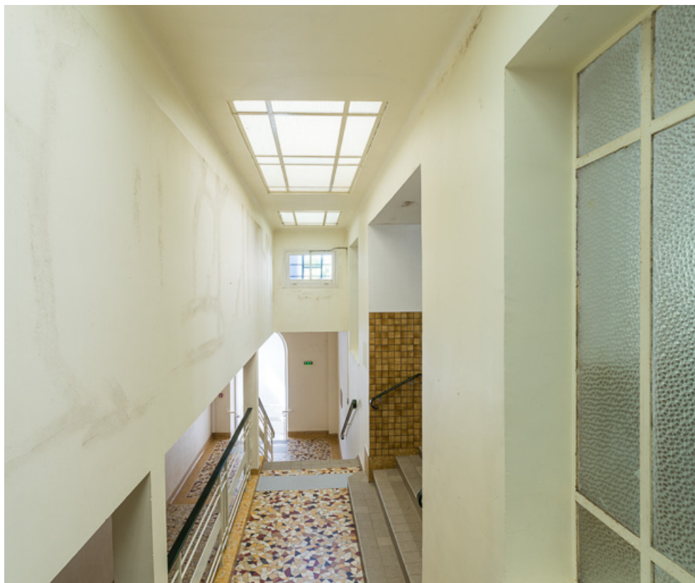
Passage du couloir (à gauche) dans l'établissement thermal.

58, Saint-Honoré-les-Bains avenue du Docteur Segard