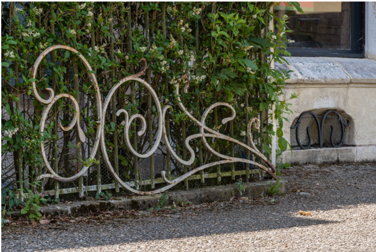
Grille de la partie supérieure (d'une paire) : décor de style Art Nouveau.

58, Saint-Honoré-les-Bains, 17 avenue Eugène Collin