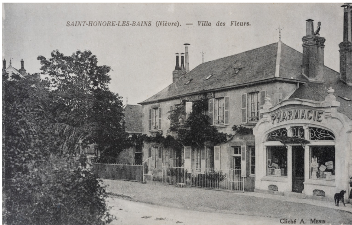
Élévation depuis la rue après la construction de la pharmacie.

58, Saint-Honoré-les-Bains, 15-17 avenue Eugène Collin