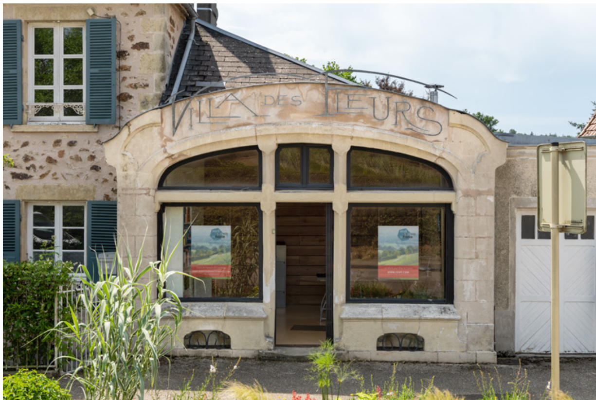
Façade sur l'avenue en 2019.

58, Saint-Honoré-les-Bains, 17 avenue Eugène Collin