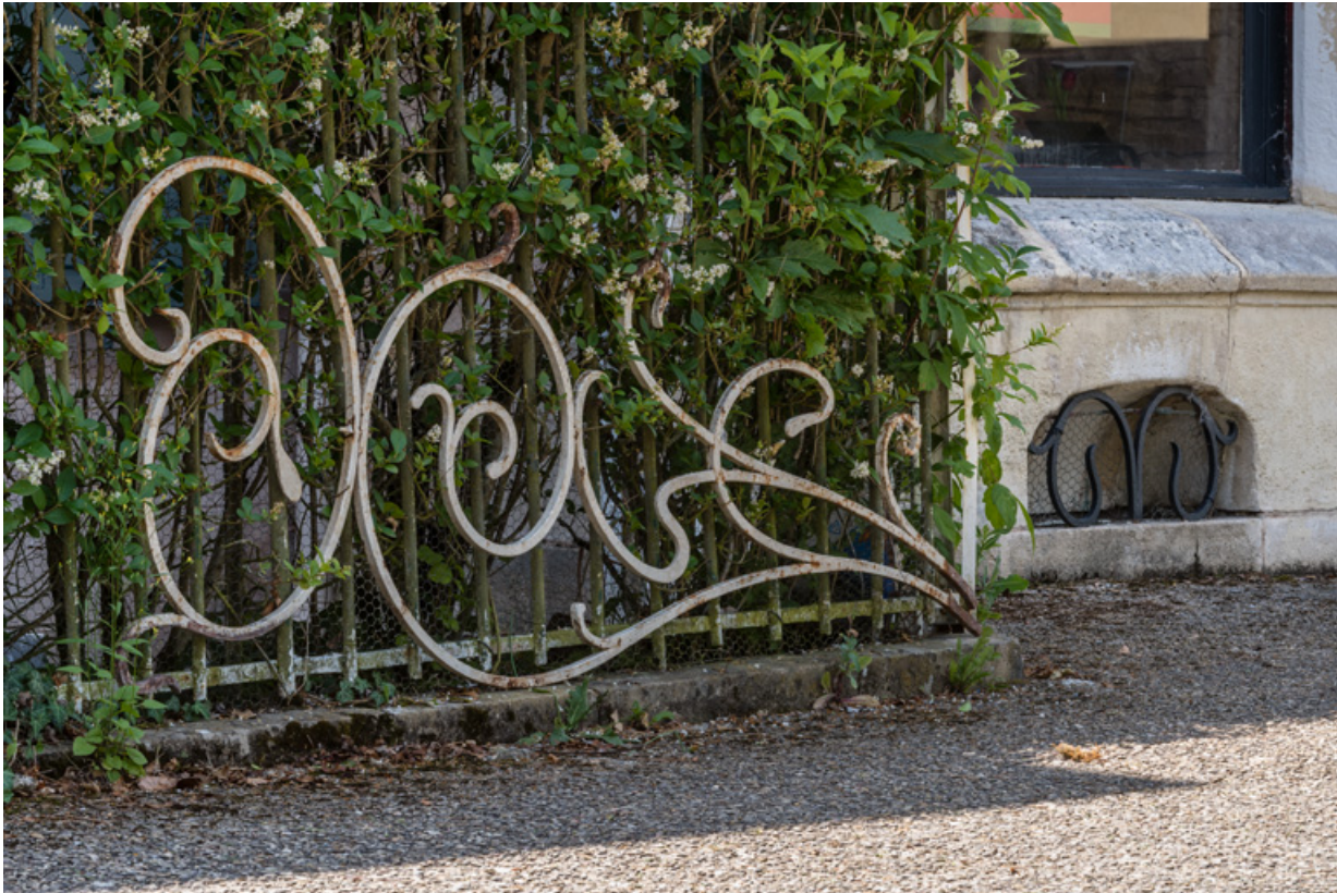
Grille de la partie supérieure (d'une paire) : décor de style Art Nouveau.

58, Saint-Honoré-les-Bains, 17 avenue Eugène Collin