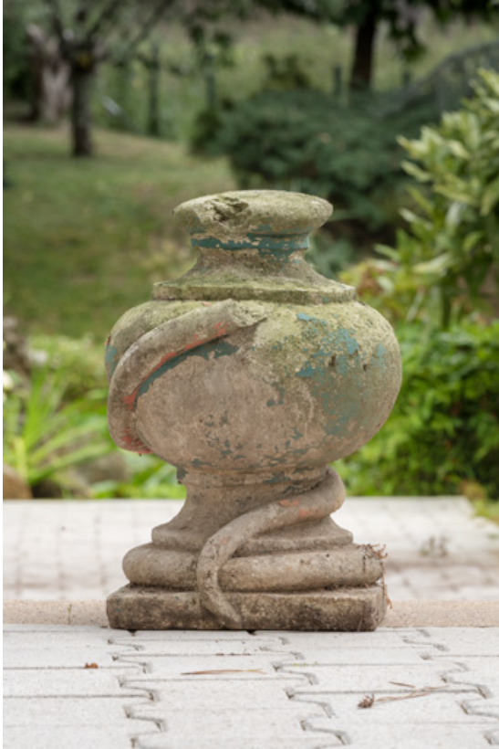
Vase d'amortissement (d'une paire) : pot d'apothicaire et serpent.

58, Saint-Honoré-les-Bains, 17 avenue Eugène Collin