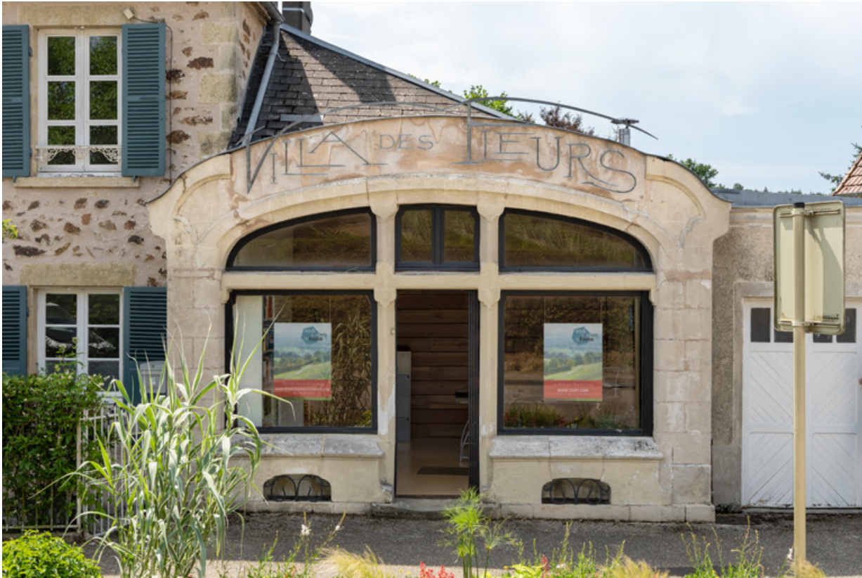
Façade sur l'avenue en 2019.

58, Saint-Honoré-les-Bains, 17 avenue Eugène Collin