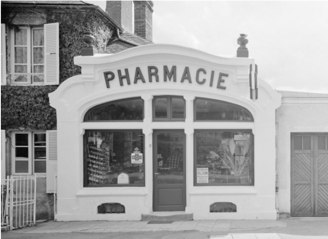
Façade sur l'avenue en 1978.

58, Saint-Honoré-les-Bains, 17 avenue Eugène Collin