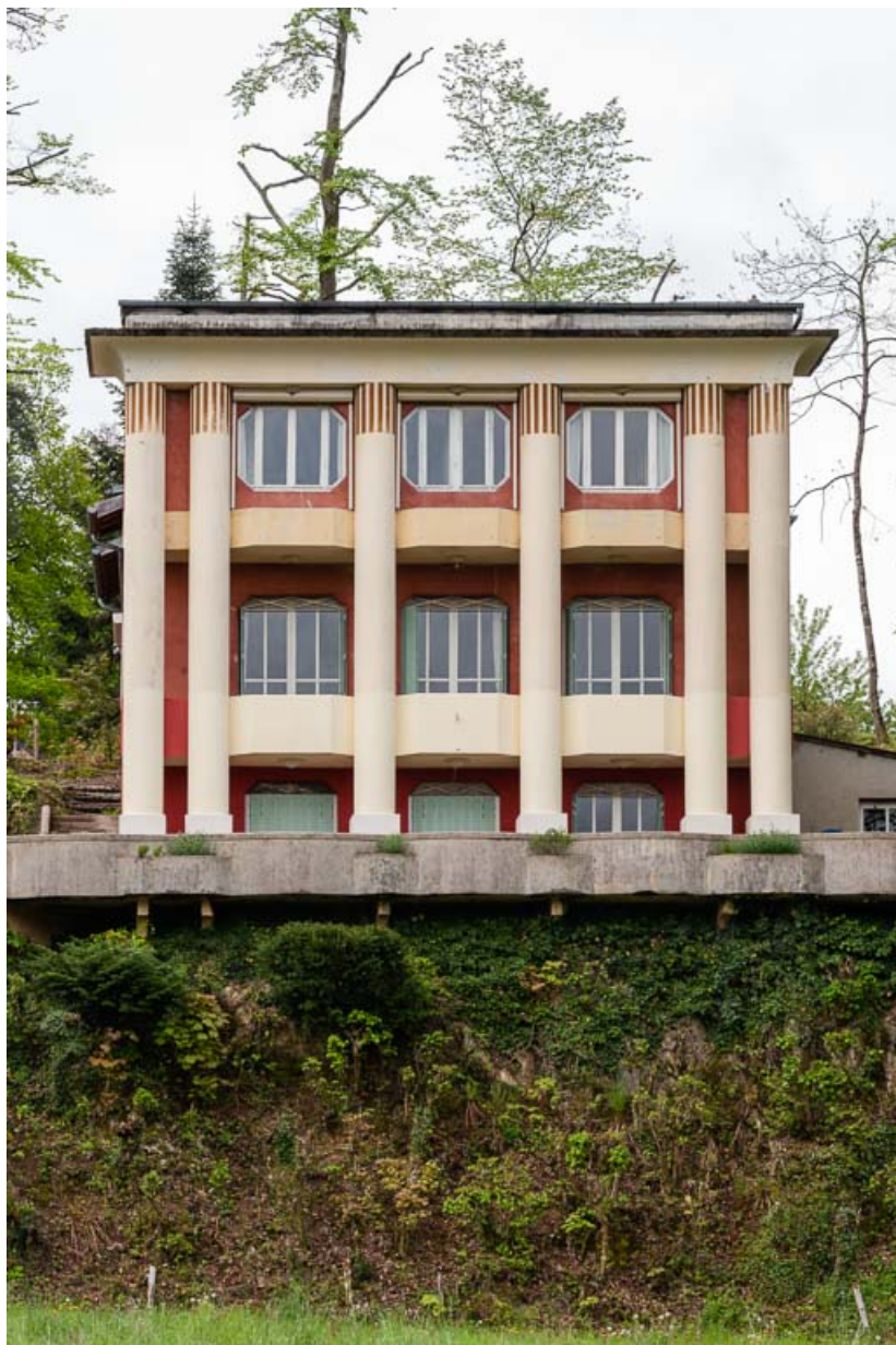
Façade nord, vue de face.

58, Saint-Honoré-les-Bains, 1 allée de la Chapelle