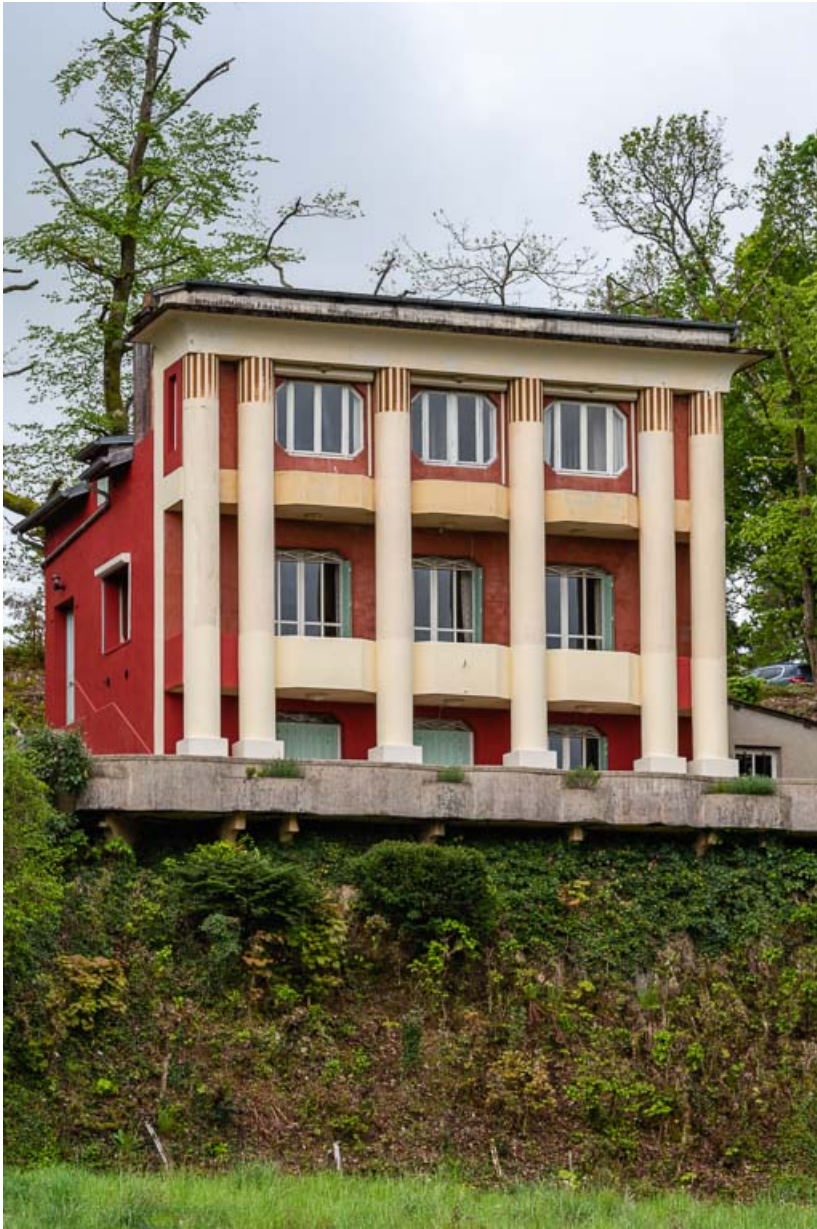
Façade nord, vue de trois-quarts.

58, Saint-Honoré-les-Bains, 1 allée de la Chapelle