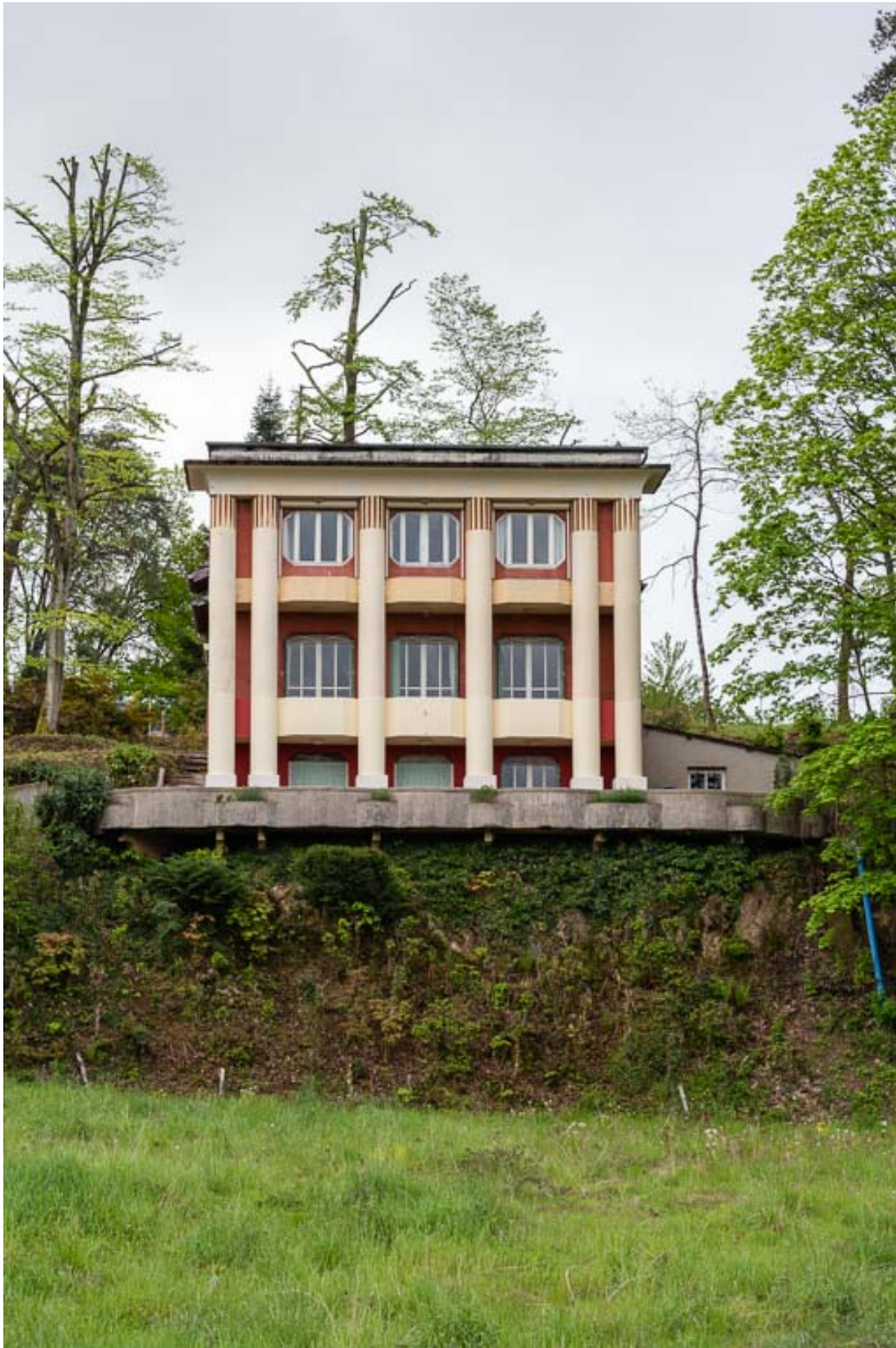
Façade nord, vue de face.

58, Saint-Honoré-les-Bains, 1 allée de la Chapelle