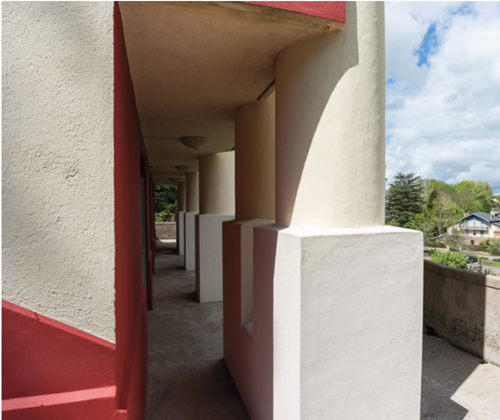
Terrasse de la façade nord, socle des colonnes.

58, Saint-Honoré-les-Bains, 1 allée de la Chapelle