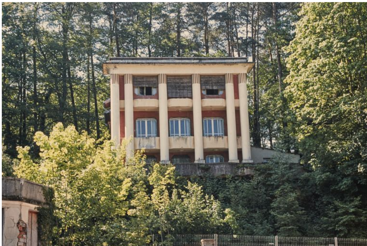
Façade nord, vue de face.

58, Saint-Honoré-les-Bains, 1 allée de la Chapelle