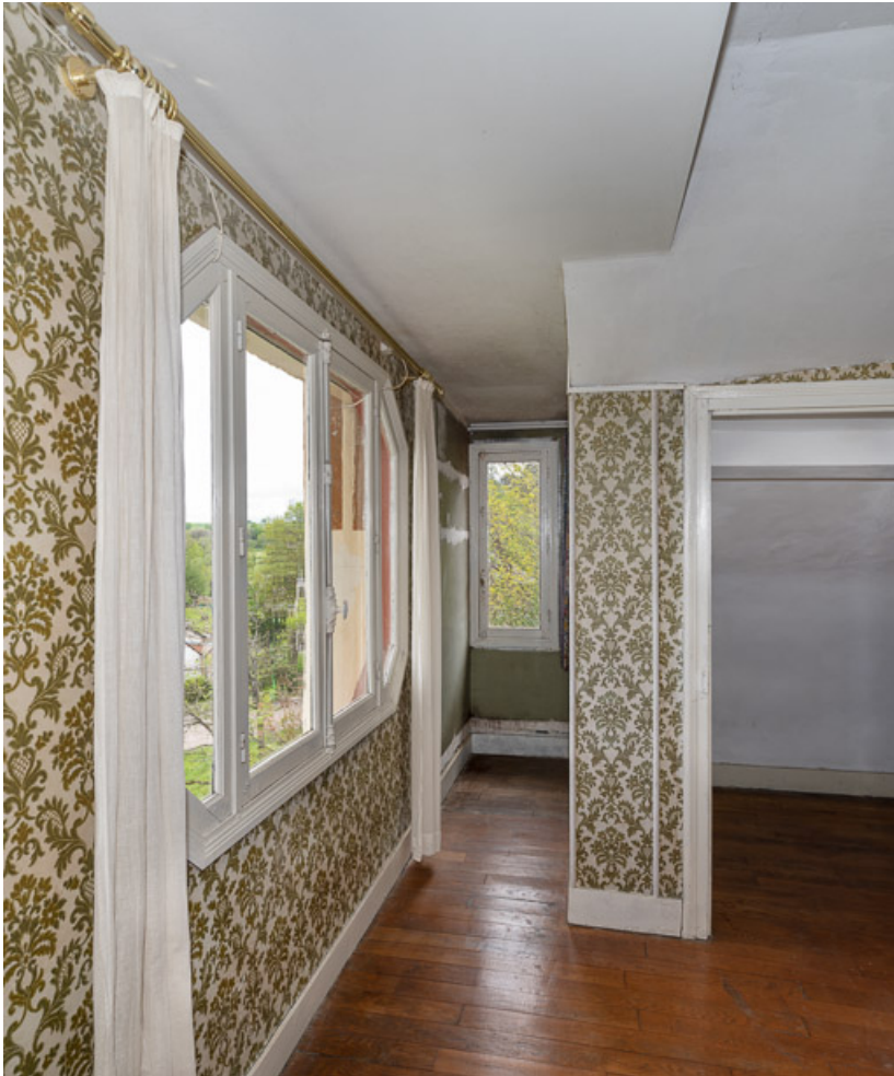
chambre ouverte en façade nord.

58, Saint-Honoré-les-Bains, 1 allée de la Chapelle