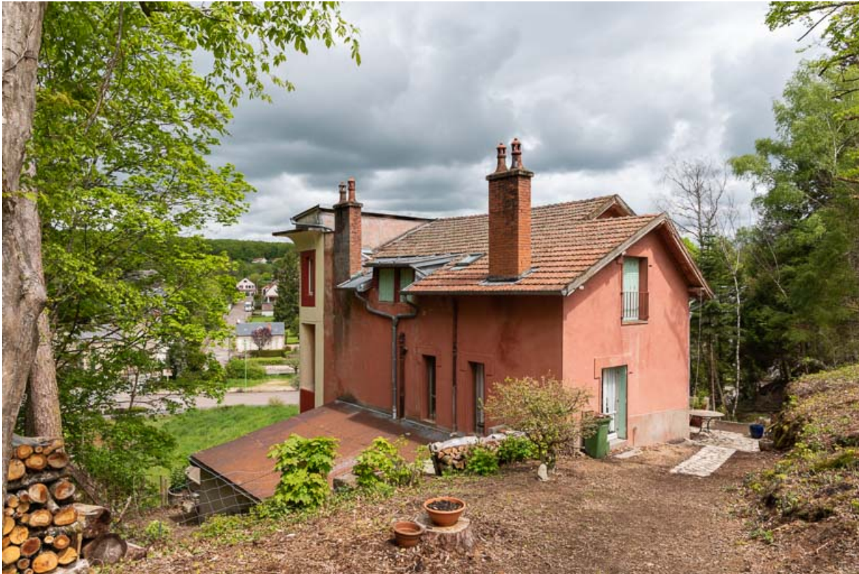
Façade sud, vue de trois-quarts.

58, Saint-Honoré-les-Bains, 1 allée de la Chapelle