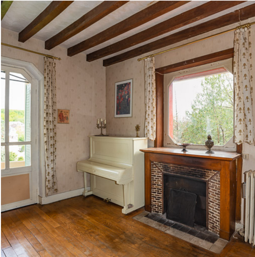
Séjour avec cheminée sous-baie.

58, Saint-Honoré-les-Bains, 1 allée de la Chapelle