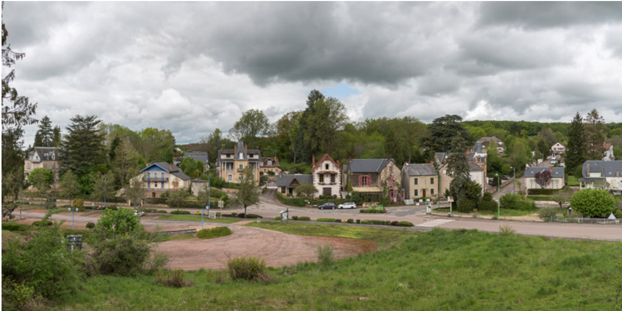
Vue sur le quartier thermal depuis la villa.

58, Saint-Honoré-les-Bains, 1 allée de la Chapelle