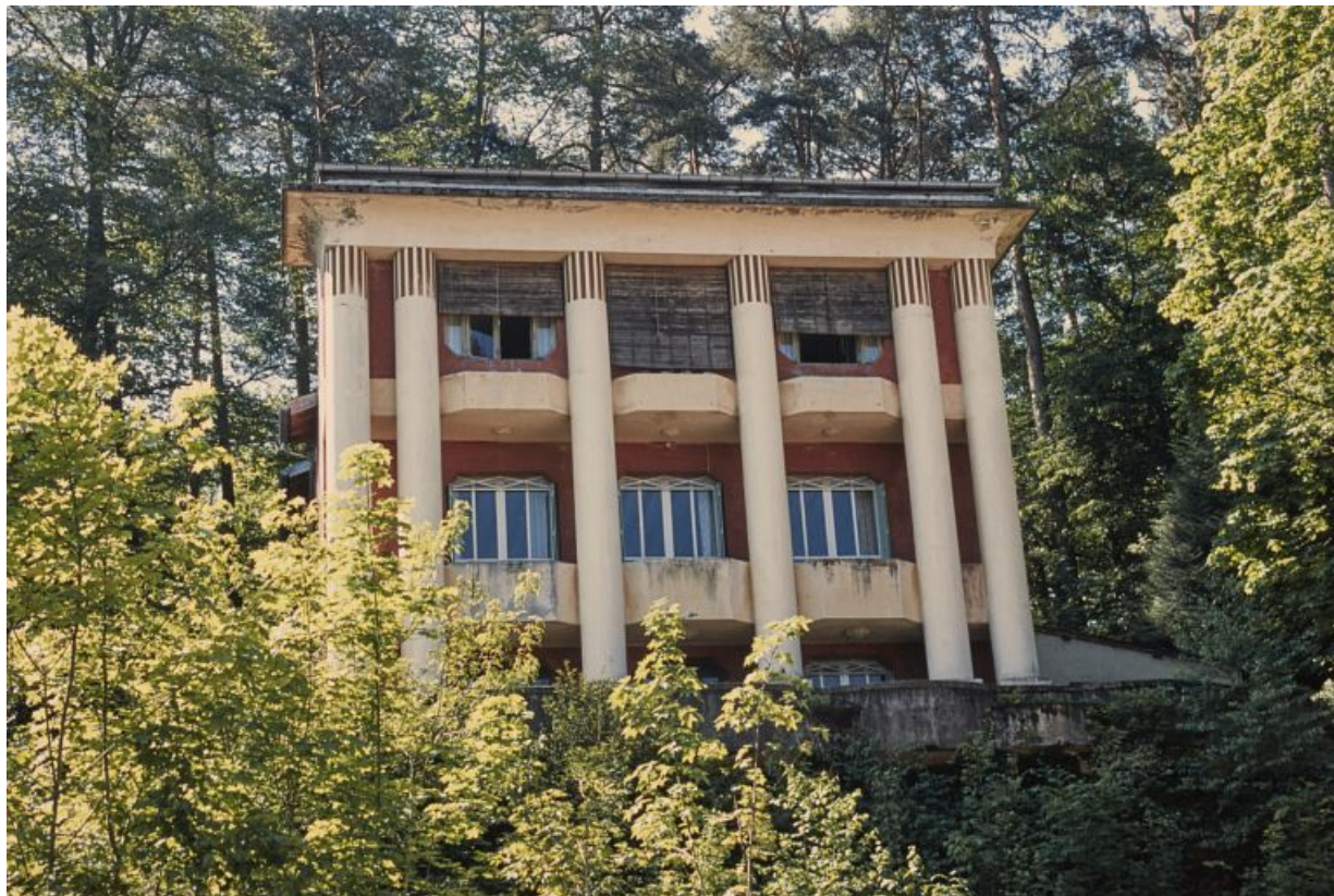
Façade nord, vue de face.

58, Saint-Honoré-les-Bains, 1 allée de la Chapelle