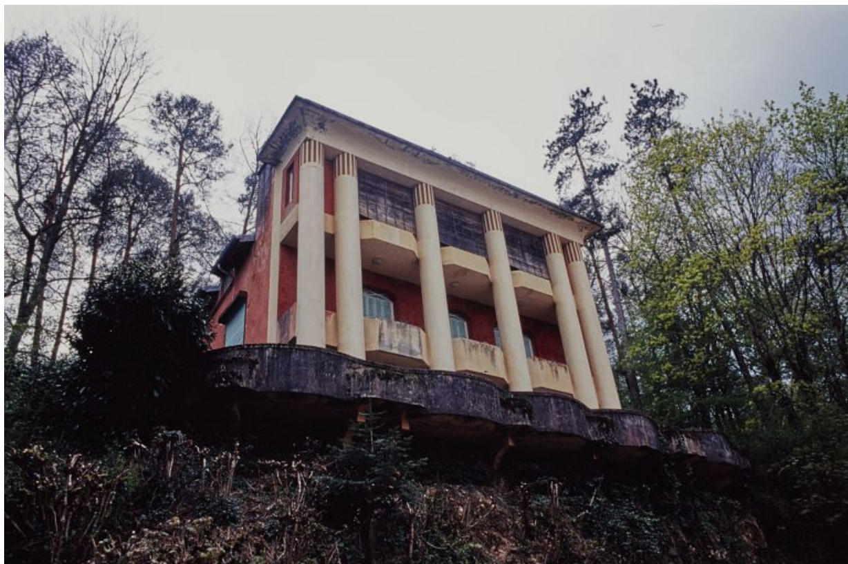
Façade nord, vue en contre-plongée.

58, Saint-Honoré-les-Bains, 1 allée de la Chapelle