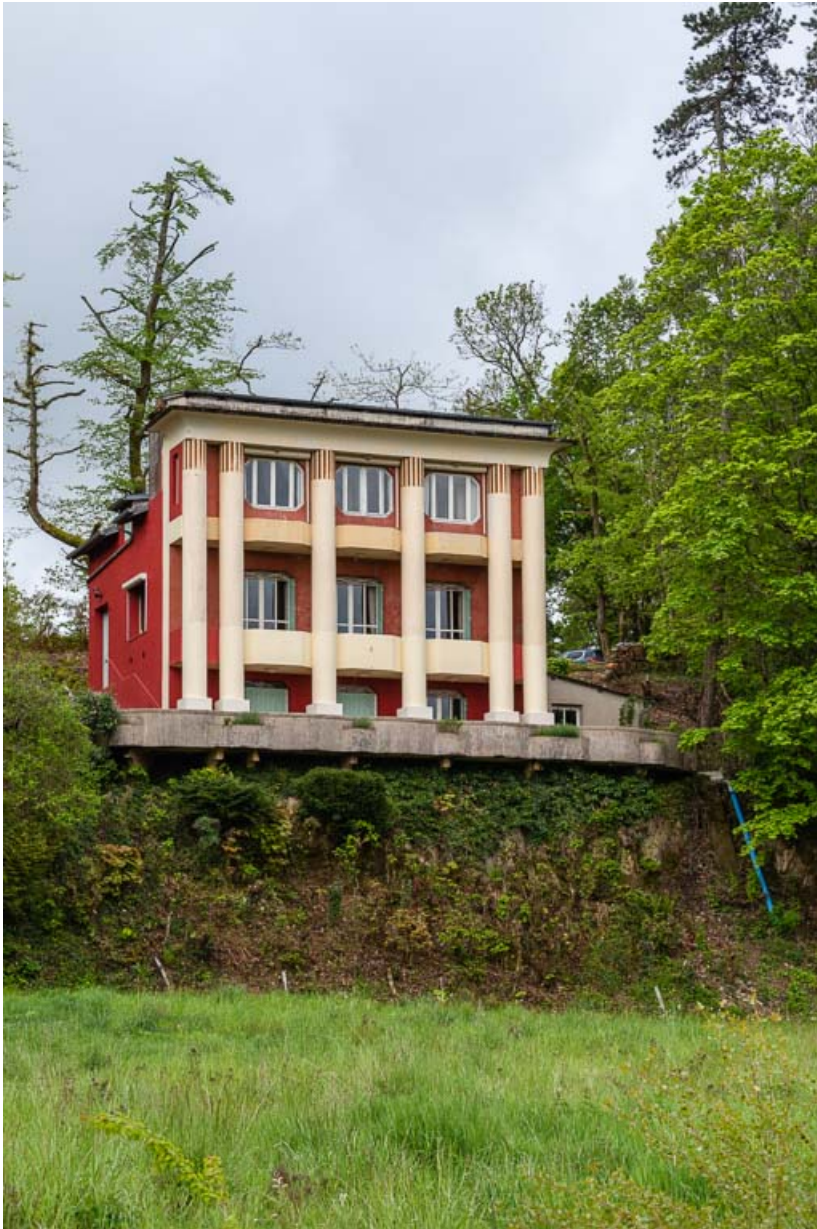
Façade nord, vue de trois-quarts.

58, Saint-Honoré-les-Bains, 1 allée de la Chapelle