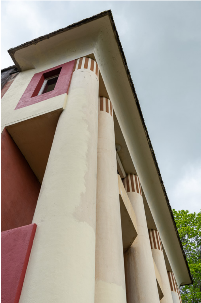
Corniche surmontant le troisième niveau de la façade nord.

58, Saint-Honoré-les-Bains, 1 allée de la Chapelle