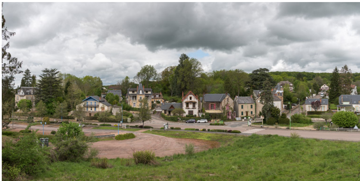
Vue sur le quartier thermal depuis la villa.