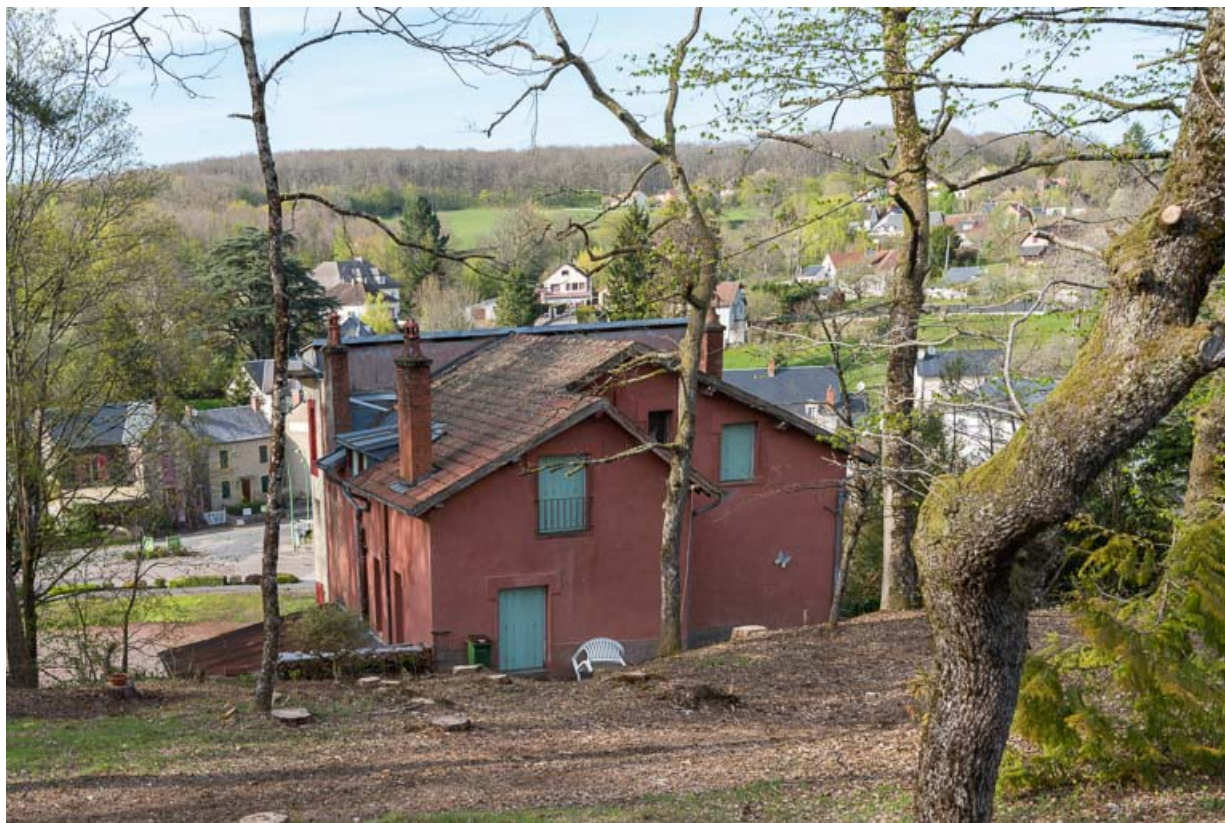
Vue depuis la colline des Garennes au sud.

58, Saint-Honoré-les-Bains, 1 allée de la Chapelle