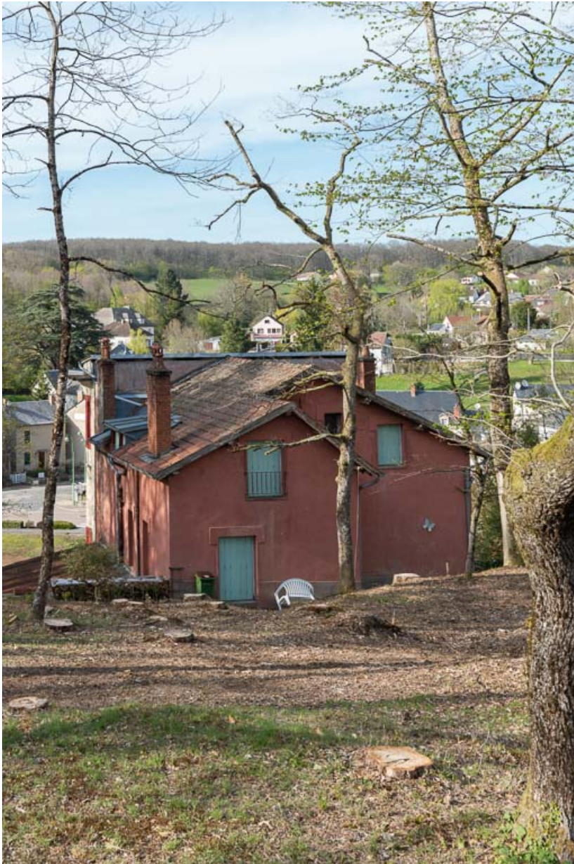
Vue depuis la colline des Garennes au sud.

58, Saint-Honoré-les-Bains, 1 allée de la Chapelle