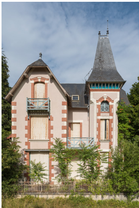
Façade principale, vue de face.

58, Saint-Honoré-les-Bains, 2 allée de la Fresnaie