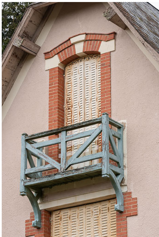
Mur-pignon en façade, garde-corps en bois du balcon.

58, Saint-Honoré-les-Bains, 2 allée de la Fresnaie