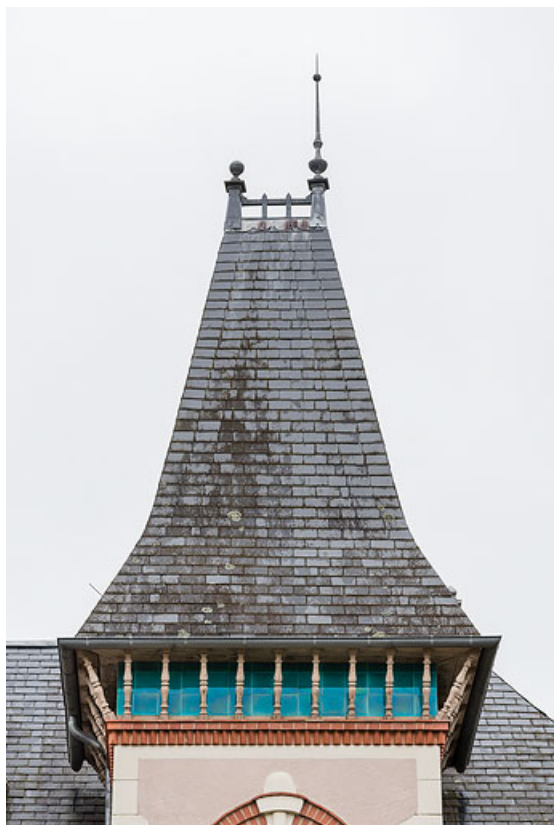
Tour demi-hors-œuvre, toiture et crête faitière. 58, Saint-Honoré-les-Bains, 2 allée de la Fresnaie