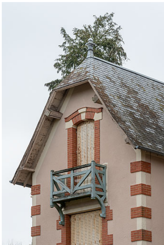
Mur-pignon en façade, demi-croupe en ardoise.

58, Saint-Honoré-les-Bains, 2 allée de la Fresnaie