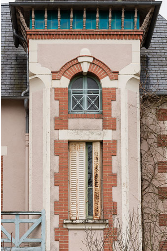
Tour demi-hors-œuvre, détail.

58, Saint-Honoré-les-Bains, 2 allée de la Fresnaie