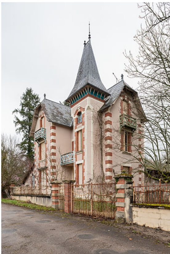
Façade principale, vue de trois-quarts depuis le sud-ouest.

58, Saint-Honoré-les-Bains, 2 allée de la Fresnaie