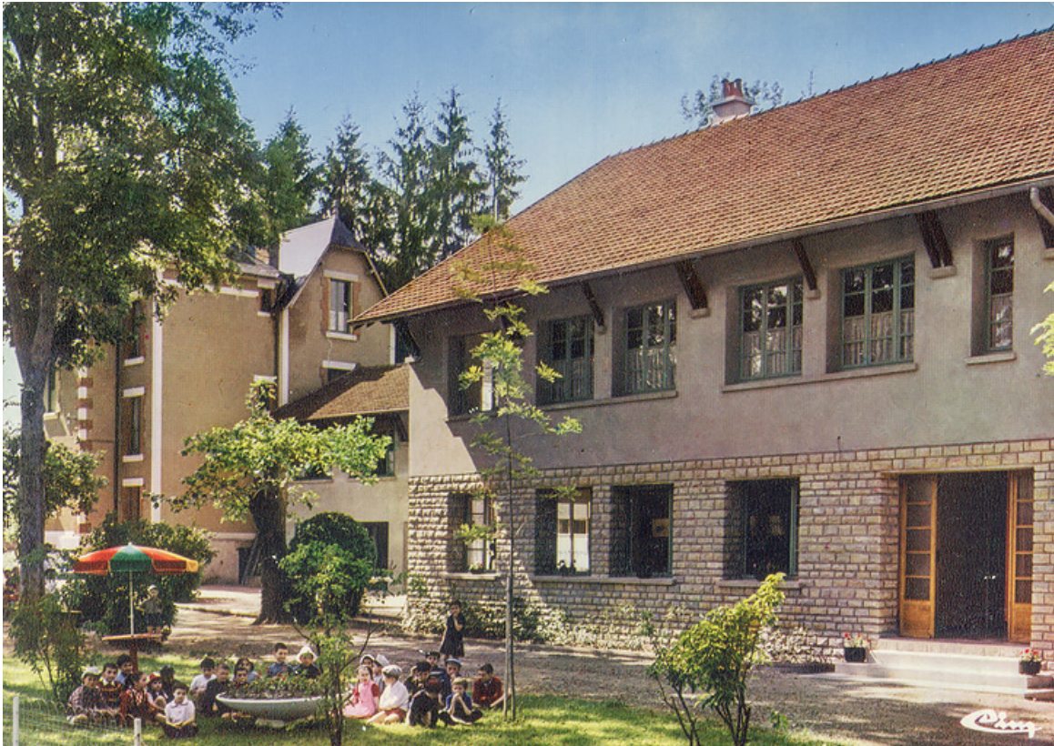
Façade de l'aile postérieure avec salle à manger ouverte sur le parc.

58, Saint-Honoré-les-Bains, 2 allée de la Fresnaie