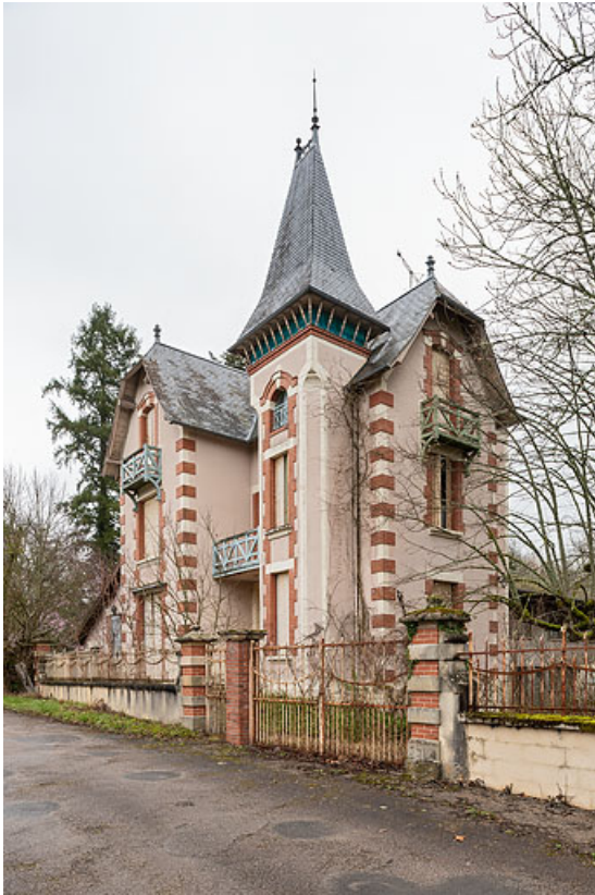
Façade principale, vue de trois-quarts depuis le sud-ouest.

58, Saint-Honoré-les-Bains, 2 allée de la Fresnaie