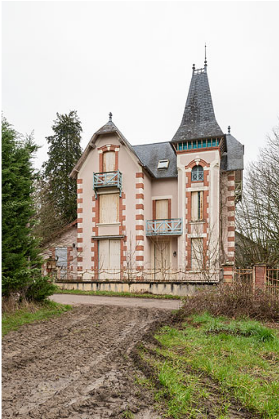
Façade principale, vue de face.

58, Saint-Honoré-les-Bains, 2 allée de la Fresnaie