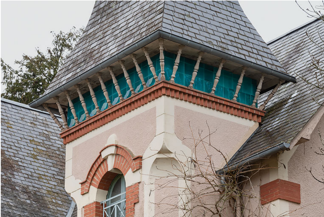
Tour demi-hors-œuvre, décor de céramique.

58, Saint-Honoré-les-Bains, 2 allée de la Fresnaie