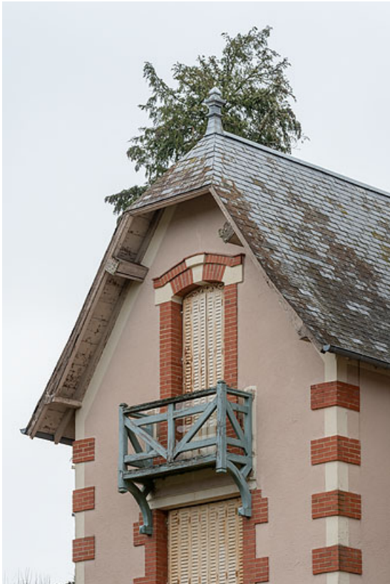
Mur-pignon en façade, demi-croupe en ardoise.

58, Saint-Honoré-les-Bains, 2 allée de la Fresnaie