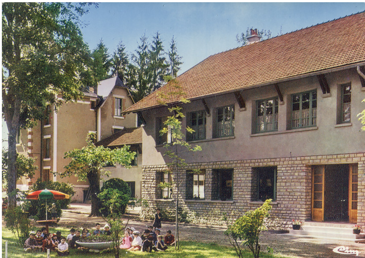
Façade de l'aile postérieure avec salle à manger ouverte sur le parc.

58, Saint-Honoré-les-Bains, 2 allée de la Fresnaie