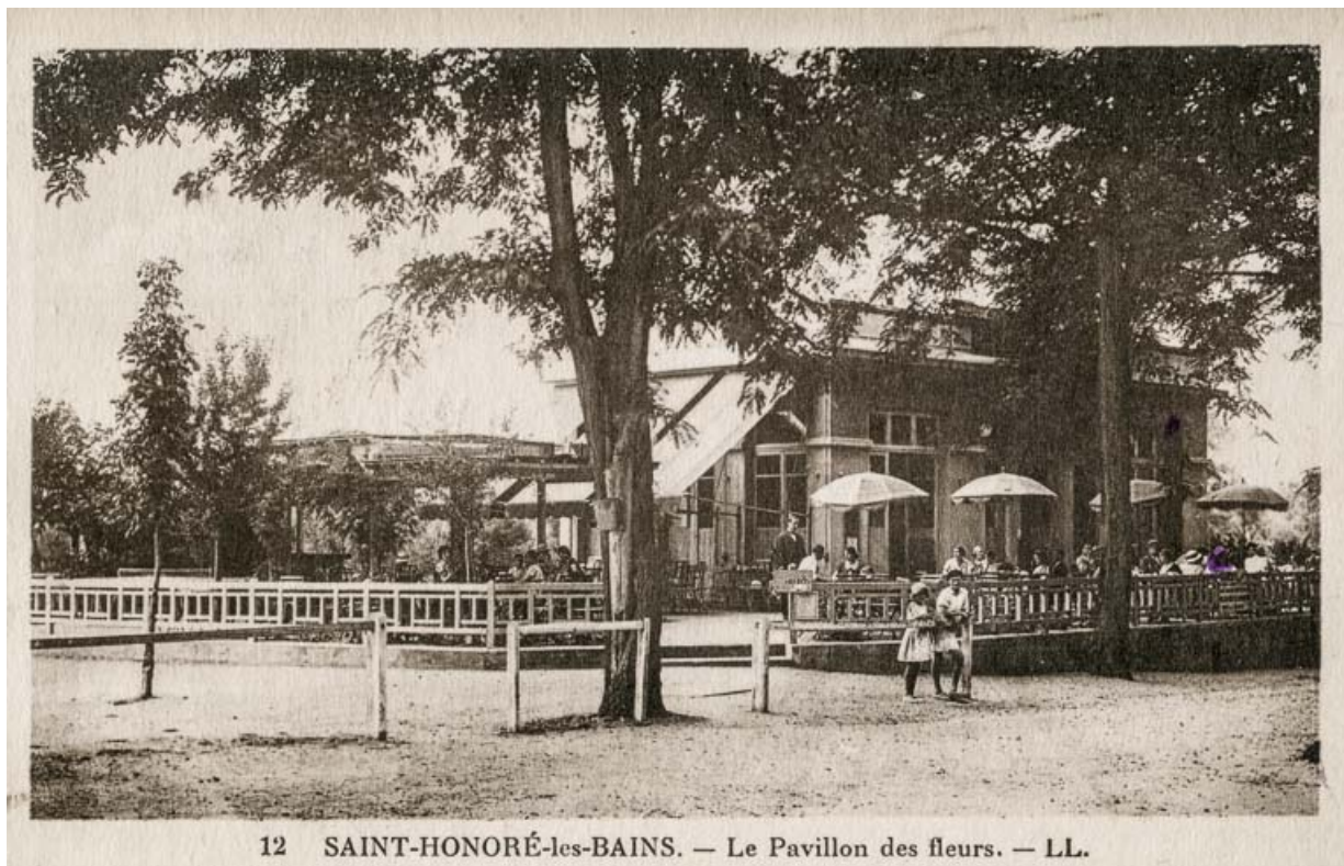
12 SAINT-HONORÉ-les-BAINS. — Le Pavillon des fleurs.

Pavillon des Fleurs avant son agrandissement.