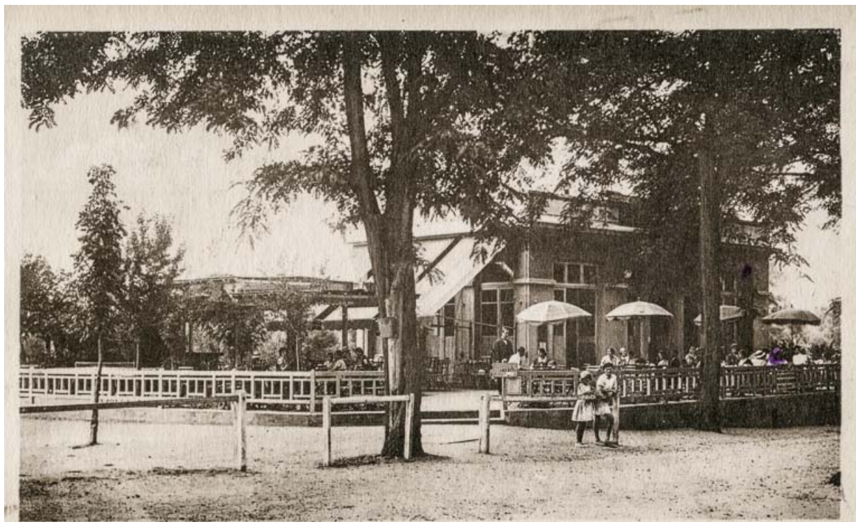
12 SAINT-HONORÉ-les-BAINS. — Le Pavillon des fleurs. — LL.

Pavillon des Fleurs avant son agrandissement. 58, Saint-Honoré-les-Bains rue du Docteur Segard