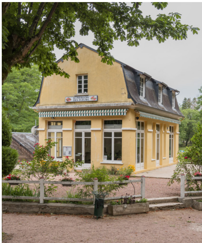
Pavillon des Fleurs après son agrandissement. 58, Saint-Honoré-les-Bains rue du Docteur Segard