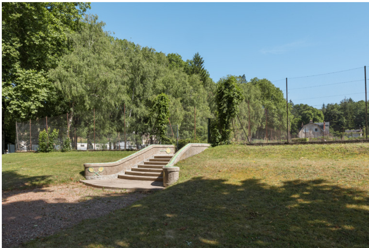
Vue des courts de tennis depuis le club-house. 58, Saint-Honoré-les-Bains rue du Docteur Segard