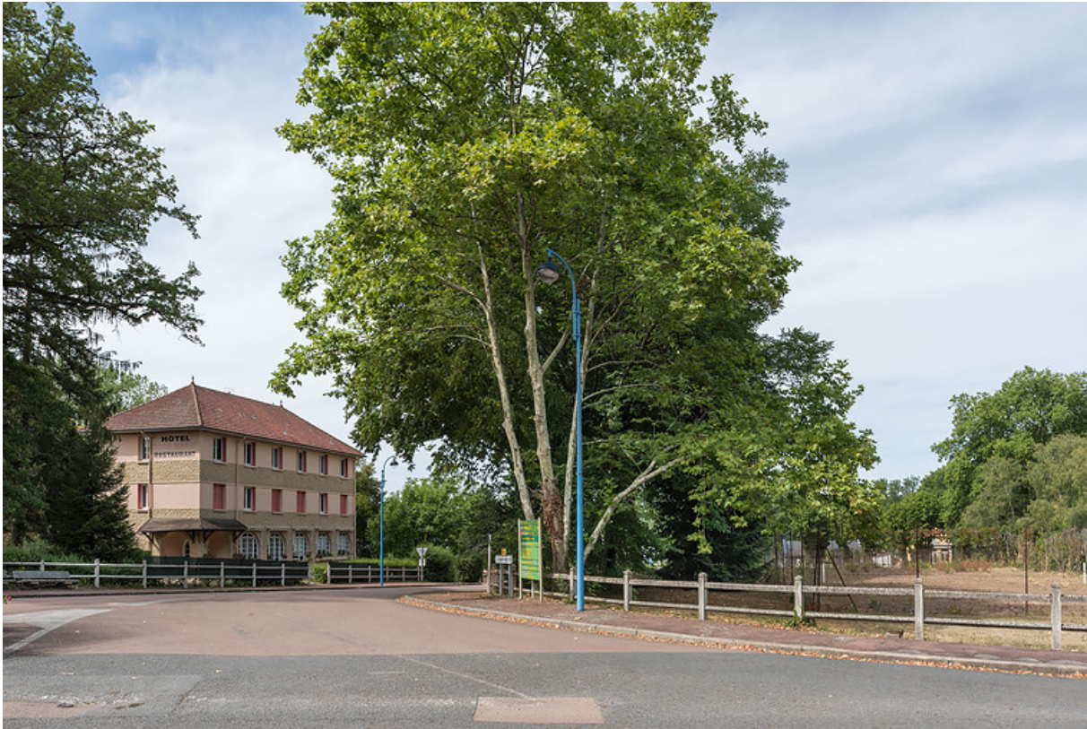
Situation des terrains au croisement de la rue Joseph Duriaux et de l'avenue du Docteur Segard. 58, Saint-Honoré-les-Bains rue du Docteur Segard