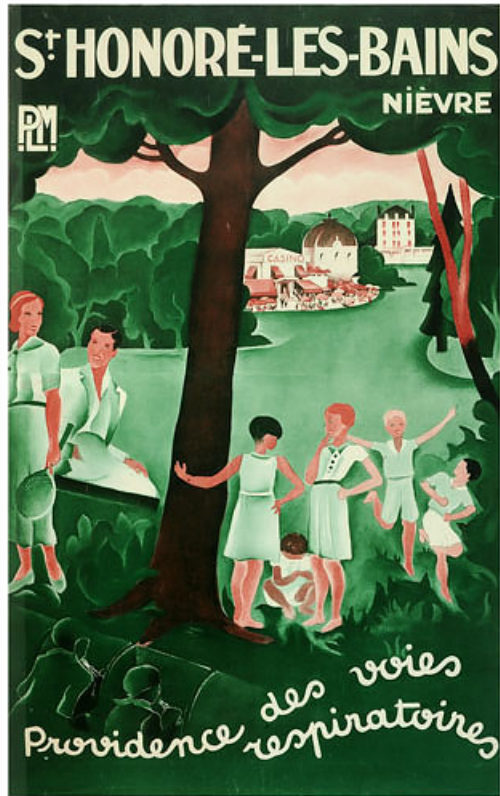
Affiche publicitaire de la Compagnie des chemins de fer de Paris à Lyon et à la Méditerranée (vers 1930). 58, Saint-Honoré-les-Bains rue du Docteur Segard