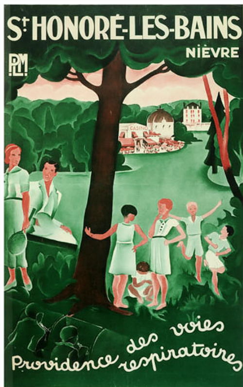
Affiche publicitaire de la Compagnie des chemins de fer de Paris à Lyon et à la Méditerranée (vers 1930). 58, Saint-Honoré-les-Bains rue du Docteur Segard