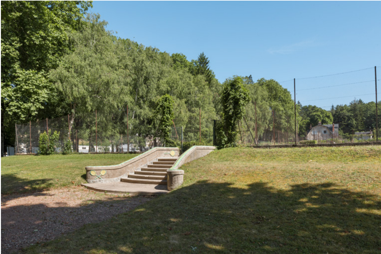
Vue des courts de tennis depuis le club-house. 58, Saint-Honoré-les-Bains rue du Docteur Segard