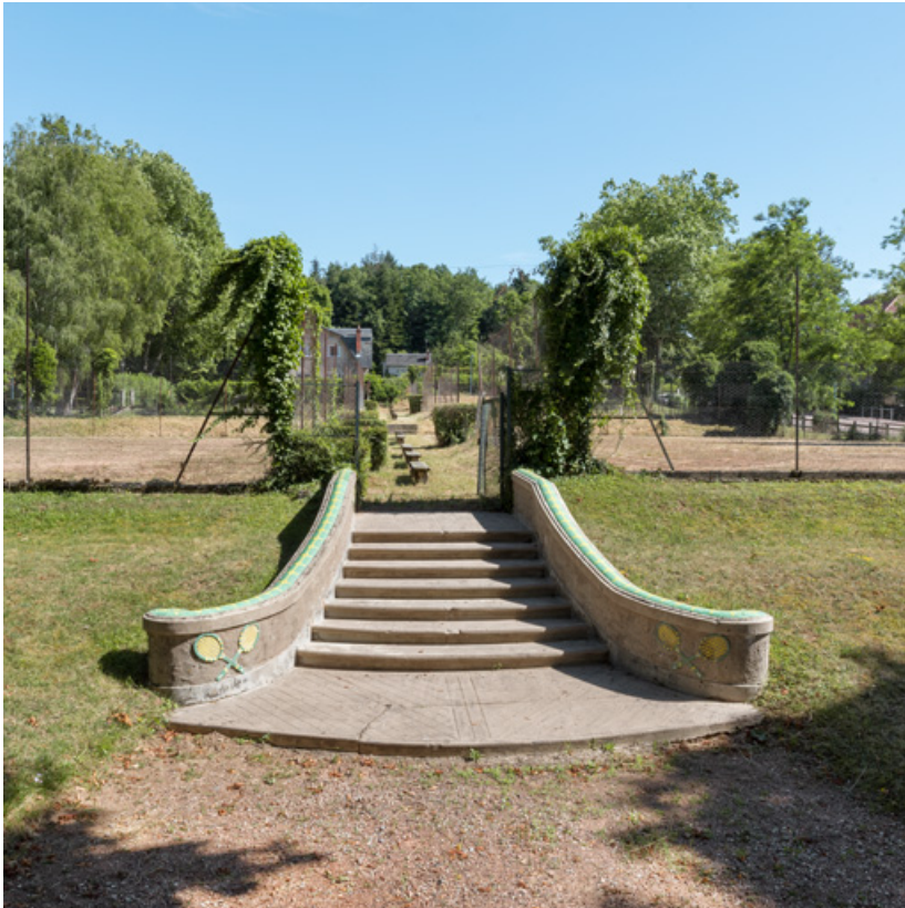
Escalier conduisant aux courts de tennis, vue de face.

58, Saint-Honoré-les-Bains rue du Docteur Segard