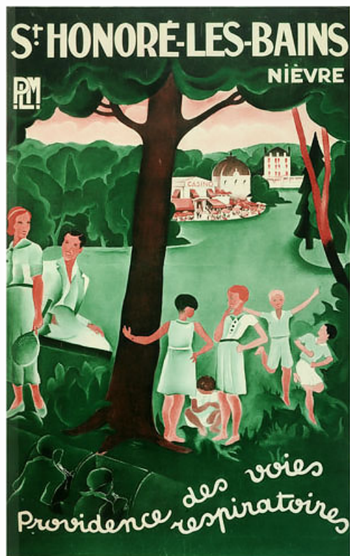
Affiche publicitaire de la Compagnie des chemins de fer de Paris à Lyon et à la Méditerranée (vers 1930). 58, Saint-Honoré-les-Bains rue du Docteur Segard