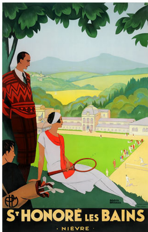
Affiche publicitaire de la Compagnie des chemins de fer de Paris à Lyon et à la Méditerranée (1928). 58, Vandenesse route départementale 3, lieudit : Chèvres