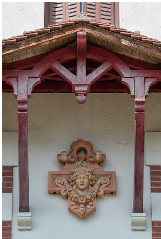
Auvent sur aisseliers abritant un masque féminin en terre cuite.

58, Saint-Honoré-les-Bains, 22 rue des Caves