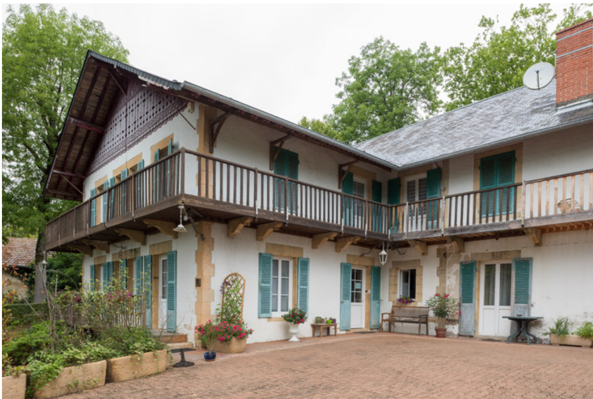
Vue depuis le sud-est avec l'aile en retour à droite.

58, Saint-Honoré-les-Bains, 12 avenue Jean Mermoz