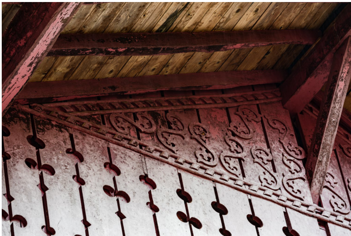
Placage de planches en bois ajourées et sculptées du pignon, détail de la partie gauche.

58, Saint-Honoré-les-Bains, 12 avenue Jean Mermoz