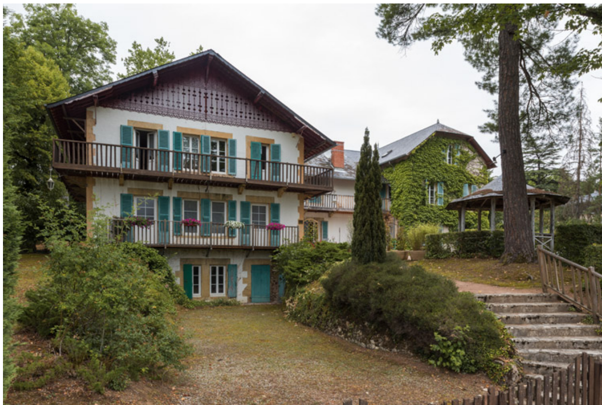
Vue depuis le sud-ouest avec l'aile en retour à droite.

58, Saint-Honoré-les-Bains, 12 avenue Jean Mermoz