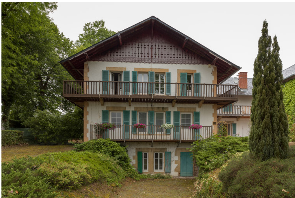
Façade du corps principal, vue de face.

58, Saint-Honoré-les-Bains, 12 avenue Jean Mermoz