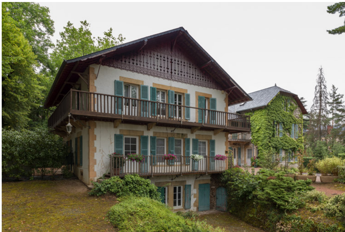
Façade du corps principal, vue de trois-quarts.

58, Saint-Honoré-les-Bains, 12 avenue Jean Mermoz