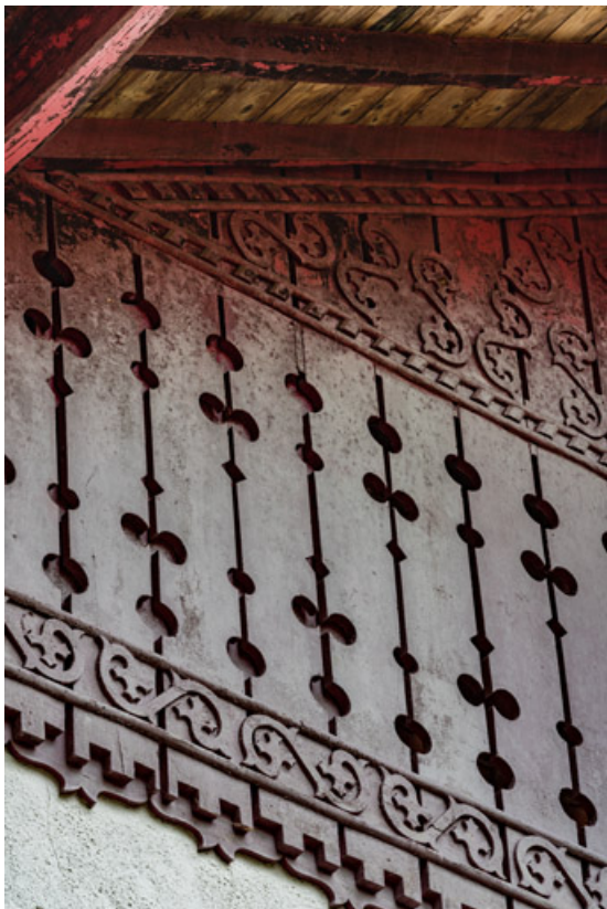
Placage de planches en bois ajourées et sculptées du pignon sous la saillie de rive.

58, Saint-Honoré-les-Bains, 12 avenue Jean Mermoz