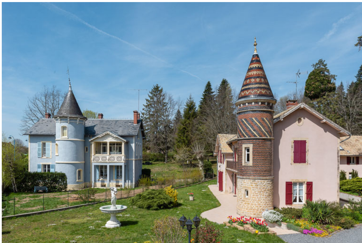
Vue d'ensemble du Pavillon Blanc (à gauche) et du Pavillon Rose (à droite).

58, Saint-Honoré-les-Bains, 26 avenue Jean Mermoz