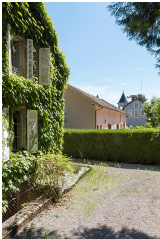
Vue d'ensemble de la Villa Les Lierres (premier plan), du Pavillon Rose et du Pavillon Blanc. 58, Saint-Honoré-les-Bains, 26 avenue Jean Mermoz