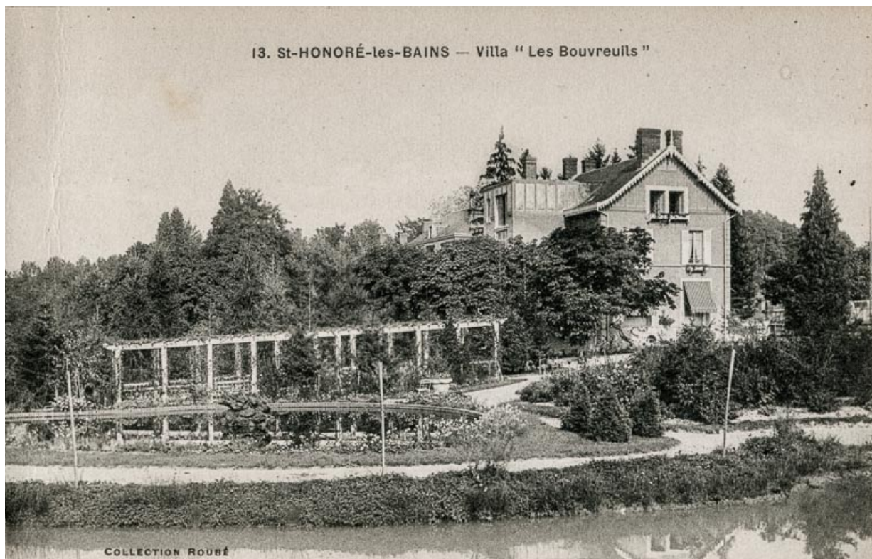
Vue du jardin et de la villa depuis le sud-ouest.

58, Saint-Honoré-les-Bains, 8 avenue de Rémilly