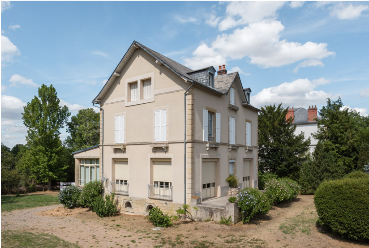
Vue depuis le sud.

58, Saint-Honoré-les-Bains, 8 avenue de Rémyilly