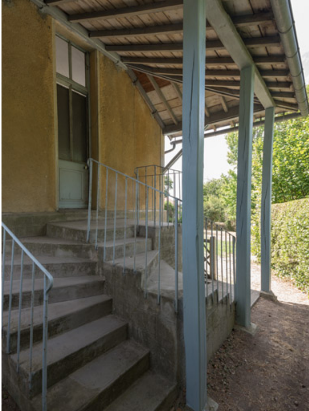
Entrée latérale, côté nord.

58, Saint-Honoré-les-Bains, 8 avenue de Rémilly