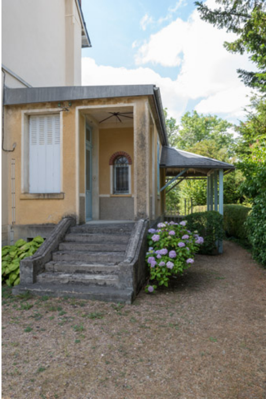
Entrée latérale, côté nord.

58, Saint-Honoré-les-Bains, 8 avenue de Rémilly