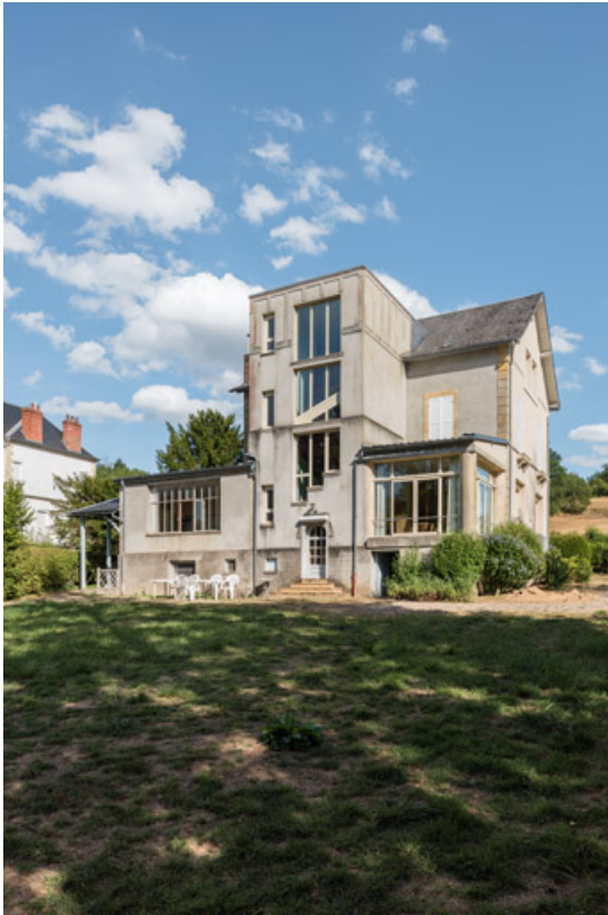
Vue depuis l'ouest.

58, Saint-Honoré-les-Bains, 8 avenue de Rémillly