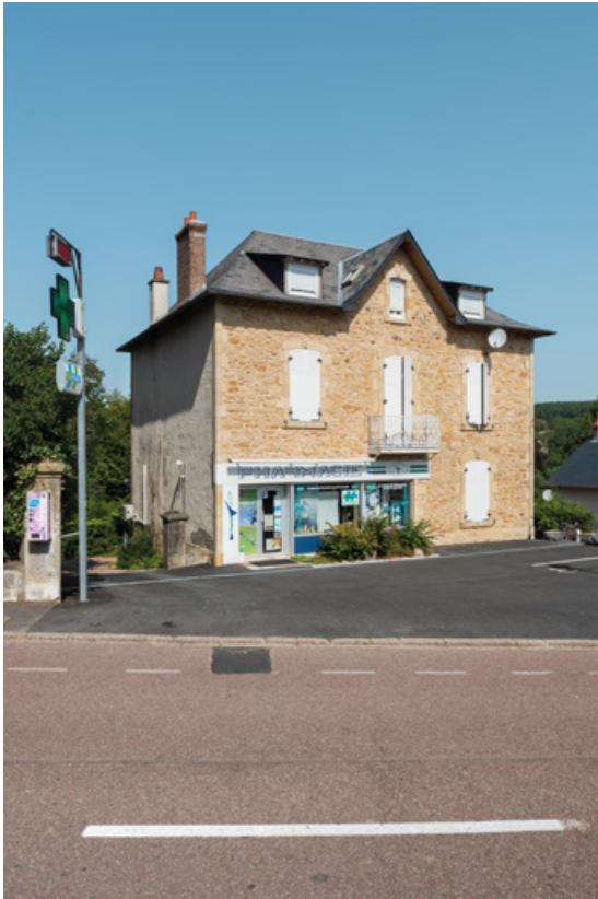
Façade de la villa après sa transformation.

58, Saint-Honoré-les-Bains, 49 avenue du Général d'Espeuilles