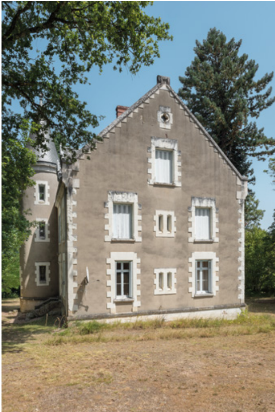
Mur pignon sud-ouest.

58, Saint-Honoré-les-Bains, 27 avenue Eugène Collin