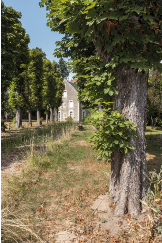
Allée conduisant à la villa depuis l'allée des Garennes.

58, Saint-Honoré-les-Bains, 27 avenue Eugène Collin