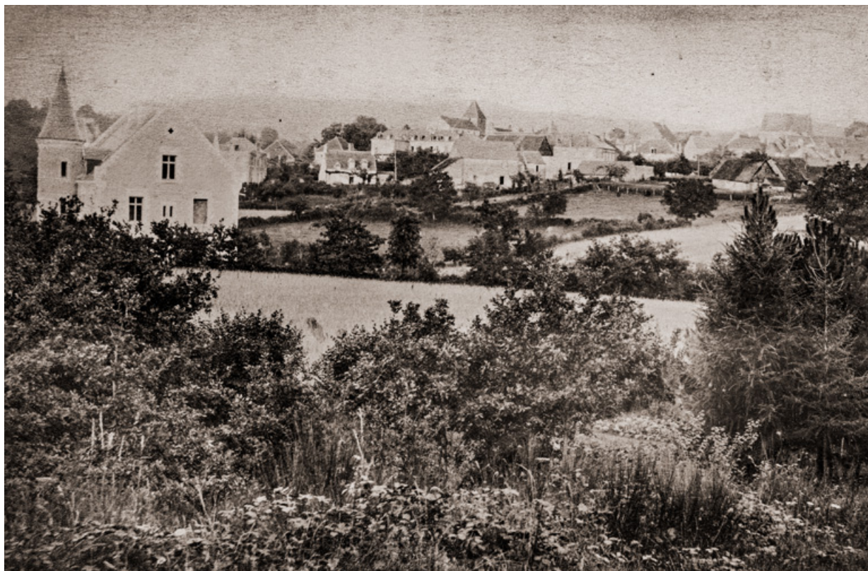
Vue de la villa en 1883.

58, Saint-Honoré-les-Bains, 27 avenue Eugène Collin