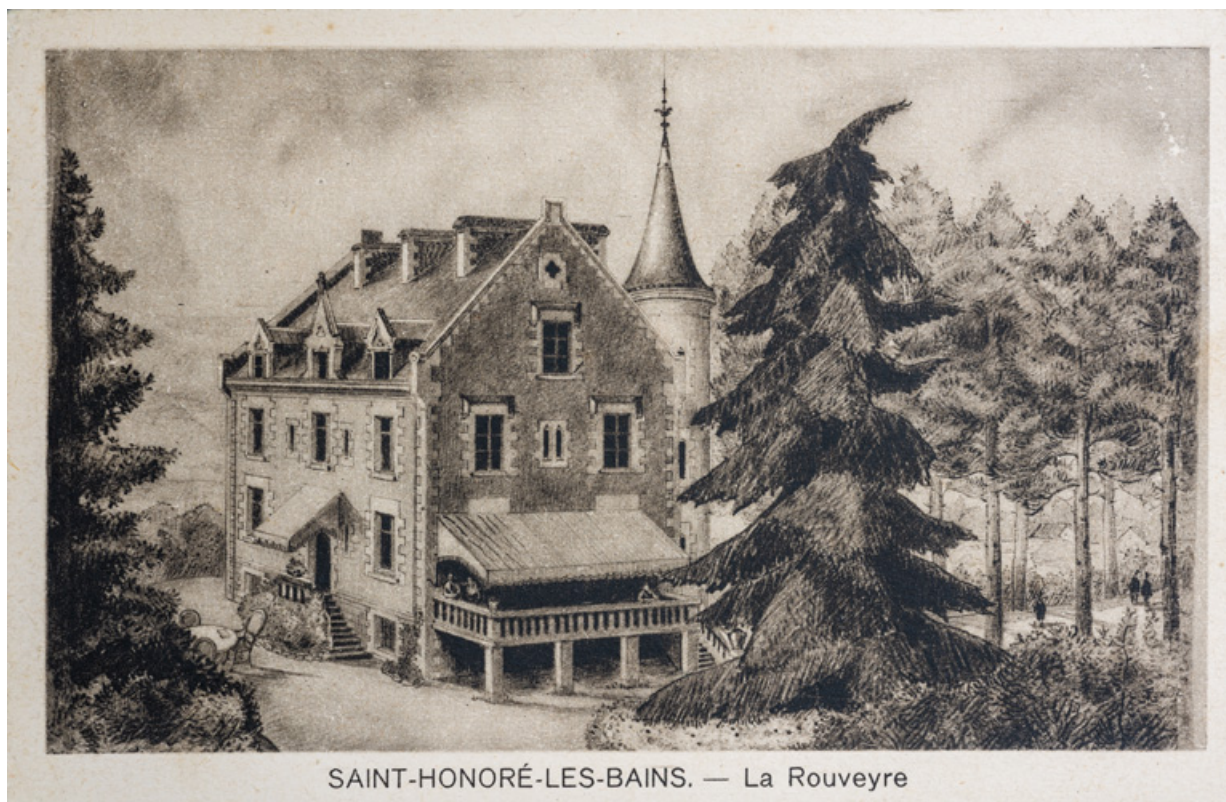
SAINT-HONORÉ-LES-BAINS. — La Rouveyre

Vue de la villa dans la première moitié du 20e siècle.