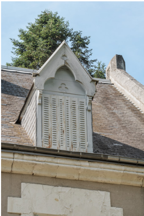
Lucarne de droite du versant sud-est de la toiture.

58, Saint-Honoré-les-Bains, 27 avenue Eugène Collin