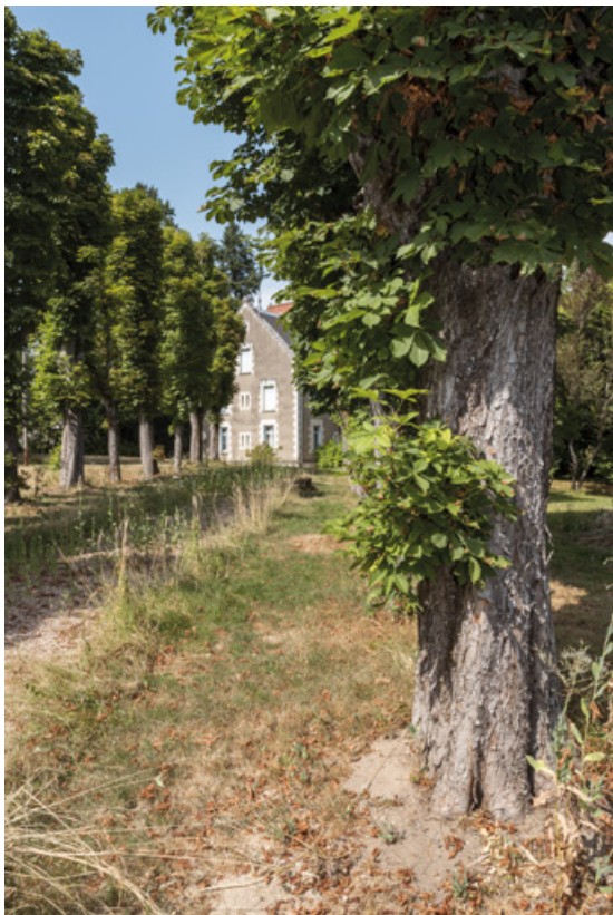
Allée conduisant à la villa depuis l'allée des Garennes.

58, Saint-Honoré-les-Bains, 27 avenue Eugène Collin