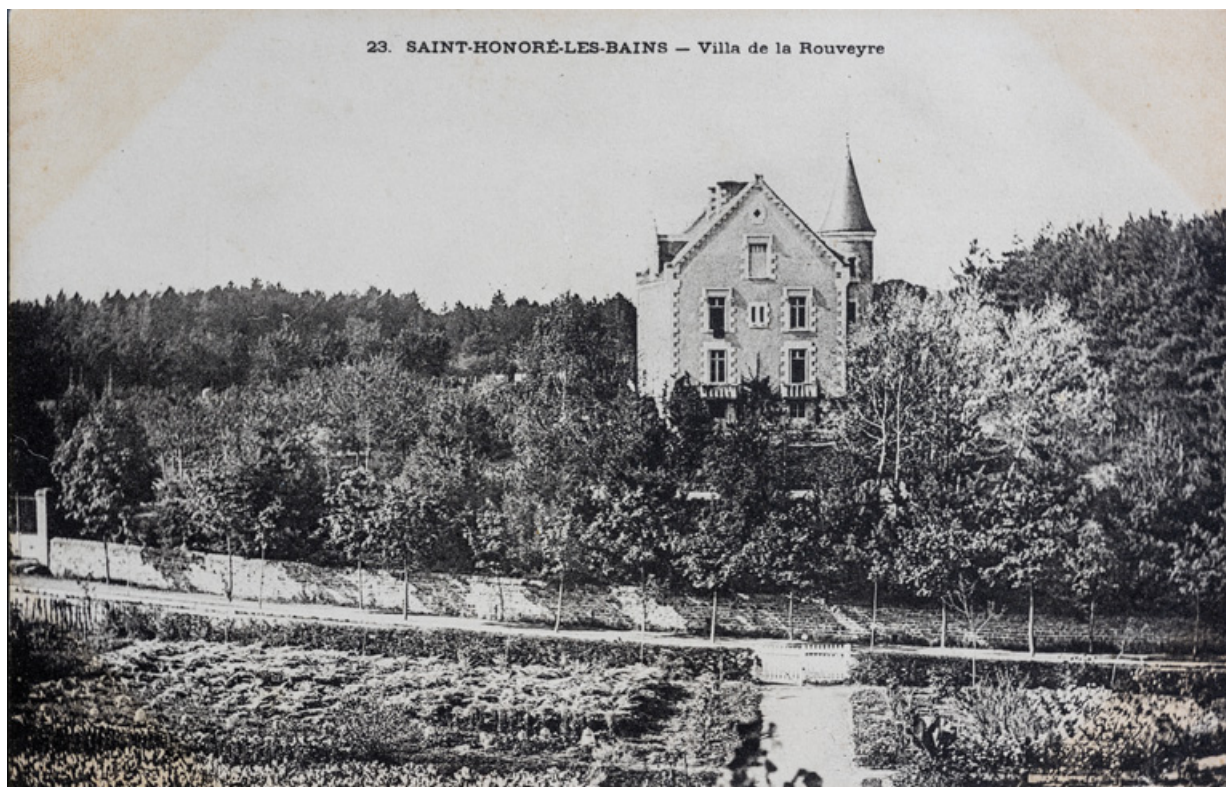
Vue de la villa dans la première moitié du 20e siècle.

58, Saint-Honoré-les-Bains, 27 avenue Eugène Collin