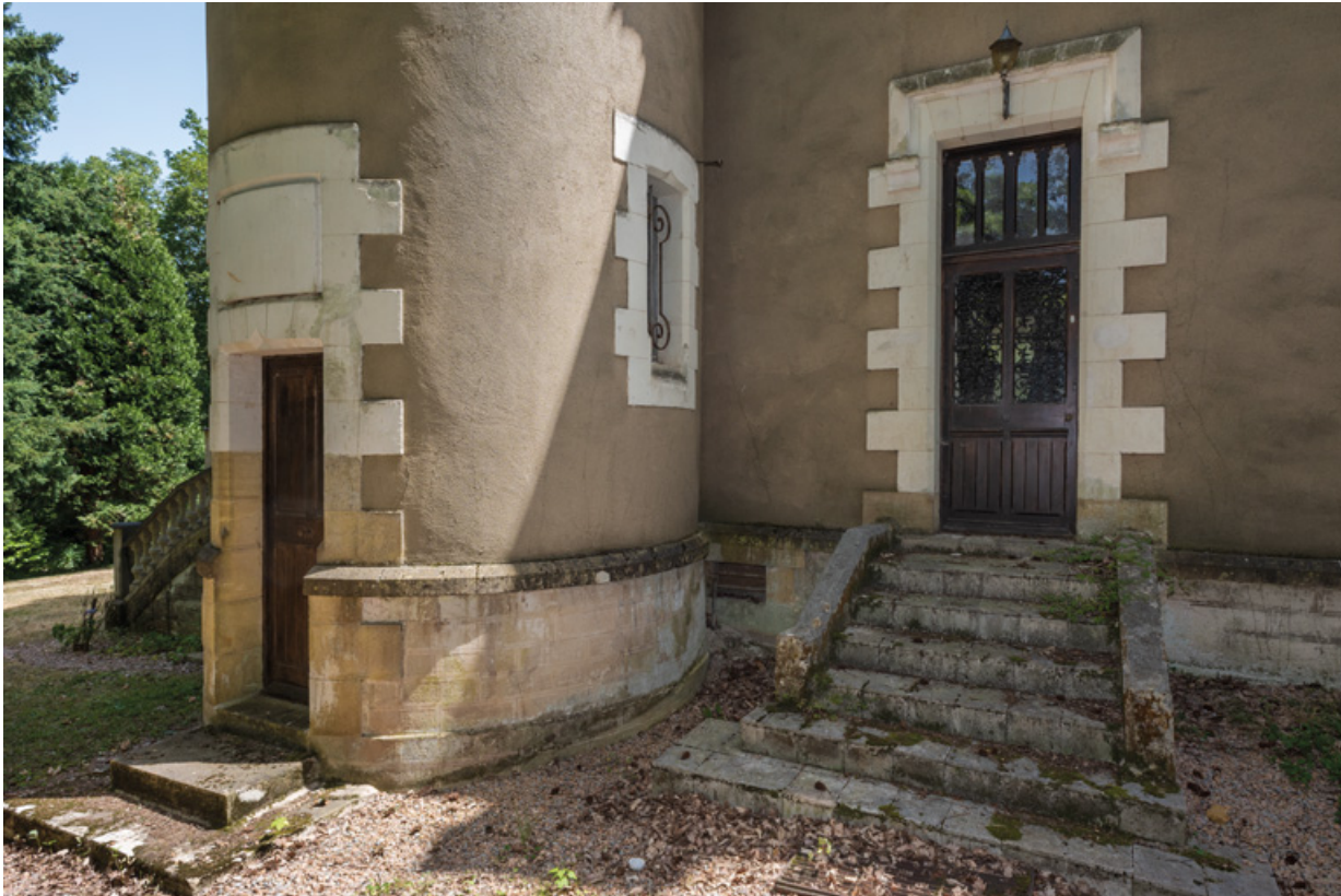
Perron de la façade nord-ouest et tour.

58, Saint-Honoré-les-Bains, 27 avenue Eugène Collin