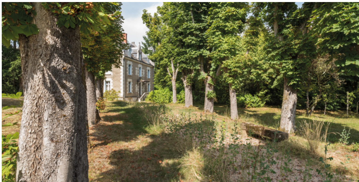
Allée conduisant à la villa depuis l'allée des Garennes.

58, Saint-Honoré-les-Bains, 27 avenue Eugène Collin