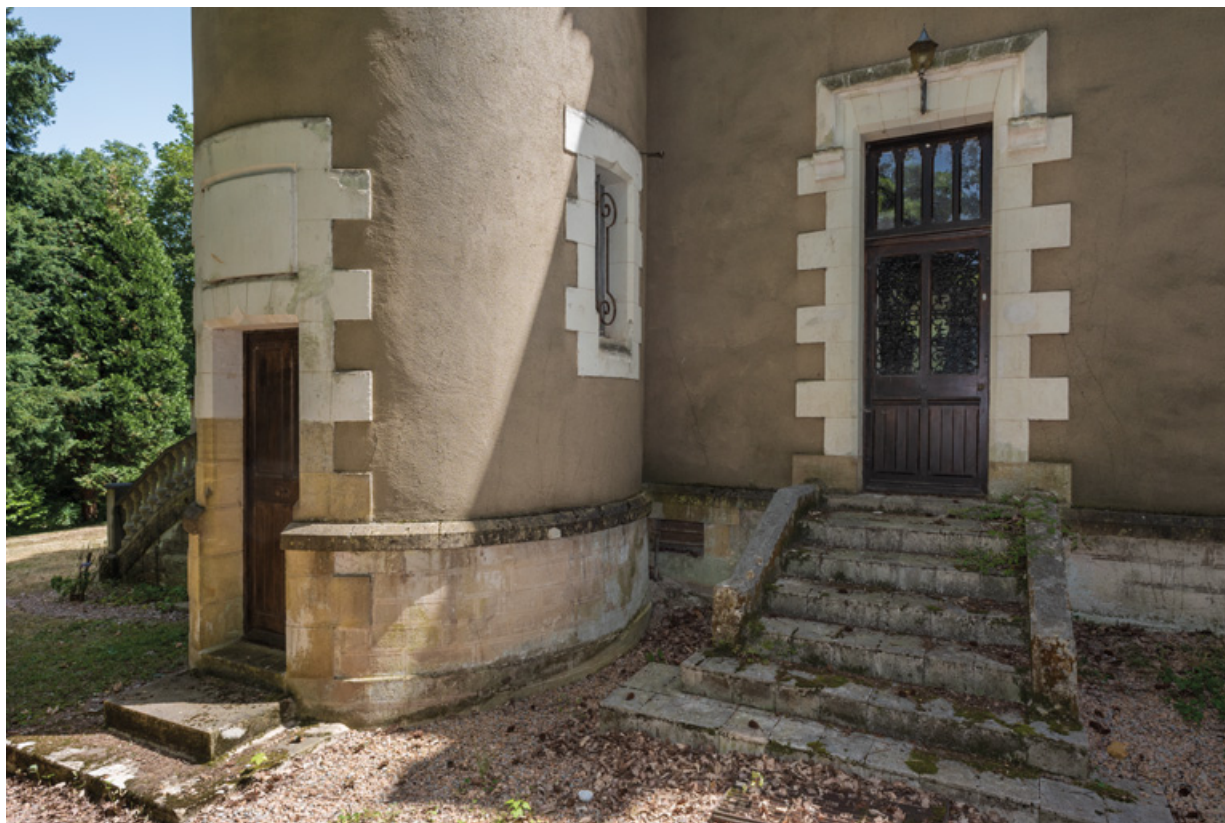
Perron de la façade nord-ouest et tour.

58, Saint-Honoré-les-Bains, 27 avenue Eugène Collin