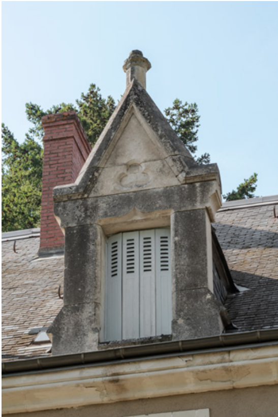
Lucarne centrale du versant sud-est de la toiture. 58, Saint-Honoré-les-Bains, 27 avenue Eugène Collin