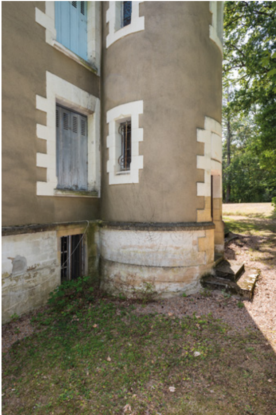
Partie inférieure de la tour d'escalier.

58, Saint-Honoré-les-Bains, 27 avenue Eugène Collin