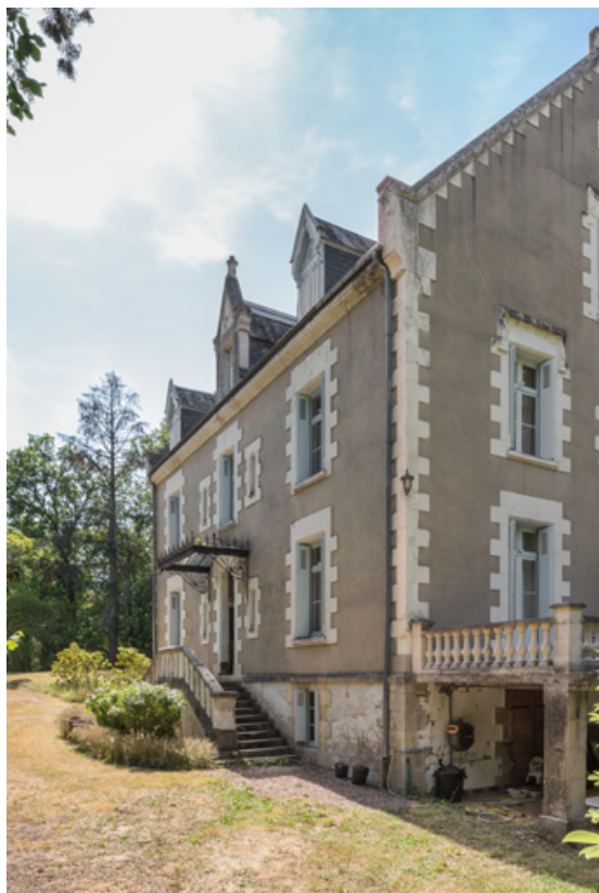
Façade sud-est, vue depuis l'est.

58, Saint-Honoré-les-Bains, 27 avenue Eugène Collin