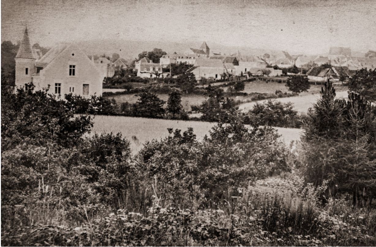
Vue de la villa en 1883.

58, Saint-Honoré-les-Bains, 27 avenue Eugène Collin