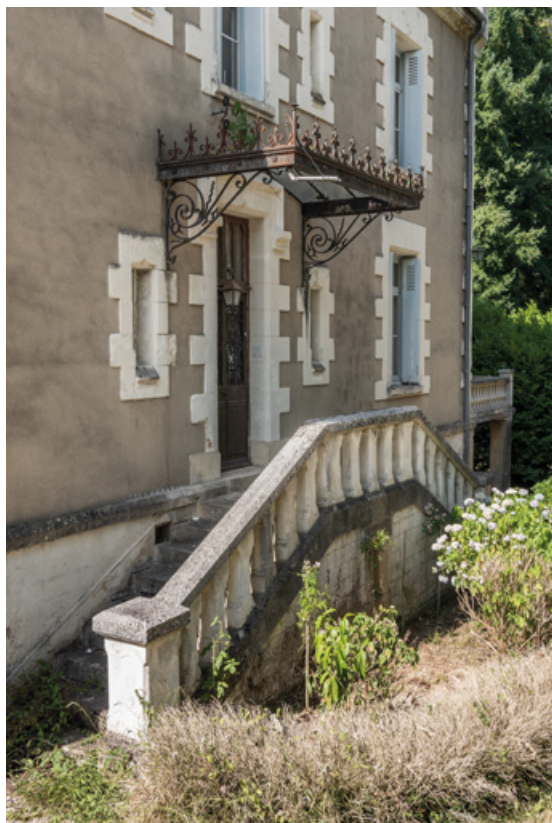
Perron de la façade sud-est.

58, Saint-Honoré-les-Bains, 27 avenue Eugène Collin