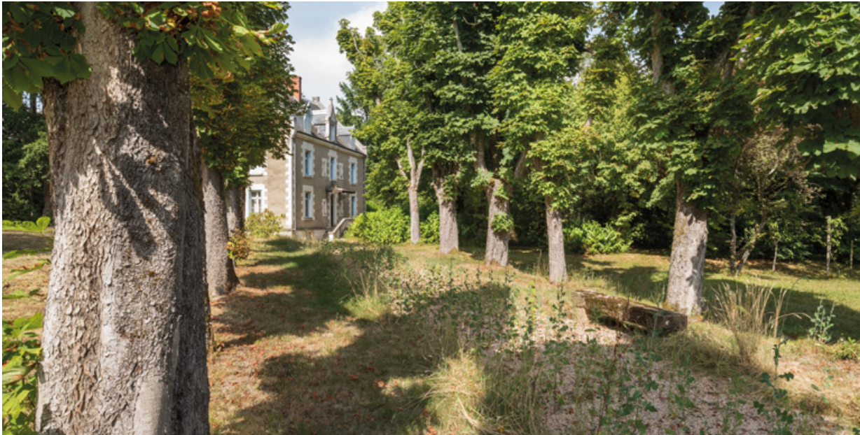
Allée conduisant à la villa depuis l'allée des Garennes.

58, Saint-Honoré-les-Bains, 27 avenue Eugène Collin