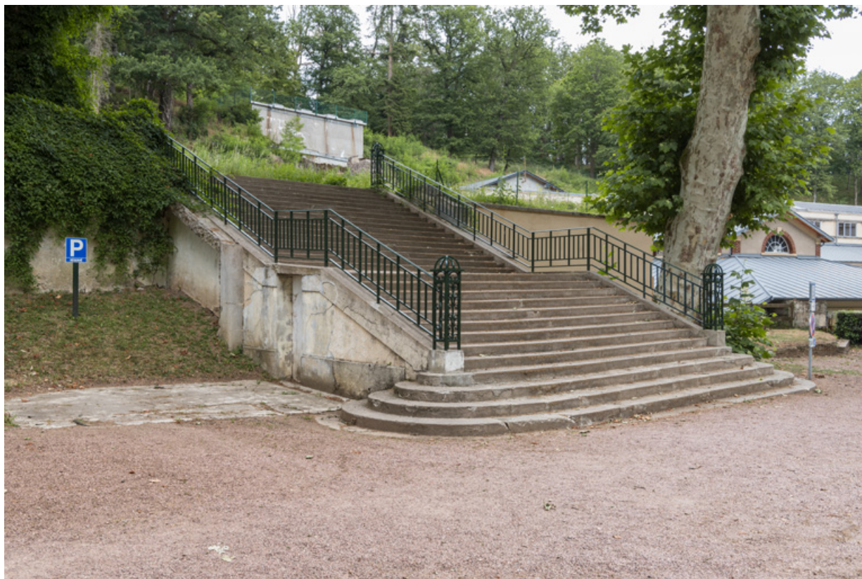
Escalier d'accès depuis le parc, vue depuis le nord-ouest.

58, Saint-Honoré-les-Bains rue du Docteur Segard