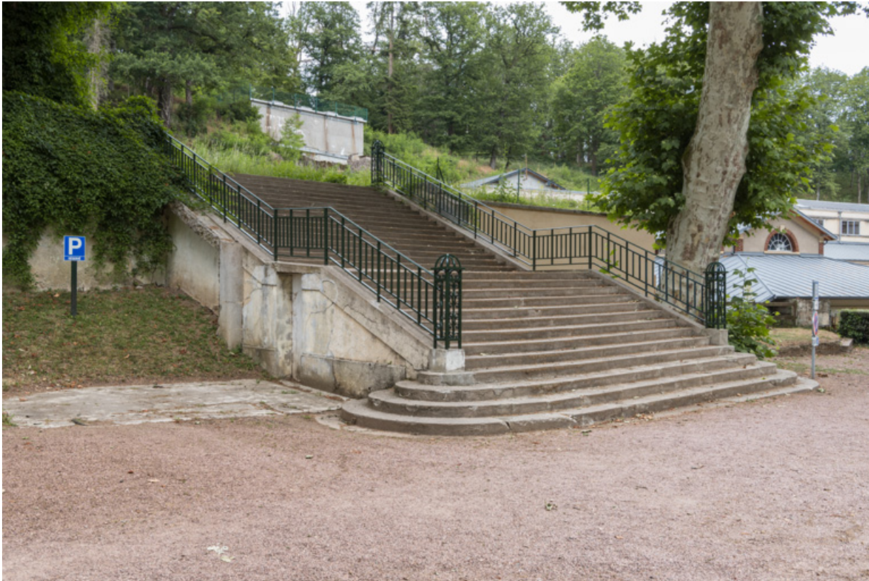
Escalier d'accès depuis le parc, vue depuis le nord-ouest.

58, Saint-Honoré-les-Bains rue du Docteur Segard