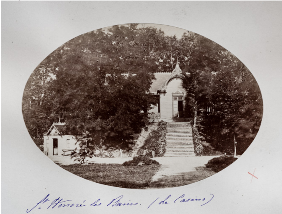
Casino et théâtre, façade principale, vue depuis l'ouest. 58, Saint-Honoré-les-Bains rue du Docteur Segard