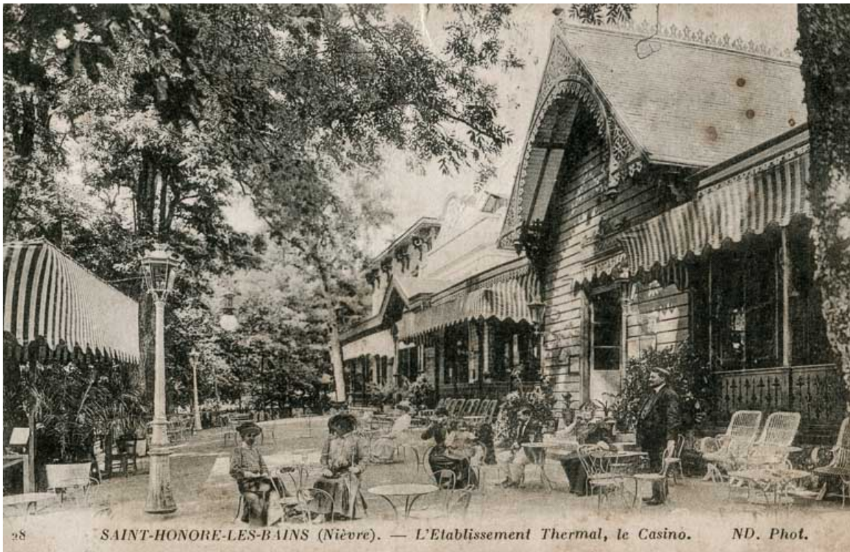
Casino et théâtre, façade principale, vue depuis le sud-ouest.

58, Saint-Honoré-les-Bains rue du Docteur Segard