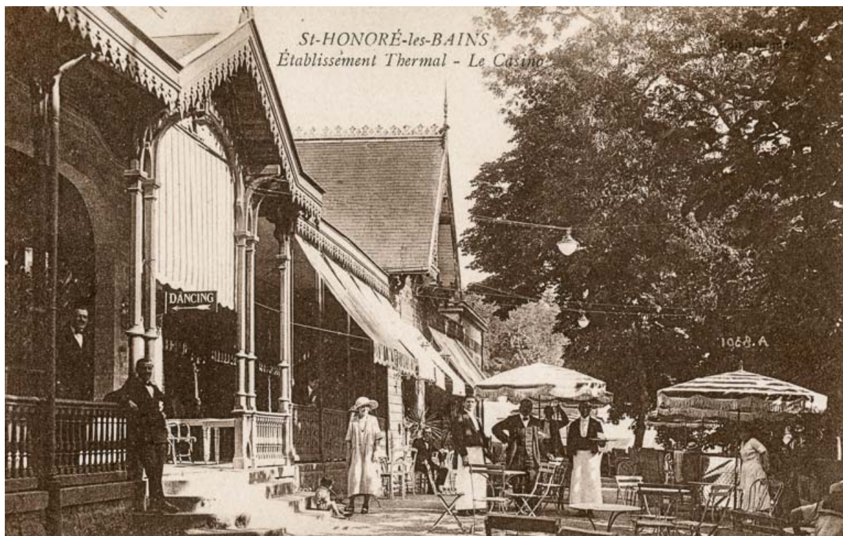
Casino et théâtre, façade principale, vue depuis le nord-ouest.

58, Saint-Honoré-les-Bains rue du Docteur Segard