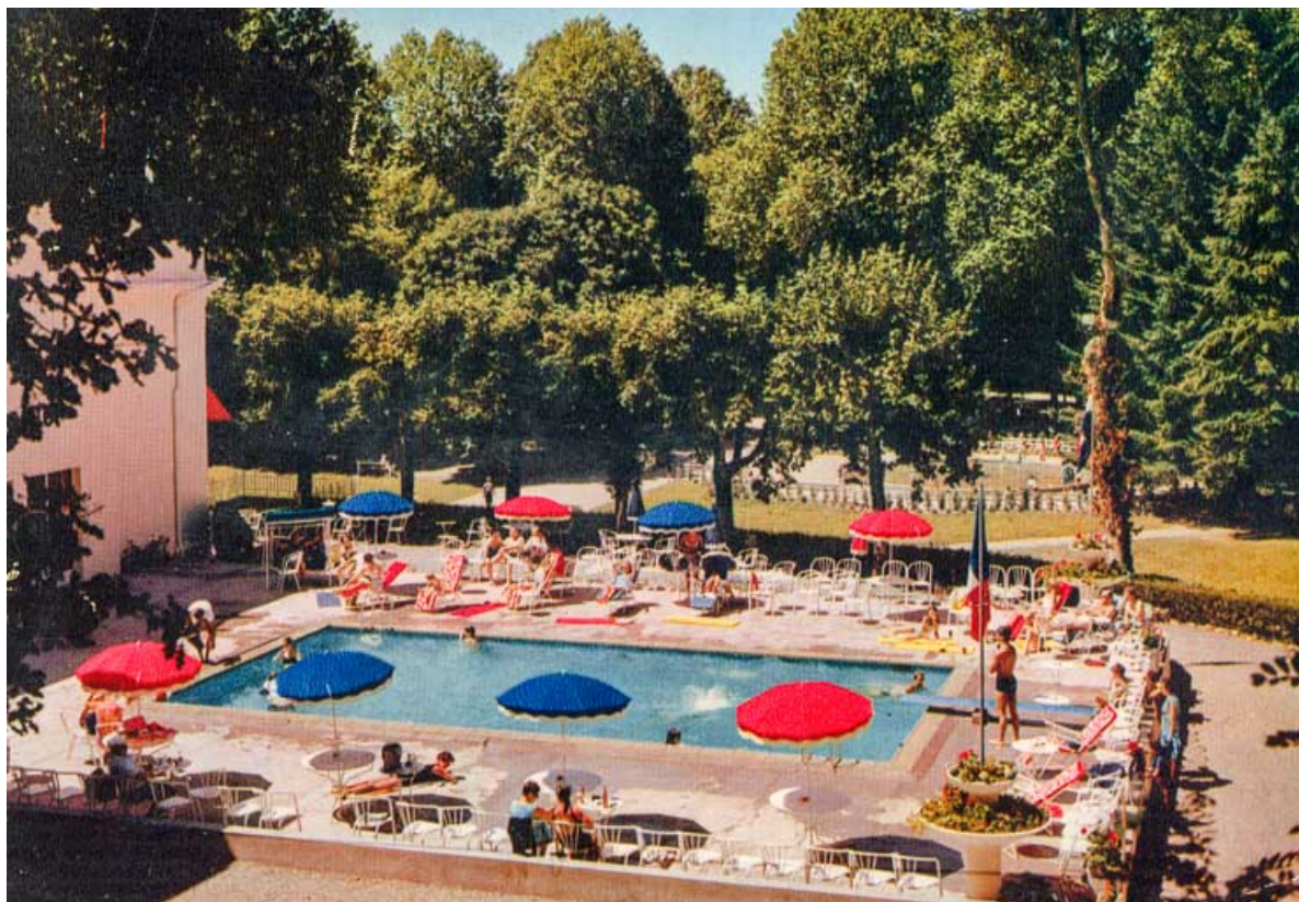
Piscine du casino, vue depuis les Garennes. 58, Saint-Honoré-les-Bains rue du Docteur Segard