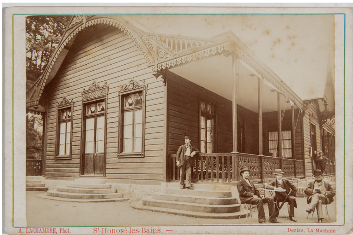
Casino et théâtre, mur pignon nord et terrasse couverte. 58, Saint-Honoré-les-Bains rue du Docteur Segard