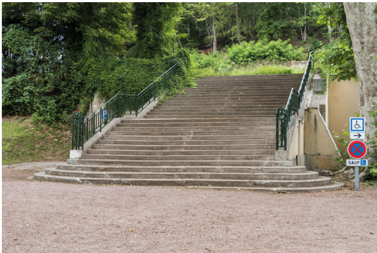
Escalier d'accès depuis le parc, vue de l'ouest. 58, Saint-Honoré-les-Bains rue du Docteur Segard