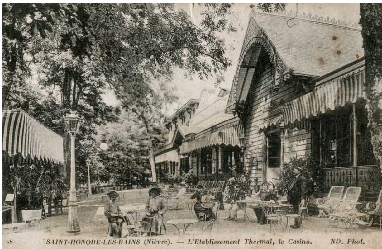
Casino et théâtre, façade principale, vue depuis le sud-ouest.

58, Saint-Honoré-les-Bains rue du Docteur Segard