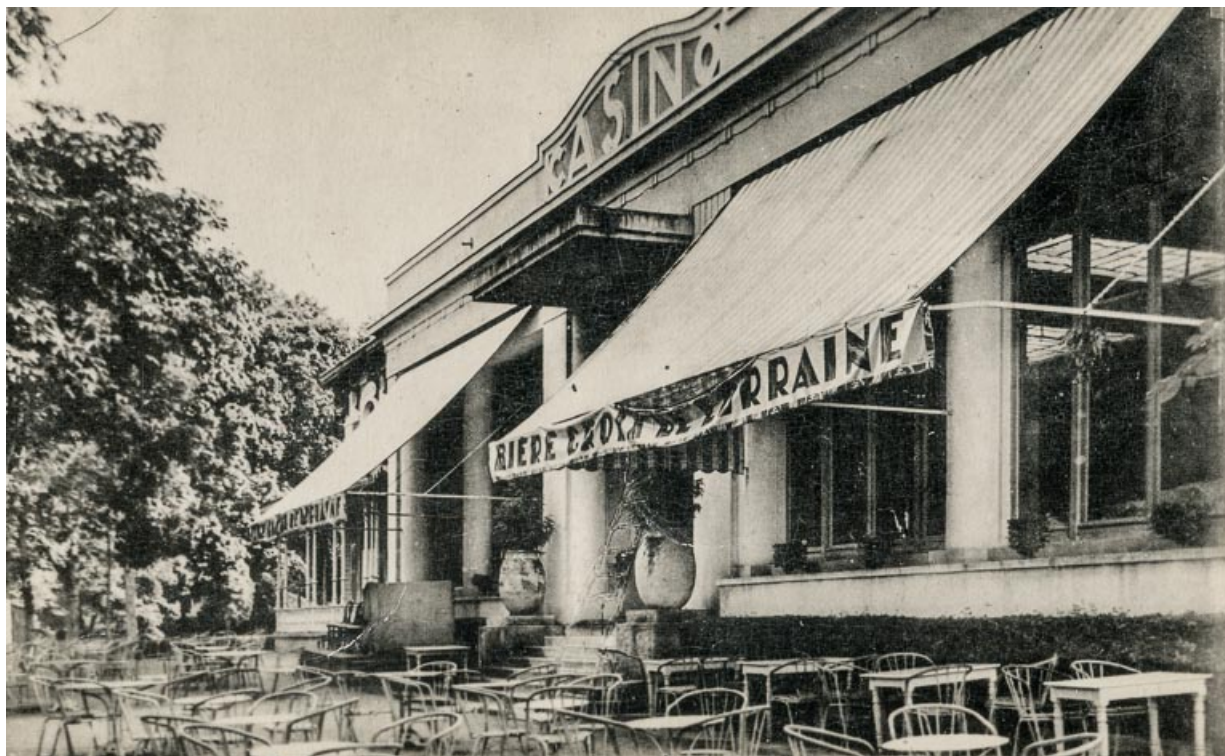
Casino et théâtre, façade principale, vue depuis le sud-ouest. 58, Saint-Honoré-les-Bains rue du Docteur Segard