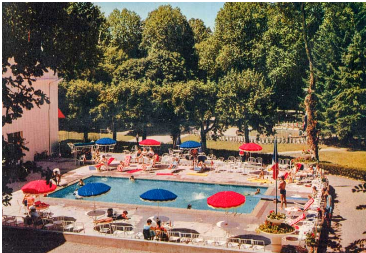
Piscine du casino, vue depuis les Garennes. 58, Saint-Honoré-les-Bains rue du Docteur Segard