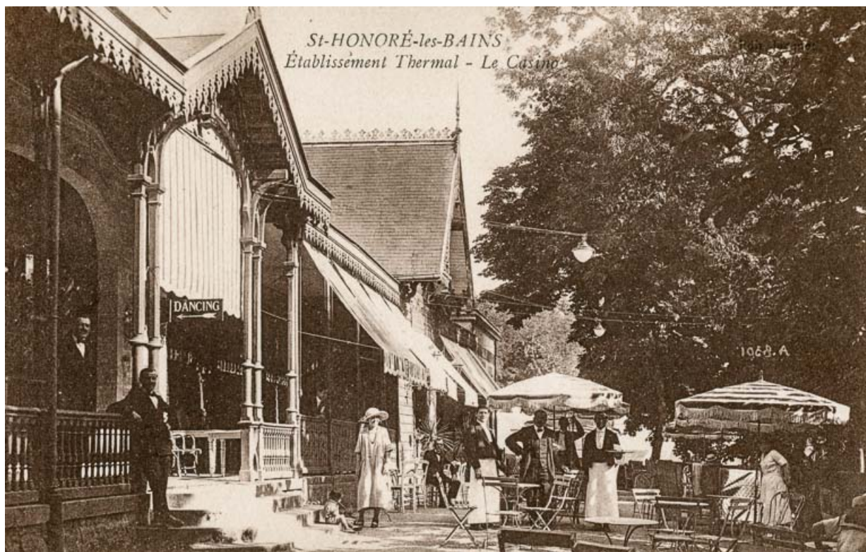
Casino et théâtre, façade principale, vue depuis le nord-ouest.

58, Saint-Honoré-les-Bains rue du Docteur Segard