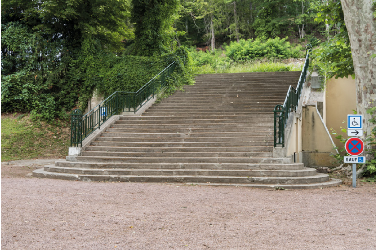
Escalier d'accès depuis le parc, vue de l'ouest. 58, Saint-Honoré-les-Bains rue du Docteur Segard