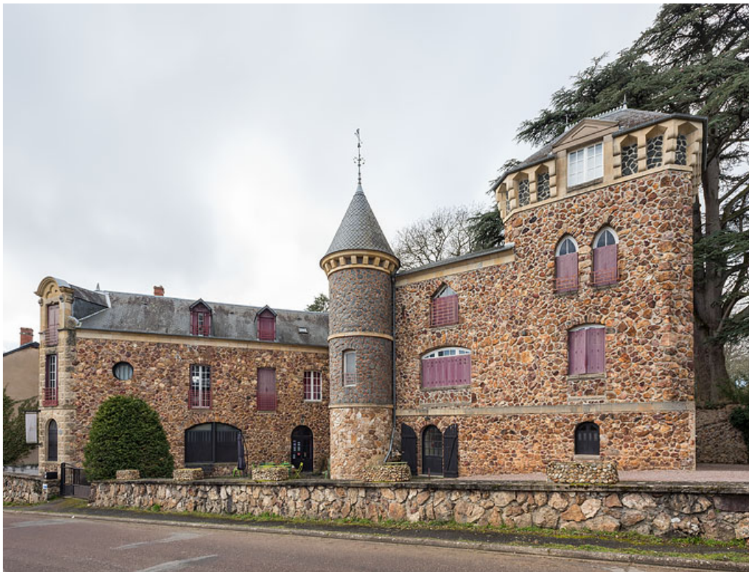
Façade sur la rue de L'Hâte.

58, Saint-Honoré-les-Bains, 40 rue de l' Hâte