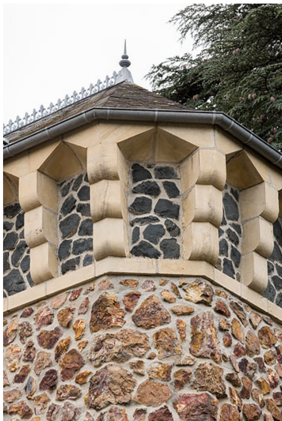
Détail de la tour de plan rectangulaire.

58, Saint-Honoré-les-Bains, 40 rue de l' Hâte