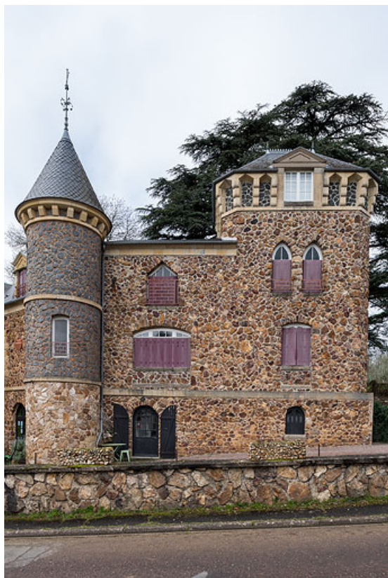
Tour de plan circulaire et tour de plan rectangulaire.

58, Saint-Honoré-les-Bains, 40 rue de l' Hâte