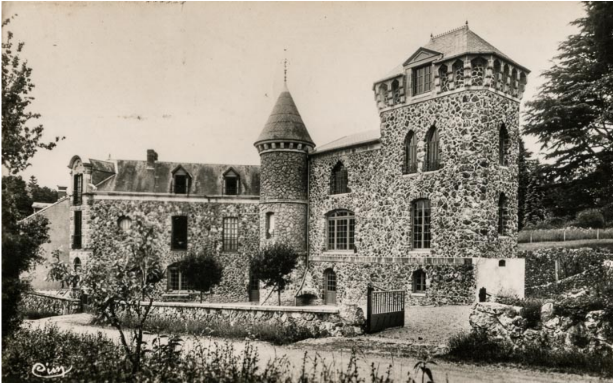
Façade sur la rue de L'Hâte dans les années 1950.

58, Saint-Honoré-les-Bains, 40 rue de l' Hâte