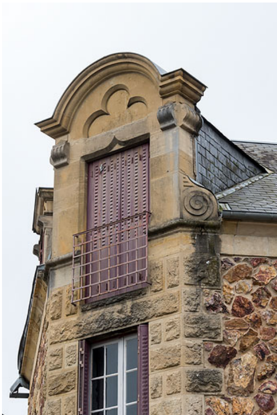
Lucarne en pierre.

58, Saint-Honoré-les-Bains, 40 rue de l' Hâte