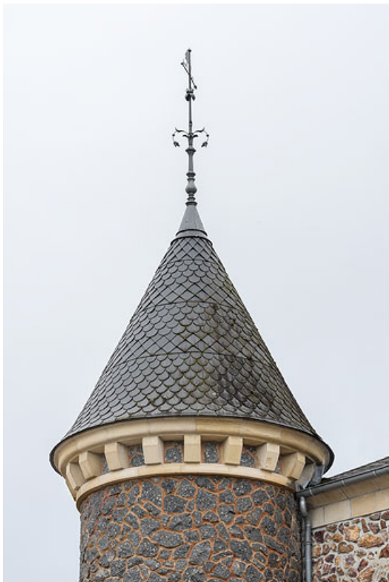
Toiture de la tour de plan circulaire.

58, Saint-Honoré-les-Bains, 40 rue de l' Hâte