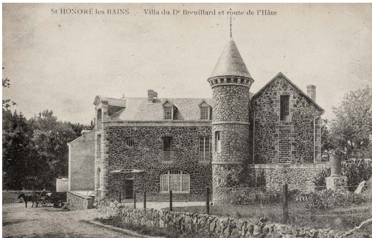
Façade sur la rue de L'Hâte dans les années 1900.

58, Saint-Honoré-les-Bains, 40 rue de l' Hâte