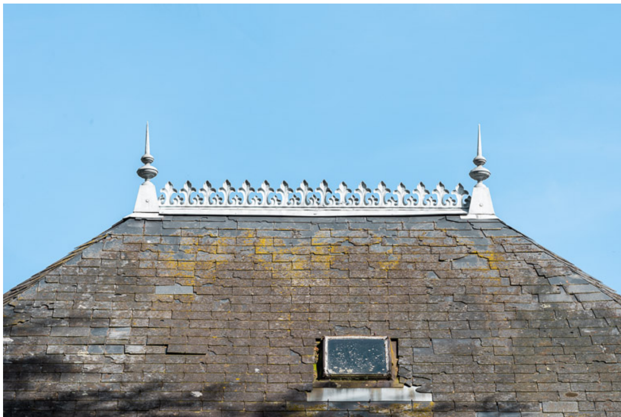
Crête de la toiture de la tour de plan rectangulaire, vue depuis l'ouest.

58, Saint-Honoré-les-Bains, 40 rue de l' Hâte