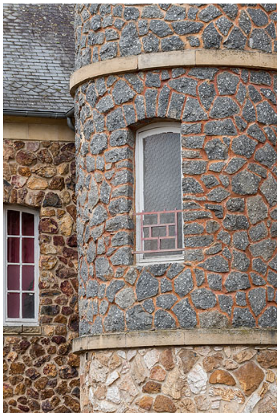
Détail de la tour de plan circulaire.

58, Saint-Honoré-les-Bains, 40 rue de l' Hâte