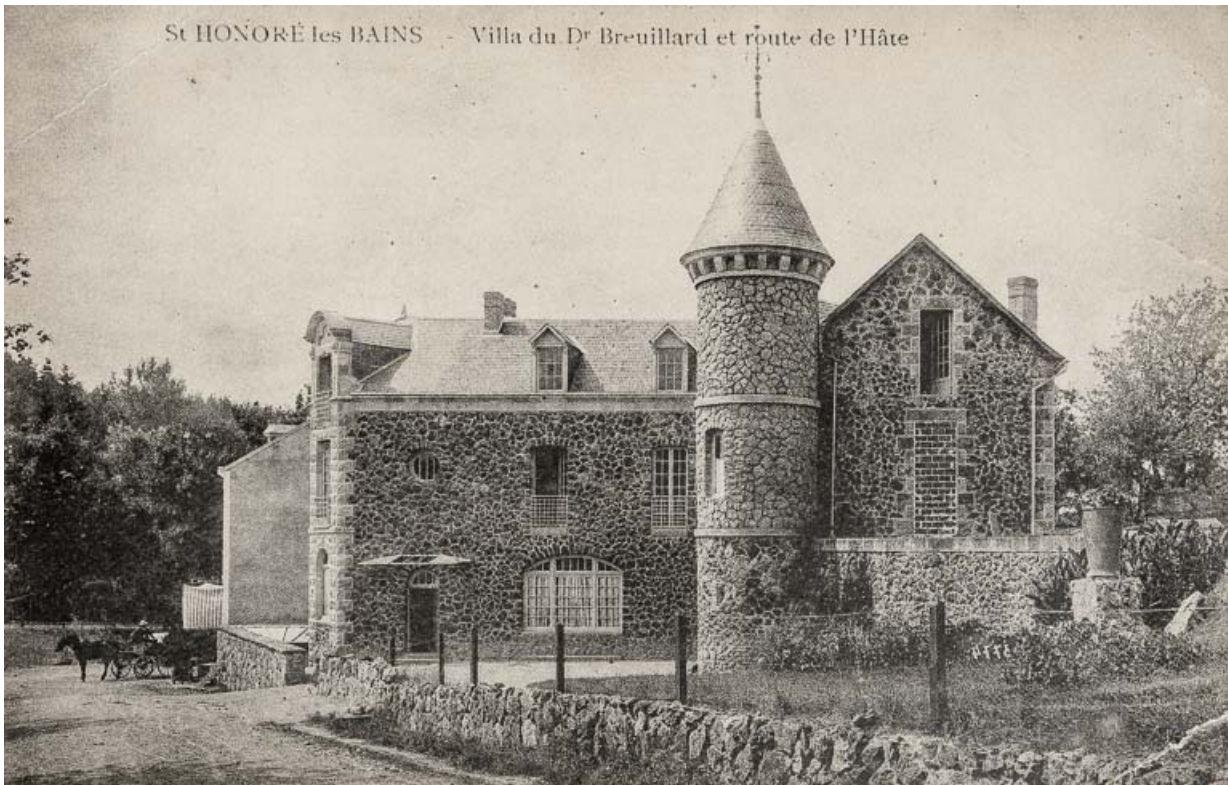
Façade sur la rue de L'Hâte dans les années 1900.

58, Saint-Honoré-les-Bains, 40 rue de l' Hâte