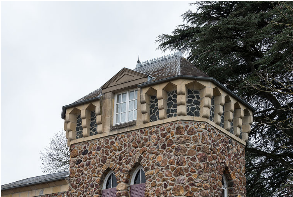
Détail de la tour de plan rectangulaire.

58, Saint-Honoré-les-Bains, 40 rue de l' Hâte