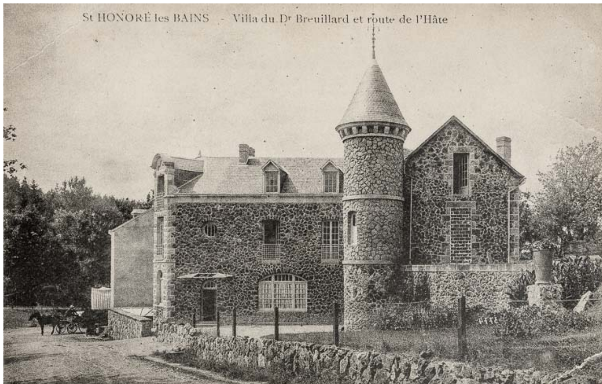
Façade sur la rue de L'Hâte dans les années 1900.

58, Saint-Honoré-les-Bains, 40 rue de l' Hâte