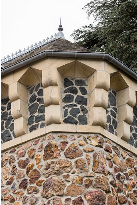
Détail de la tour de plan rectangulaire.

58, Saint-Honoré-les-Bains, 40 rue de l' Hâte