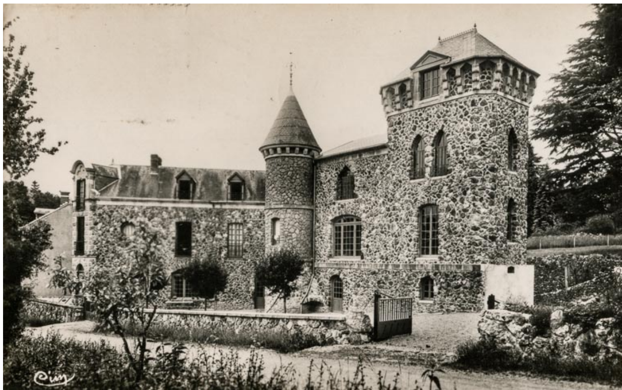
Façade sur la rue de L'Hâte dans les années 1950.

58, Saint-Honoré-les-Bains, 40 rue de l' Hâte