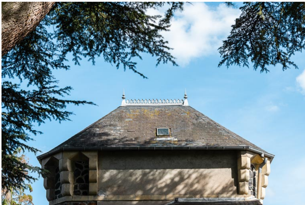
Toiture de la tour de plan rectangulaire, vue depuis l'ouest.

58, Saint-Honoré-les-Bains, 40 rue de l' Hâte