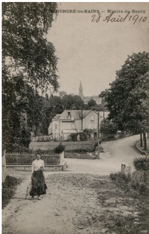
Vue depuis l'ouest au début du 20e siècle.

58, Saint-Honoré-les-Bains, 4 avenue Jean Mermoz