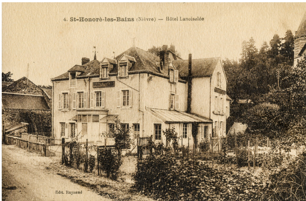
Vue depuis le nord-ouest au début du 20e siècle. 58, Saint-Honoré-les-Bains, 4 avenue Jean Mermoz