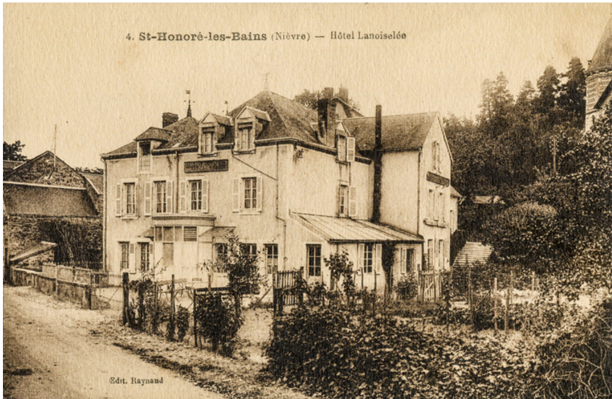
Vue depuis le nord-ouest au début du 20e siècle. 58, Saint-Honoré-les-Bains, 4 avenue Jean Mermoz