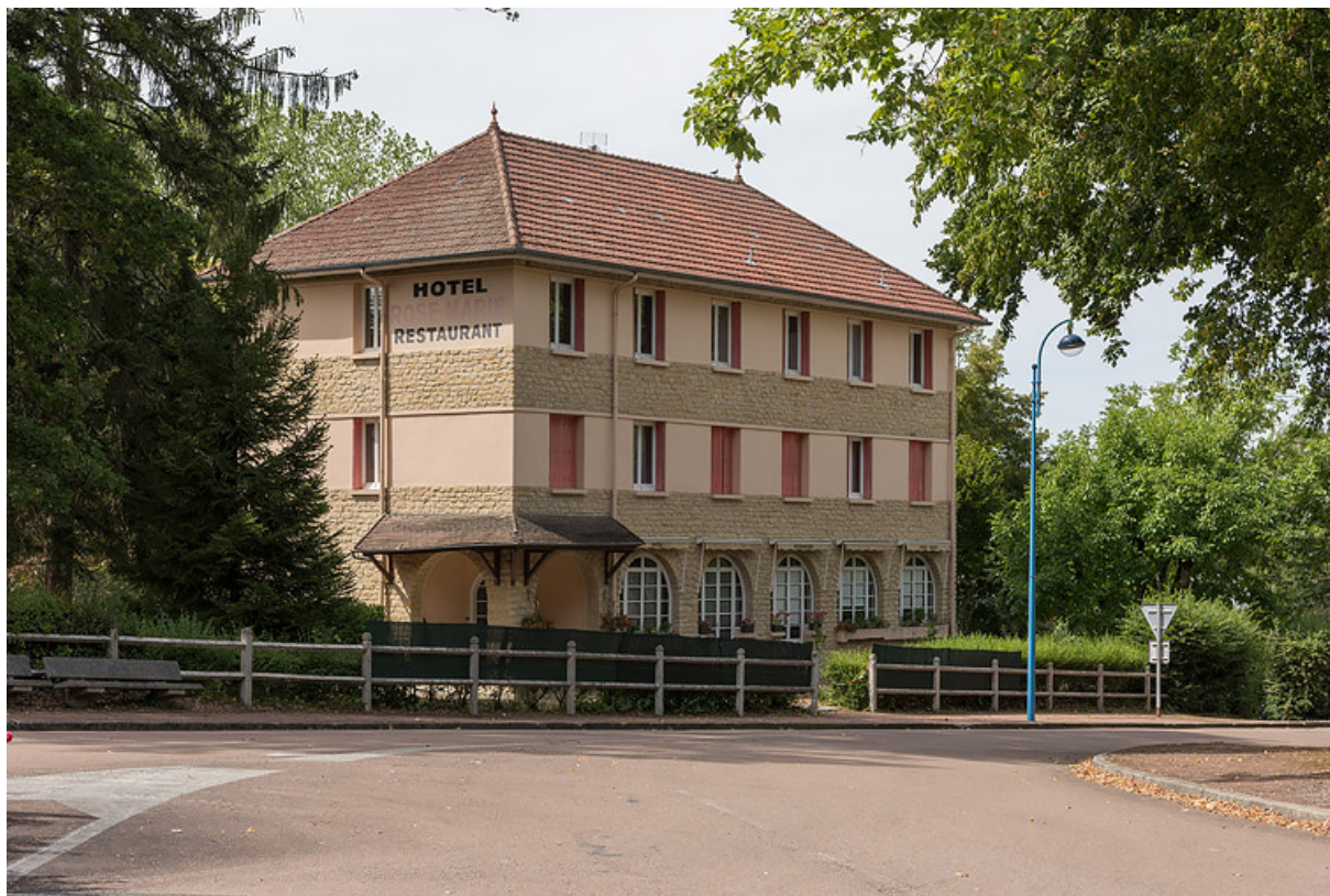
Élévation sur l'avenue du Docteur Segard.

58, Saint-Honoré-les-Bains, 1 avenue du Docteur Segard