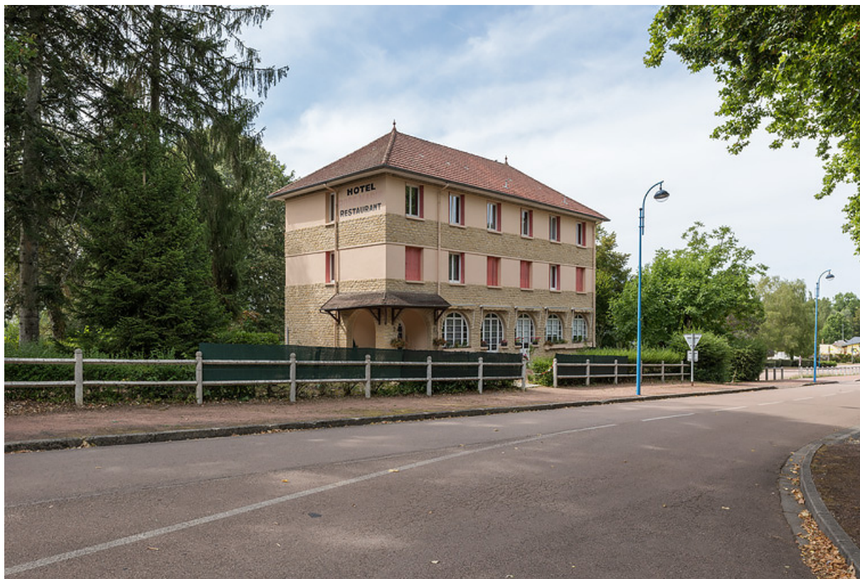
Situation de l'hôtel au croisement de la rue Joseph Duriaux et de l'avenue du docteur Segard, en face des terrains de tennis. 58, Saint-Honoré-les-Bains, 1 avenue du Docteur Segard