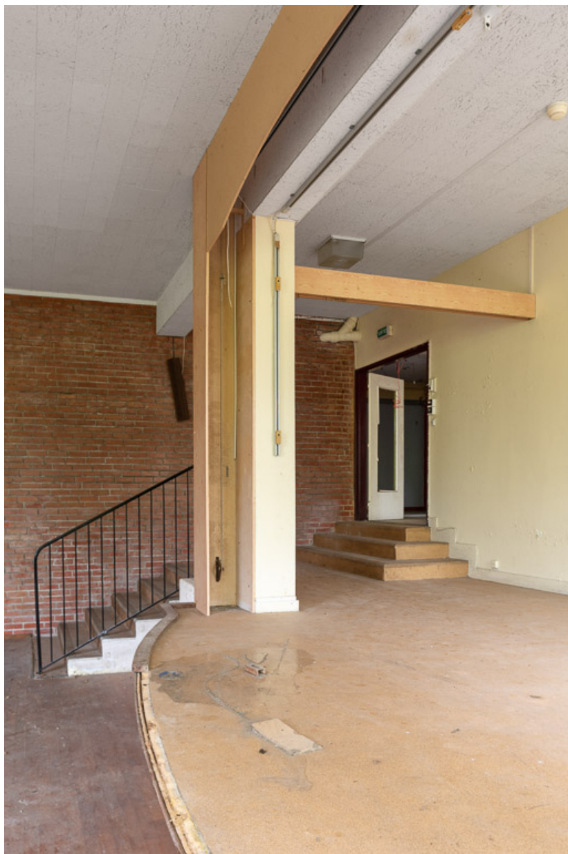
Salle de spectacle dans le corps de bâtiment principal.

58, Saint-Honoré-les-Bains, 20 avenue Jean Mermoz