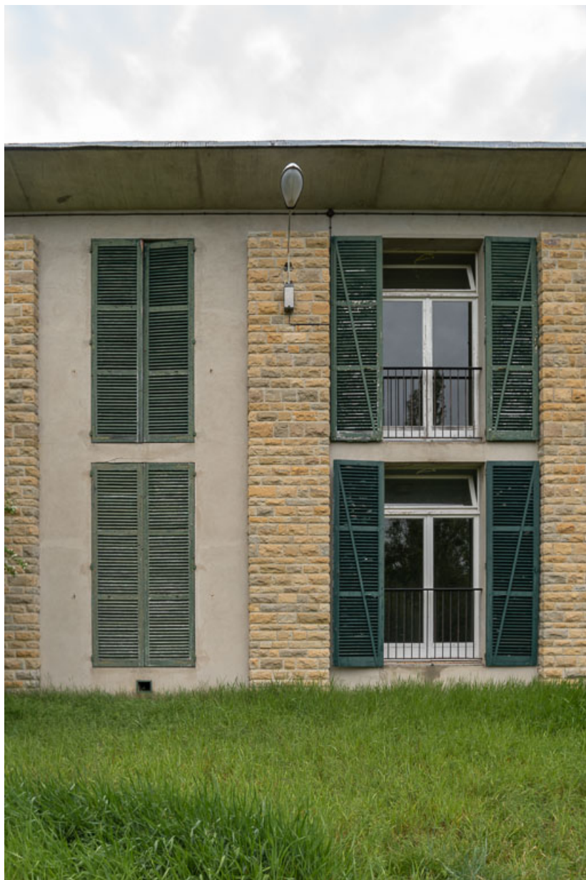
Élévation extérieure de l'aile Bellevue, côté sud, détail de deux travées.

58, Saint-Honoré-les-Bains, 20 avenue Jean Mermoz