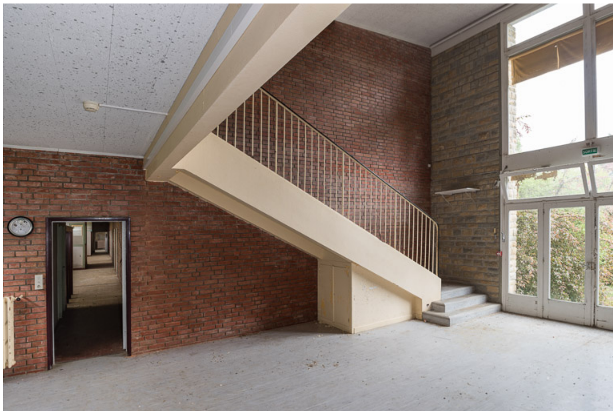
Salle de jeux au centre de l'aile Bellevue, escalier, palier inférieur.

58, Saint-Honoré-les-Bains, 20 avenue Jean Mermoz