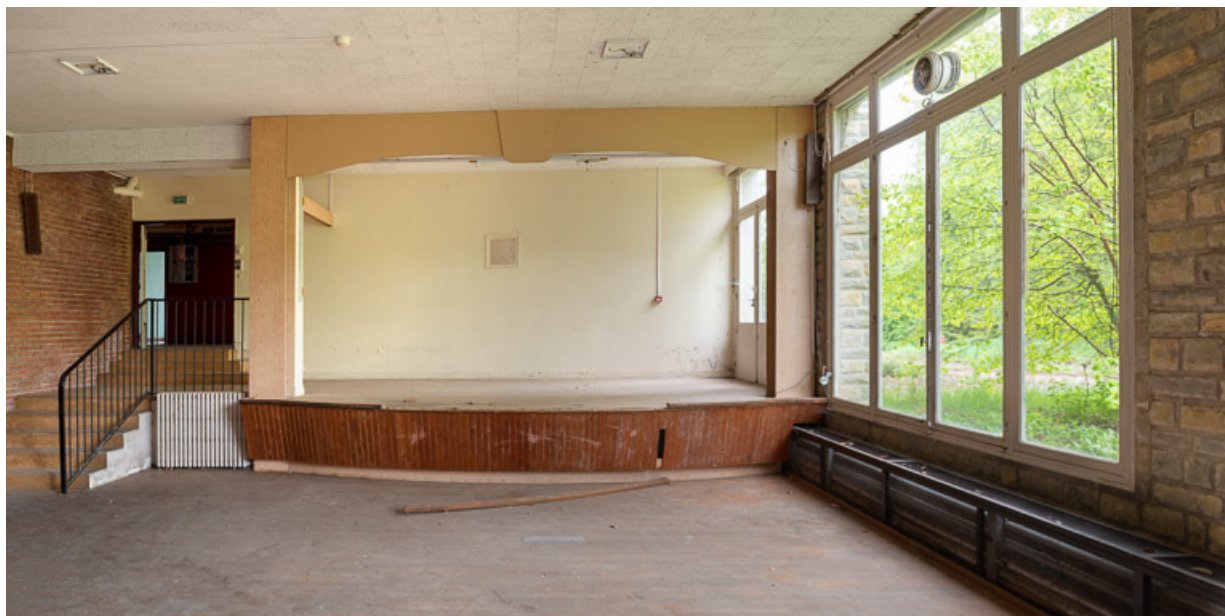
Salle de spectacle dans le corps de bâtiment principal.

58, Saint-Honoré-les-Bains, 20 avenue Jean Mermoz