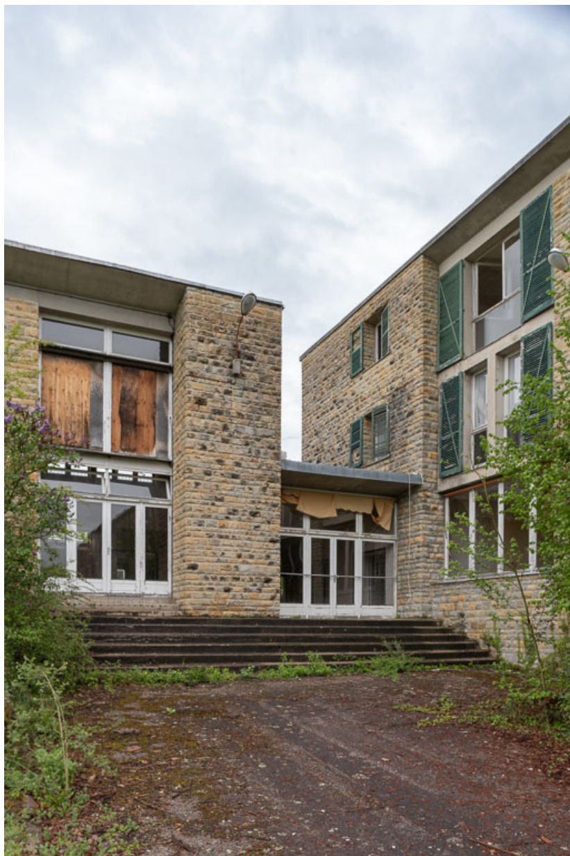
Élévation extérieure de l'aile Bellevue, côté sud, jonction avec le corps de bâtiment principal. 58, Saint-Honoré-les-Bains, 20 avenue Jean Mermoz