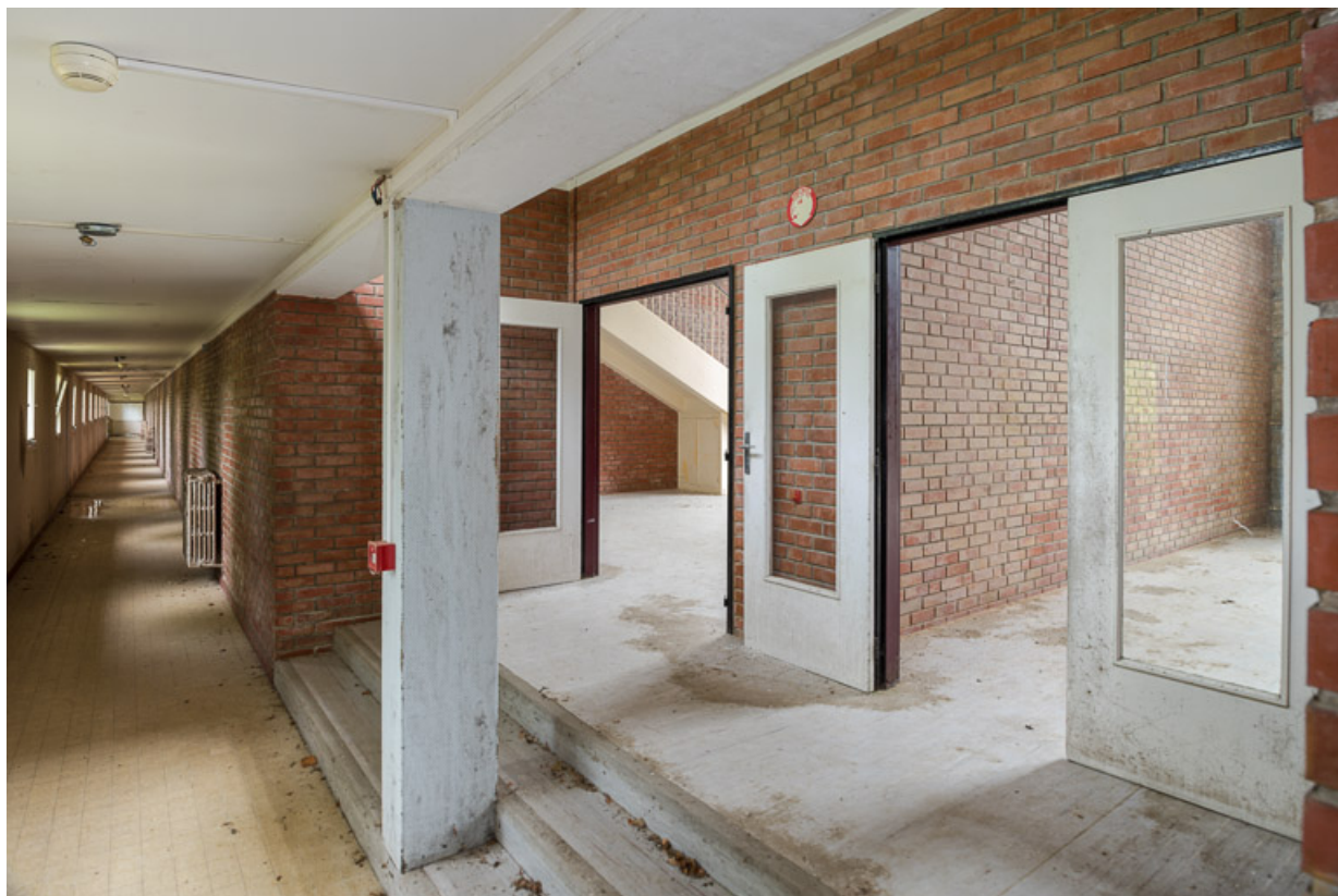
Couloir nord de l'aile Bellevue, vue en direction de l'est, et accès aux salles de jeux.

58, Saint-Honoré-les-Bains, 20 avenue Jean Mermoz