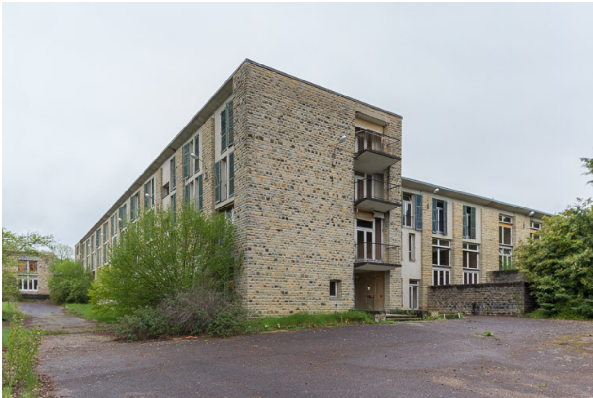
Élévation extérieure du corps de bâtiment principal.

58, Saint-Honoré-les-Bains, 20 avenue Jean Mermoz