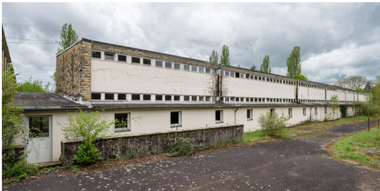
Élévation extérieure de l'aile Bellevue, côté nord. 58, Saint-Honoré-les-Bains, 20 avenue Jean Mermoz

N° de l'illustration : 20195800097NUC4AQ