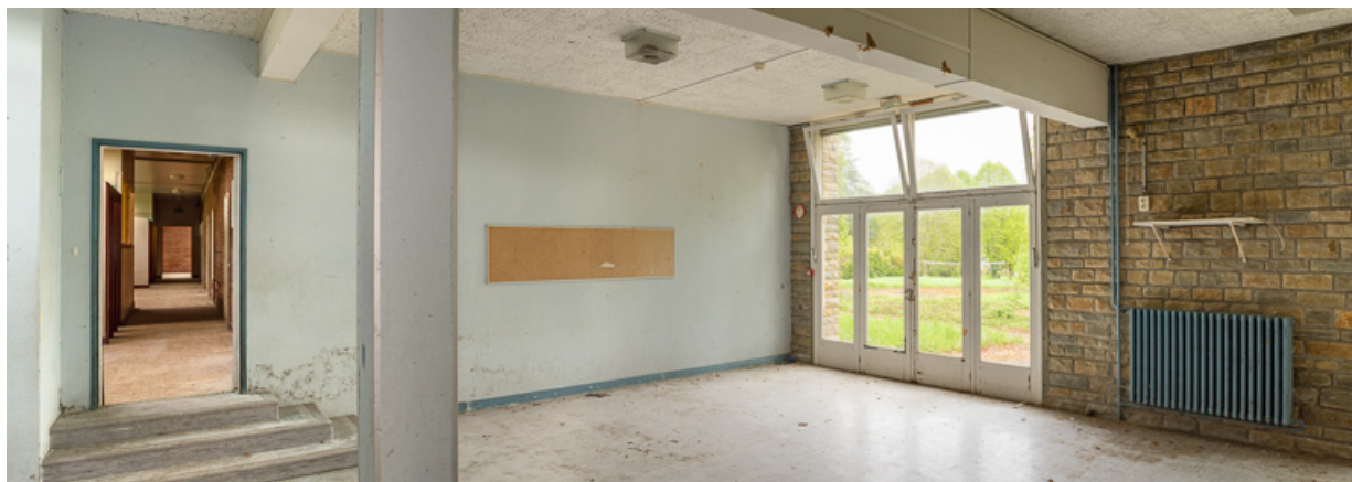
Salle de jeux à l'extrémité ouest de l'aile Bellevue. 58, Saint-Honoré-les-Bains, 20 avenue Jean Mermoz

N° de l'illustration : 20195800087NUC4AQ