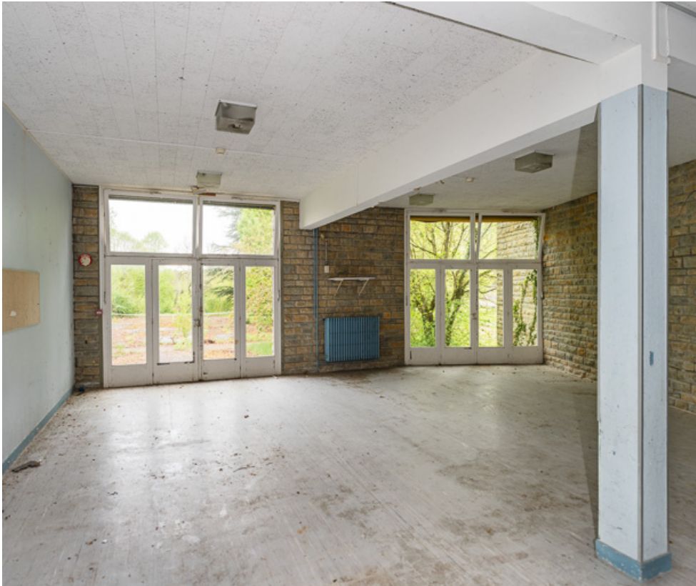
Salle de jeux à l'extrémité ouest de l'aile Bellevue.

58, Saint-Honoré-les-Bains, 20 avenue Jean Mermoz