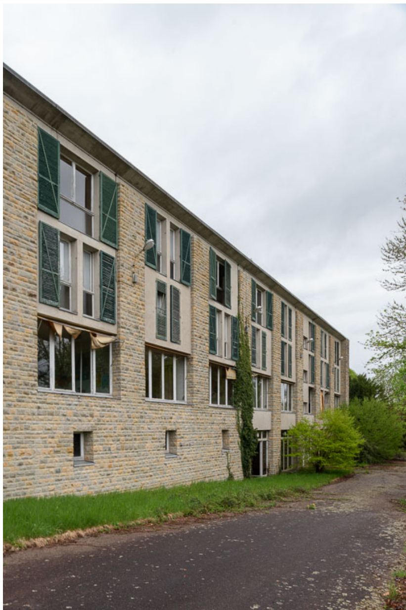
Élévation extérieure du corps de bâtiment principal.

58, Saint-Honoré-les-Bains, 20 avenue Jean Mermoz