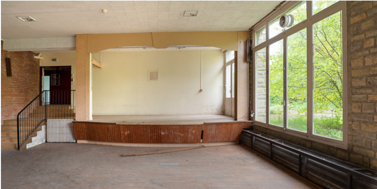
Salle de spectacle dans le corps de bâtiment principal.

58, Saint-Honoré-les-Bains, 20 avenue Jean Mermoz