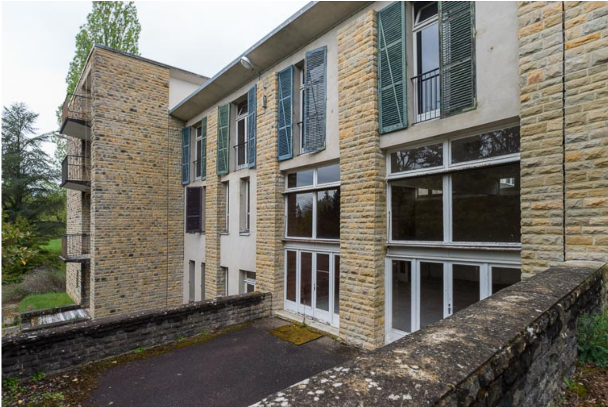
Élévation extérieure de l'aile Régina, côté sud, jonction avec le corps de bâtiment principal.

58, Saint-Honoré-les-Bains, 20 avenue Jean Mermoz