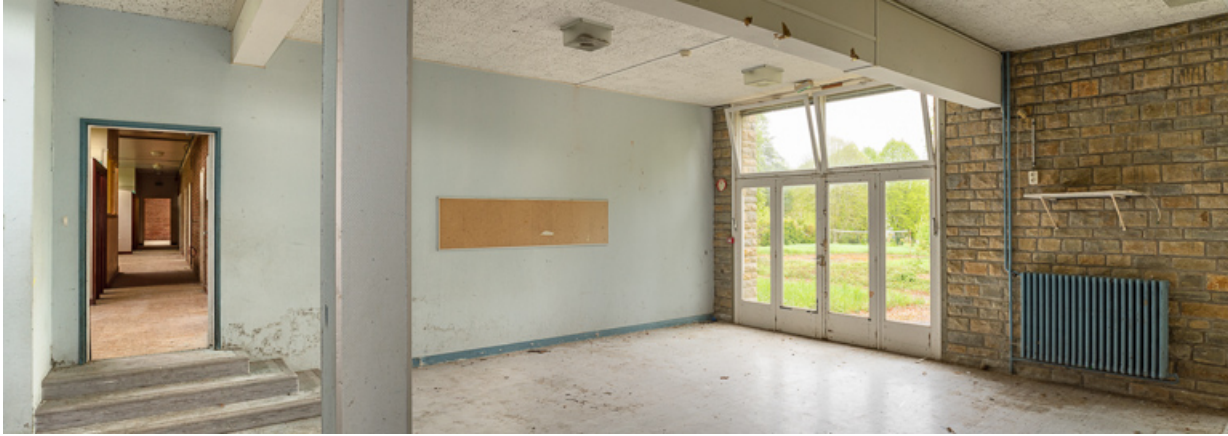
Salle de jeux à l'extrémité ouest de l'aile Bellevue.

58, Saint-Honoré-les-Bains, 20 avenue Jean Mermoz