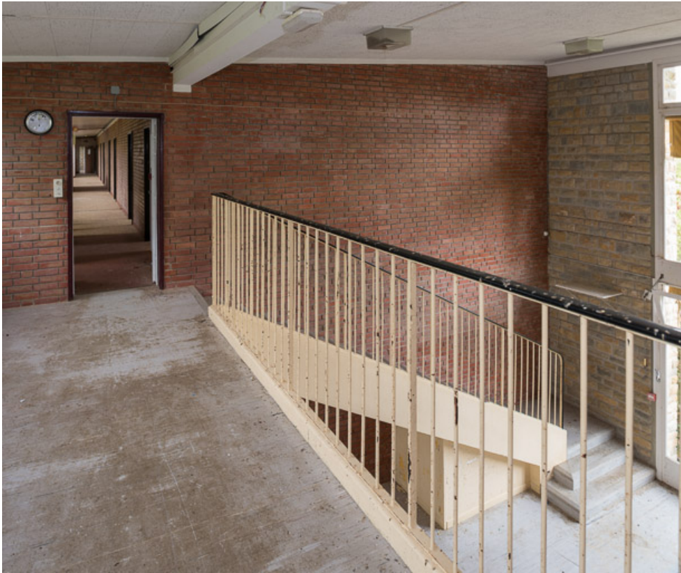
Salle de jeux au centre de l'aile Bellevue, escalier, palier supérieur. 58, Saint-Honoré-les-Bains, 20 avenue Jean Mermoz

N° de l'illustration : 20195800086NUC4AQ