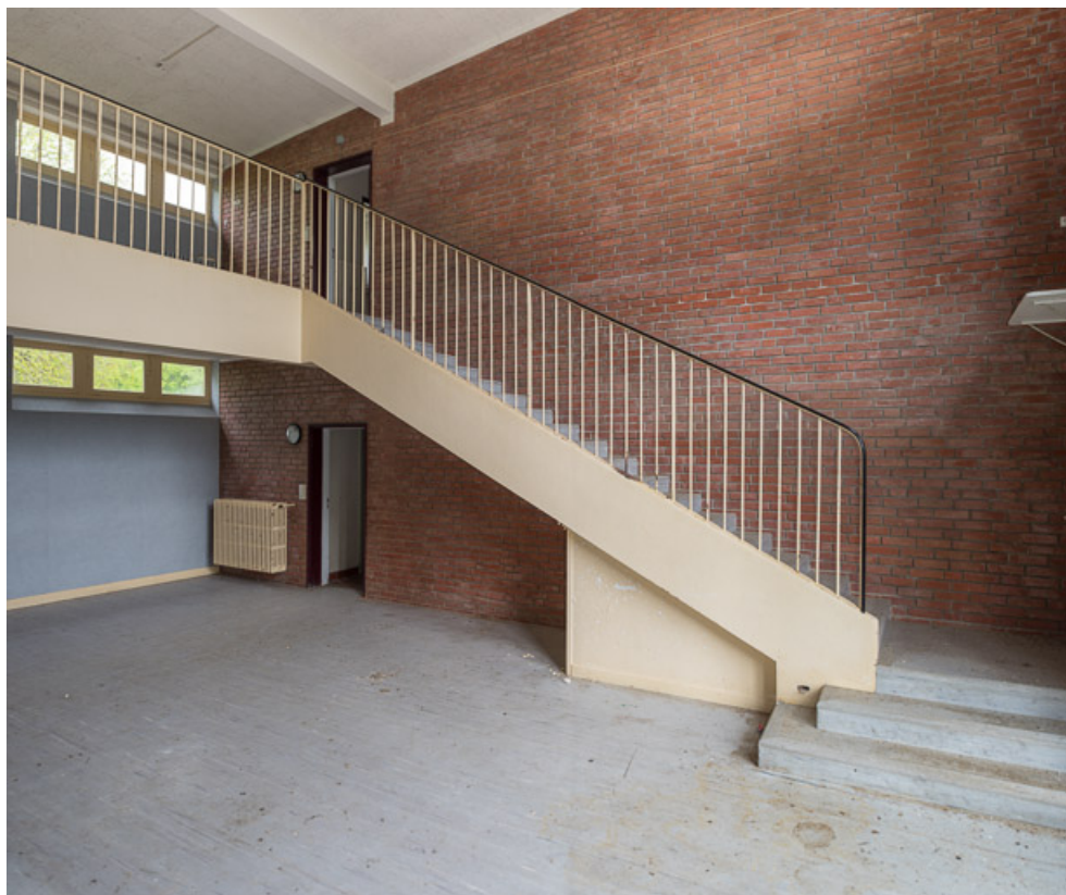
Salle de jeux au centre de l'aile Bellevue, escalier, palier inférieur.

58, Saint-Honoré-les-Bains, 20 avenue Jean Mermoz