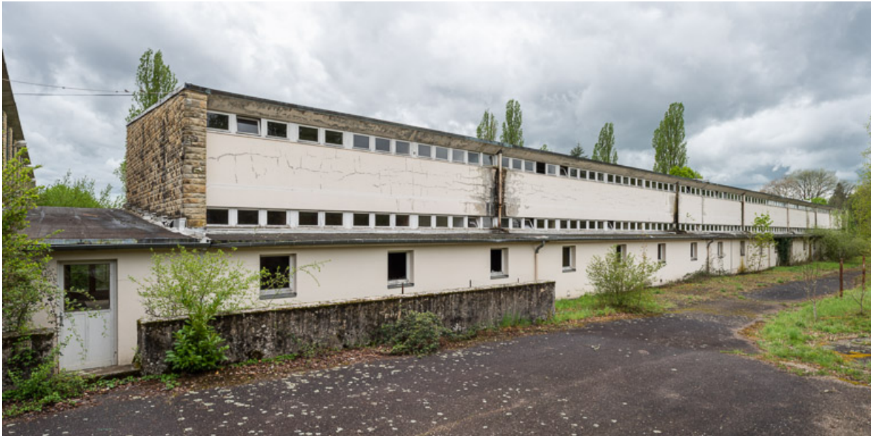
Élévation extérieure de l'aile Bellevue, côté nord. 58, Saint-Honoré-les-Bains, 20 avenue Jean Mermoz

N° de l'illustration : 20195800097NUC4AQ