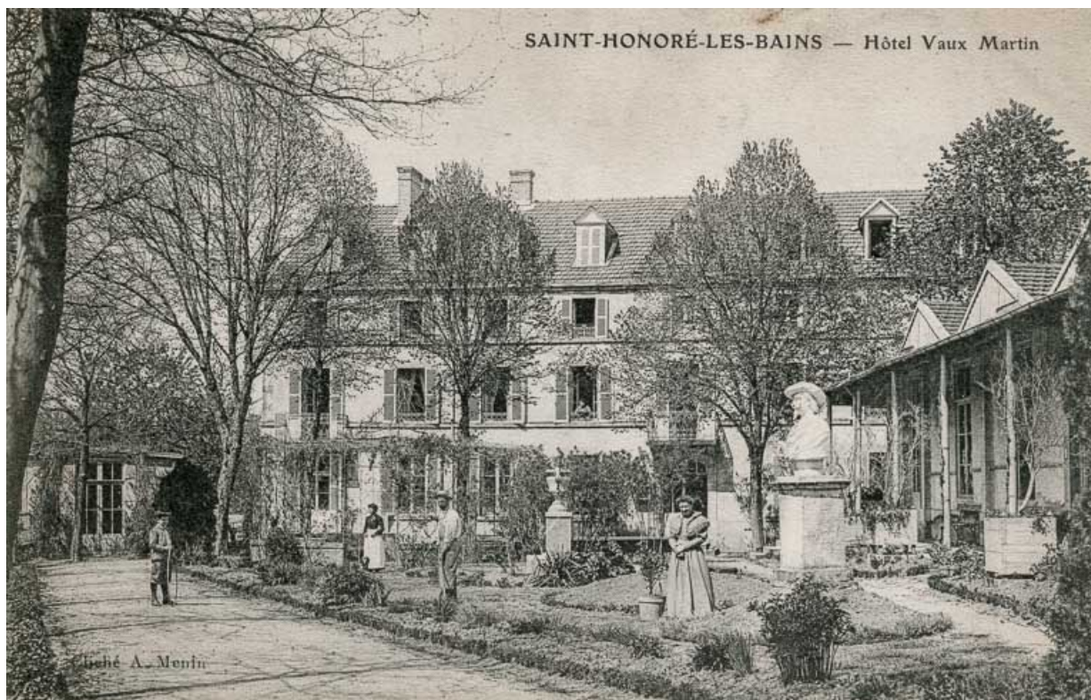
Façade sur le jardin.

58, Saint-Honoré-les-Bains avenue Jean Mermoz