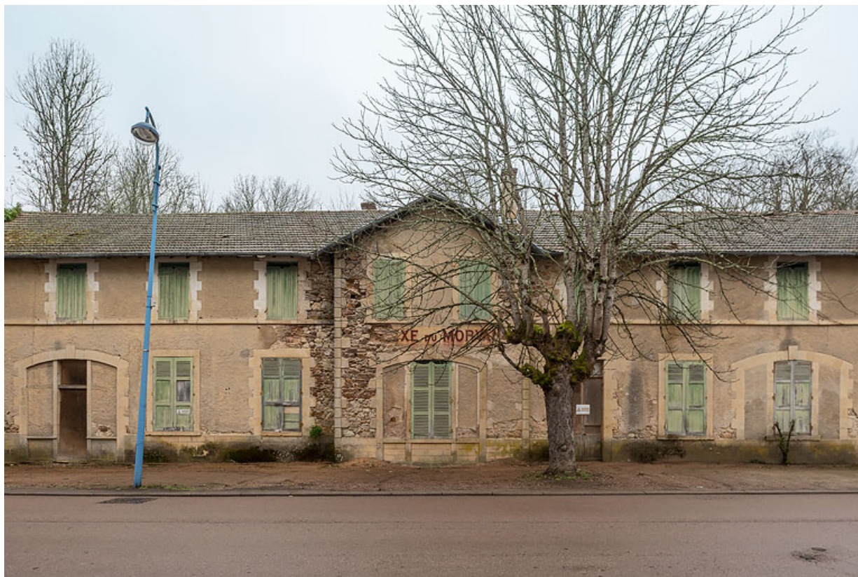
Partie centrale de la façade principale, vue de face.

58, Saint-Honoré-les-Bains, 16 avenue Jean Mermoz