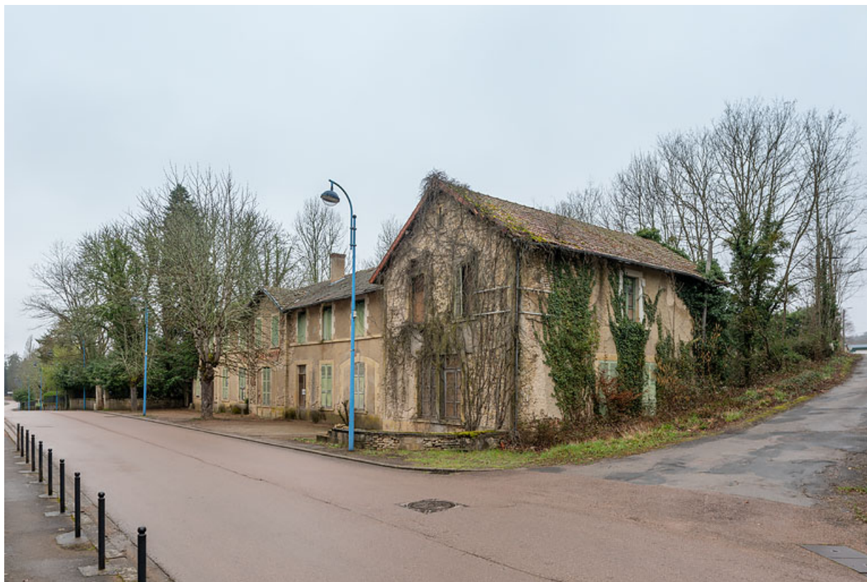
Façade principale, vue depuis le sud-est.

58, Saint-Honoré-les-Bains, 16 avenue Jean Mermoz