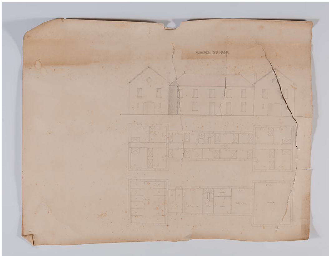
Projet pour une auberge des bains, version avec pavillons latéraux, plans et élévation.

58, Saint-Honoré-les-Bains, 16 avenue Jean Mermoz