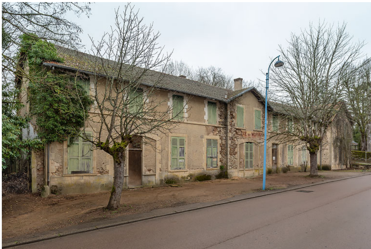
Façade principale, vue depuis le sud-ouest.

58, Saint-Honoré-les-Bains, 16 avenue Jean Mermoz