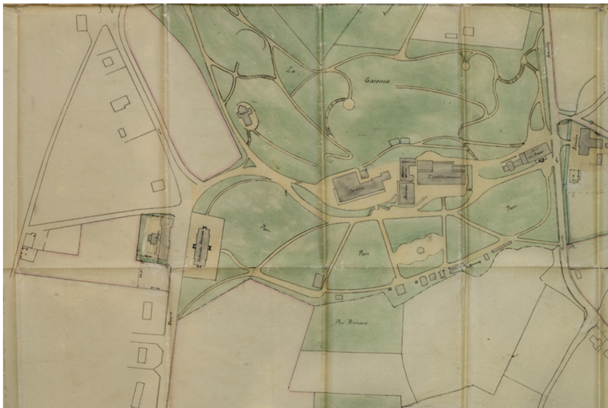
Situation de l'établissement thermal au sein du parc thermal en 1900.

58, Saint-Honoré-les-Bains avenue du Docteur Segard